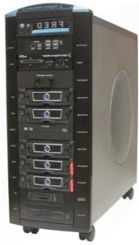
Slika 3.1. FRED uređaj [24]