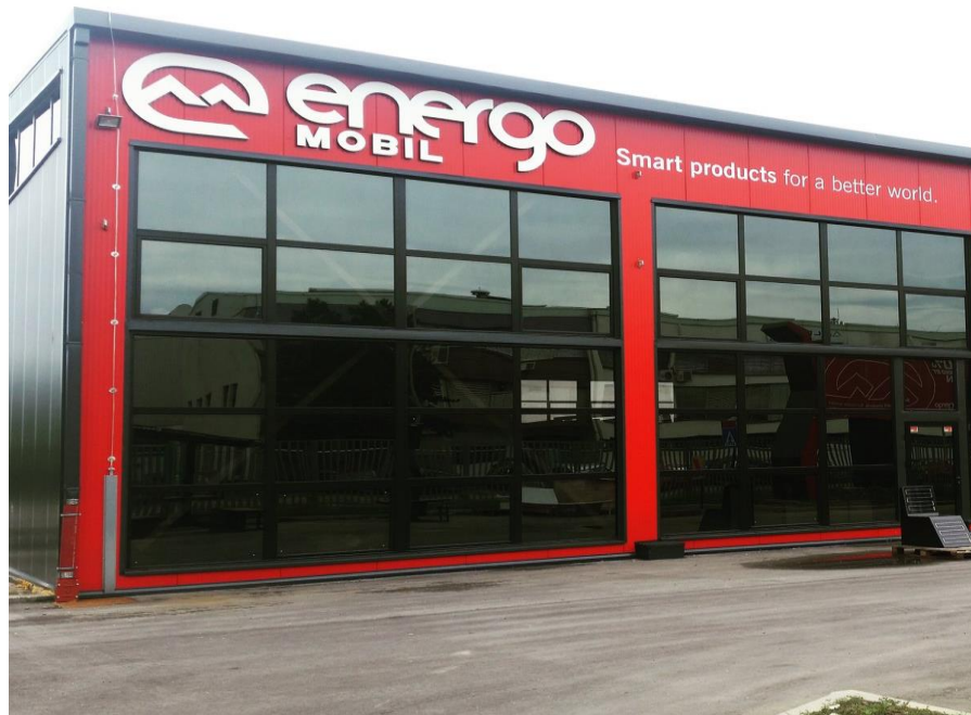
Slika 11: Proizvodnja i skladištenje solarnih proizvoda (Dostupno na: https://pbs.twimg.com/media/CqhZmnaWAAAUkET.jpg , 15.8.2018.)

Prije dvije godine razvijaju brend naziva Energomobil kojim se proširuje opseg razvoja i proizvodnje različitih solarnih proizvoda kao što su to pametne autobusne stanice, pametne klupe, solarne oglasne table, solarna stabla te solarni jumbo plakati. Također, nudi se i mogućnost projektiranja različitih proizvoda na temelju zahtjeva pojedinih kupaca. Solarne proizvode Energomobil brenda je moguće zateći diljem Hrvatske. Neki primjeri toga su: solarna klupa u Garešnici, pametna autobusna stanica u Rijeci, solarno stablo u Pazinu.