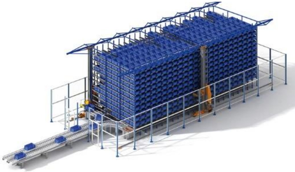
Slika 2: Grafička ilustracija za AS/RS (Dostupno na https://centrixdt.com/wp-content/uploads/2016/09/mini-load-asrs-centrix-a.jpg , 4.7.2018.)

Korištenje AS/RS-a dovodi do nekih značajnijih prednosti u procesima rada sa robom: