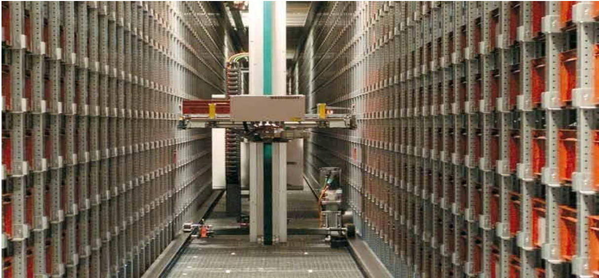
Slika 1: Primjer AS/RS sustava (Dostupno na:

http://ritmindustry.com/upload/items/211/211517.jpg , 26.6.2018)