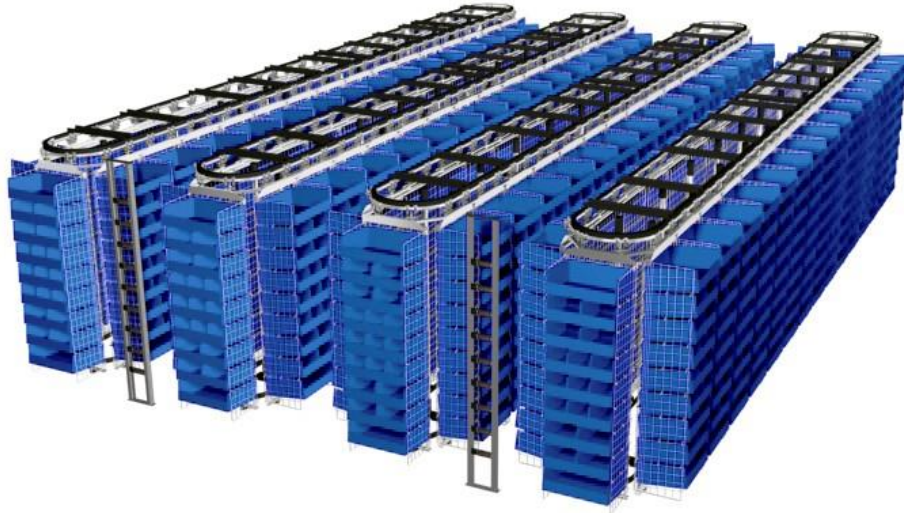
Slika 4: Primjer horizontalnog sustava sa košarama

trenutno nadmašuju robotske sustave te trenutno predstavljaju najbolje AS/RS rješenje. Primjer takvog sustava možemo vidjeti na slici 4.