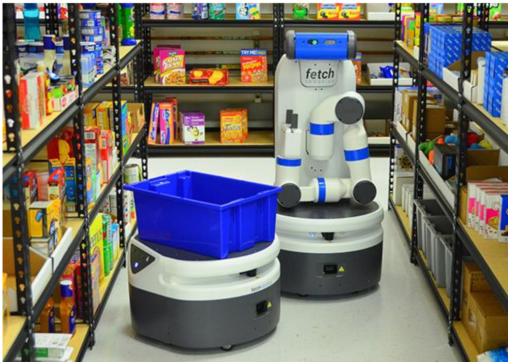
Slika 10: Prikaz robota za dohvaćanje i robota za prijevoz robe (Dostupno na: https://spectrum.ieee.org/image/MjYyNzcwOQ.jpeg , 11.8.2018)

Postoje različite vrste robotizacije skladišta, te je svaki sustav prilagođen skladištu u kojem radi. Za primjer ćemo ovdje koristiti robote tvrtke Fetch Robotics. Potrebno je napomenuti da su ti roboti još uvijek u razvoju, no odabrani su jer obećavaju značajnu prednost nad trenutnim robotskim sustavima koju su u praktičnoj primjeni. Fetch Robotics je razvio dvije vrste robotskih vozila, od kojih svaki obavlja određene zadatke. Jedan robot služi za prijevoz robe dok drugi služi za dohvaćanje robe sa polica te stavljanje te robe na robota za prijevoz [14]. Primjer toga možemo vidjeti na slici 10.