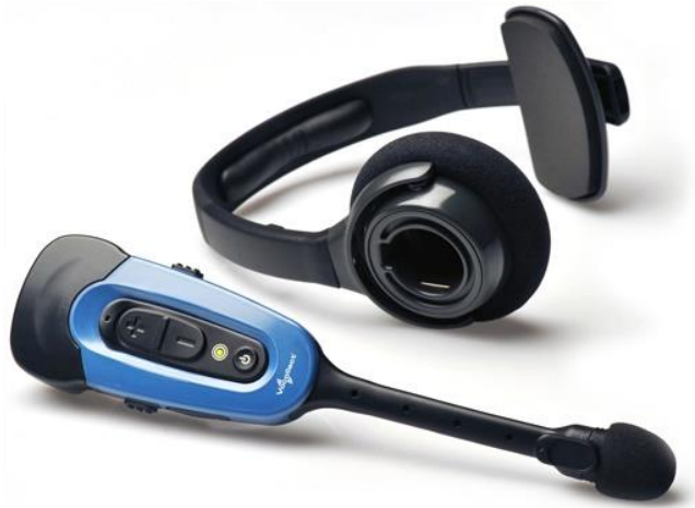
Slika 7: Primjer Pick-To-Voice uređaja za radnike u skladištu

Svaki od uređaja na raspolaganju ima svoju IP adresu. Kada se radnik prijavi na određeni uređaj, ostvaruje se telefonska veza sa lokalnim poslužiteljom. Radnik će zatim odabrati određene postavke rada na svom uređaju kao što je to npr. jezik glasovnog sučelja. Nakon odabira postavki rada, sustav će tražiti identifikacijski broj radnika. Nakon toga će radnik biti zabilježen u sustav te će mu se dati određena narudžba koju treba ispuniti.