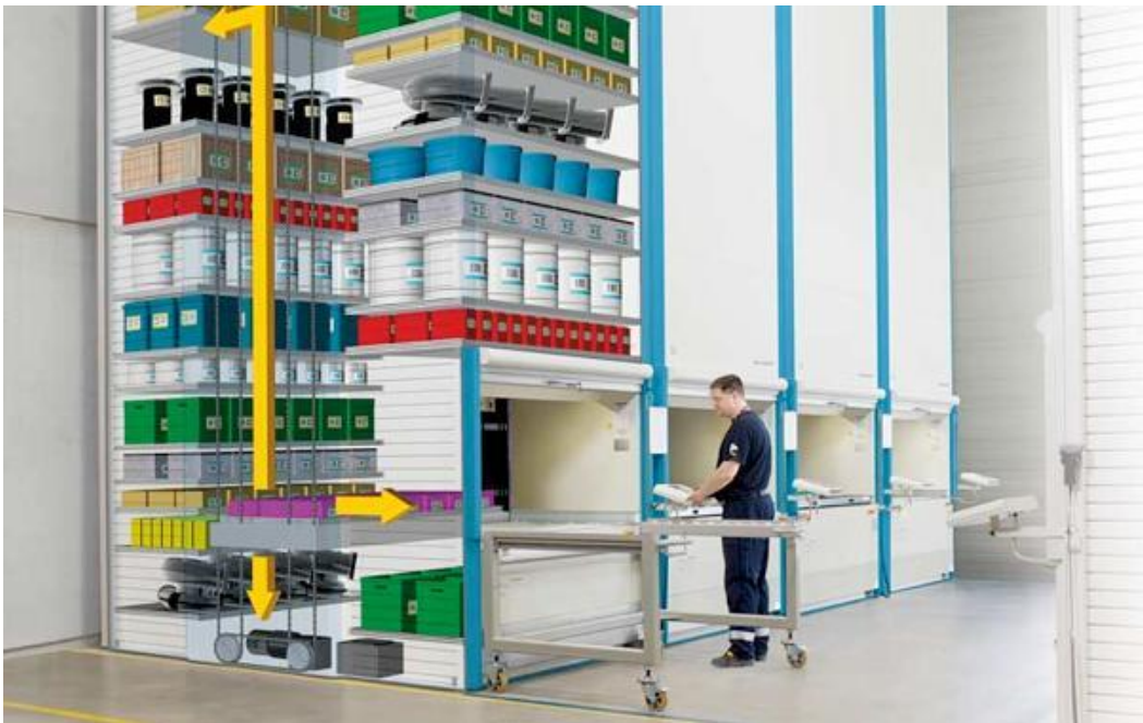
Slika 3: Prikaz rada VML sustava (Dostupno na: http://expertherald.com/wp-content/uploads/2017/12/Vertical-Lift-Module-VLM.jpg , 4.7.2018.)

VML se može izraditi vrlo visoko, odnosno sve do samog vrha konstrukcije skladišta u kojemu se nalazi da bi se maksimizirala iskoristivost. Teret se pohranjuje u spremnike koji se nalaze unutra konstrukcije. Jednom kada operator zatraži određeni spremnik, ostali spremnici se pomiču vertikalno sve dok odgovarajući spremnik ne dođe do operatera. VML sustavi se prodaju u različitim konfiguracijama te se najčešće protežu kroz više katova unutar postrojenja. Samim time imaju i više otvora na sebi za pristup robi. Za razliku od velikih AS/RS sustava, VML sustavi su modularni te se lako ugrađuju u već postojeća skladišta dok se veliki AS/RS sustavi moraju zasebno razvijati za svako skladište posebno te se radi kompletna reorganizacija skladišta. Primjer VML sustava možemo vidjeti na slici 3: