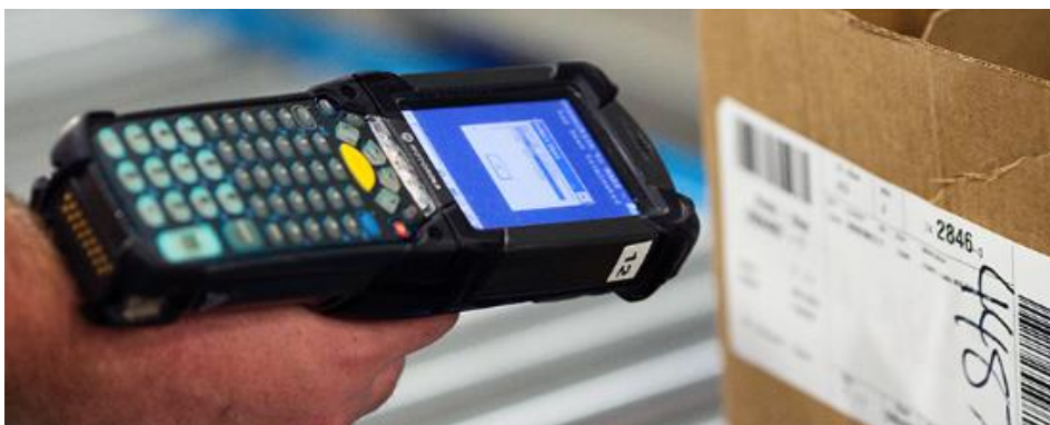
Slika 5: Primjer RF uređaja za skeniranje bar koda

RF (eng. Radio-frequency ) skeniranje predstavlja fizički posao sakupljanja robe iz skladišta. Za RF skeniranje se koristi uređaj koji se sastoji najčešće od 3 djela, a to su zaslon sa informacijama, tipkovnica za unos te modul za skeniranje bar koda proizvoda. Primjer takvog uređaja možemo vidjeti na slici 5.