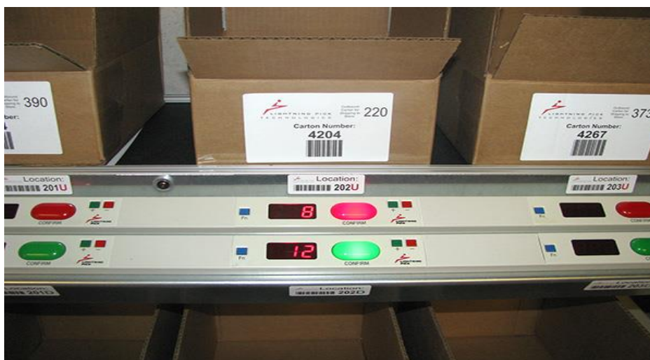
Slika 6: Primjer Pick-To-Light uređaja u skladištu

Glavna prednost ovih sustava je jednostavnost te najčešće rade u skladu sa RF sustavima koji su već opisani. Radnici u skladištu su podijeljeni u zone u kojima rade. Za početak, radnik mora skenirati bar kod narudžbe na pomoću svog RF uređaja. Nakon toga će glavni sustav automatski osvijetliti uređaje ispod polica na kojima se nalazi roba koju je potrebno preuzeti. Isto tako će svaki uređaj ispisati i količinu robe koju operator mora uzeti. Jednom kada operator preuzme zadanu količinu robe, potvrđuje da je roba preuzeta tako što pritišće gumb na tom uređaju koji je zadužen za preuzetu robu. Nakon toga operator odlazi do sljedeće osvijetljenog uređaja i postupak se ponavlja. Operatori su obično podijeljeni već navedene zone kako bi se smanjilo nepotrebno vrijeme hoda pojedinog operatora. Nakon što pojedini operator preuzme svu robu za zadanu narudžbu iz svoje zone, on prosljeđuje narudžbu idućem operatoru u drugoj zoni da bi on nastavio sa nadopunjavanjem iste. Primjer Pick-To-Light uređaja možemo vidjeti na slici 6.