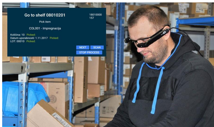
Slika 9: Primjer primjene uređaja proširene stvarnosti za rad u skladištu

Princip rada se temelji na povezanosti sustava sa središnjim računalom skladišta u kojem se nalazi sustav. Glavno računalo obrađuje narudžbe te upravlja sustavom proširene stvarnosti. Radnik odabire jedan od uređaja te se prijavljuje na njega. Nakon toga mu se dodjeljuje narudžba koju treba ispuniti. Na zaslonu HMD uređaja mu se prikazuju upute. Za početak, u koji dio skladišta treba otići. Nakon toga mu se prikazuje točna lokacija proizvoda. Radnik nakon dolaska na lokaciju skenira bar kod lokacije proizvoda. Ako je lokacija netočna, na zaslonu će mu se prikazati odgovarajuća informacija. Ako je radnik na točnoj lokaciji, sustav će mu ispisati količinu proizvoda kojega treba preuzeti. Nakon toga se usmjerava na drugu lokaciju i postupak se ponavlja. Na poslijetku, radnik odlazi do lokacije za odvoz narudžbi te očitava kod za završetak narudžbe. Sustav mu zatim dodjeljuje iduću narudžbu za nastavak rada. Primjer izgleda i uporabe takvog sustava zajedno sa prikazom jednostavnog sučelja možemo vidjeti na slici 9.