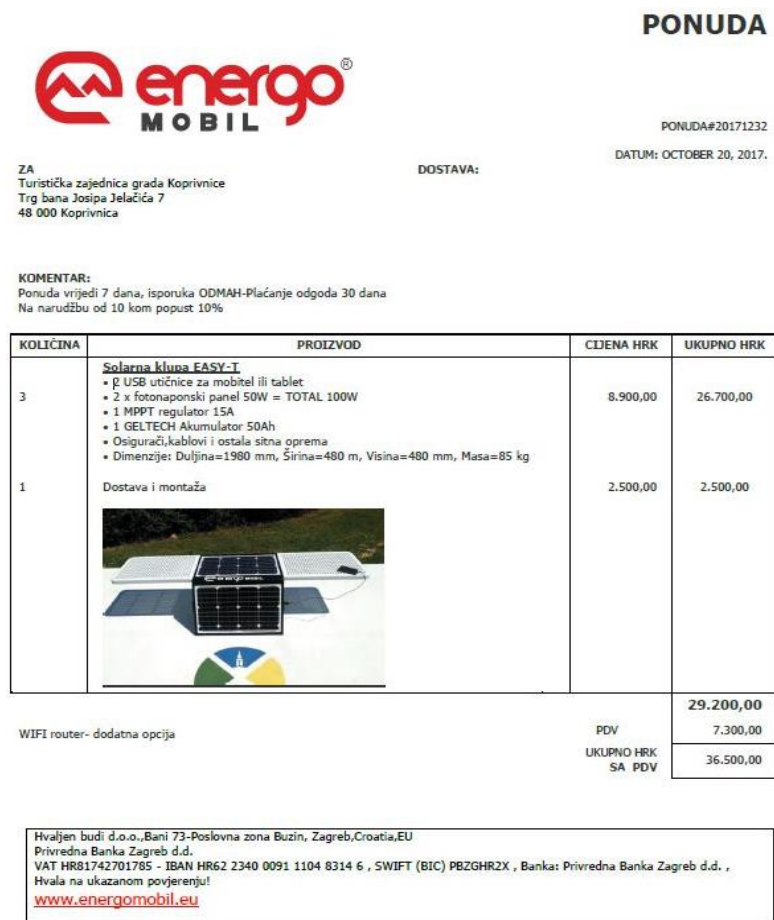
Slika 13: Primjer ponude postojećih proizvoda

Kao što je već prije navedeno, Energomobil nudi i izradu proizvoda prema kupčevim željama. Kupac dolazi sa svojim zahtjevima te ih opisuje zaposlenicima. Zaposlenici prvo pregledavaju pomoću aplikacije proizvode koji su najbližnji kupčevim željama te mu prezentiraju te proizvode. Kupac može sam doći u maloprodaju ili može svoje zahtjeve putem elektroničke pošte. Ukoliko zahtjev stigne pomoću elektroničke pošte, zaposlenici također nazad šalju primjerke postojećih proizvoda pomoću pošte. Primjer toga možemo vidjeti na slici 13.