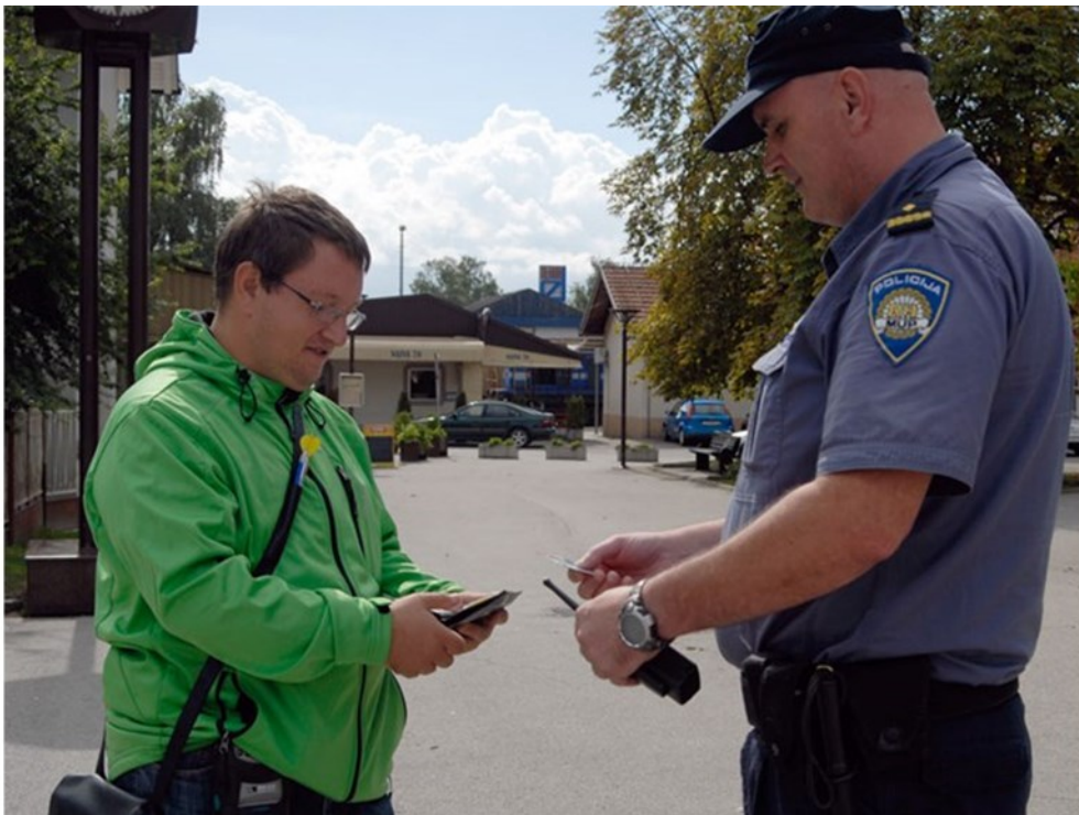
Slika 5. Primjer komuniciranja policijskog službenika s građaninom