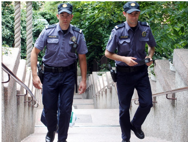
Slika 7. Primjer policajci u službenoj odori

Na odori ne smije biti vidljiv nakit ili nekim otkrivenim dijelovima tijela. Također, remen, sat i sl. moraju biti prikladnih boja i veličine kako ne bi narušili izgled policijskog službenika. Vidi prikaz slike 8.