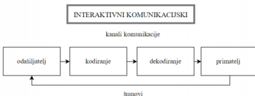
Slika 2. Interaktivni komunikacijski model komunikacijskog procesa

Prema Panian (2005.) izvor poruke proizvodi podatke. Koder je uređaj ili programski proizvod koji ima sposobnost pretvaranja odnosno kodiranja podataka iz jedne vrste signala u neku drugu koja je prilagođena komunikacijskome kanalu. Komunikacijski kanal je medij, tj. sredstvo kojim je poruku moguće prenijeti. Dekoder je uređaj ili programski proizvod, koji ima sposobnost pretvaranja. Dekodiranja podataka iz jedne vrste signala, prilagođenu komunikacijskome kanalu, u neku drugu, prilagođenu primatelju podataka ili informacija. Vidi prikaz sliku 1. (Pejić Bach i sur., 2016., str.154)