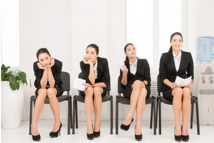
Slika 4. Primjer neverbalnih znakova

Geste su važan dio svakodnevne neverbalne komunikacije. One se najčešće događaju spontano prilikom razgovora. Pokreti dijelova tijela govore o tome kako se zapravo osjećamo, tj. izražavano svoje misli ili osjećanja. Geste moraju biti prilagođene okolini i situaciji. Kako bi olakšali komunikaciju pokrete treba uskladiti s riječima, a riječi s pokretima. Za što bolje usvajanje oblika neverbalne komunikacije, potrebna je vježba. Idealno mjesto za vježbanje govora tijela i izražavanja jest pred ogledalom. ( Neverbalna komunikacija: govor tijela u svakodnevnoj interakciji , 2017.)