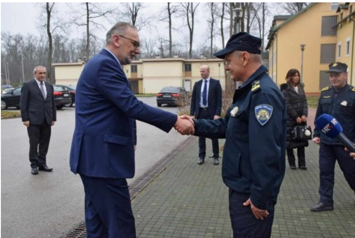
Slika 6. Primjer pozdravljanja policijskog službenika s višom vlasti

Pr. policijski službenici u odori rukom će pozdraviti najviše predstavnike izvršne, zakonodavne i sudbene vlasti Republike Hrvatske, kao što je prikazano na slici 6.