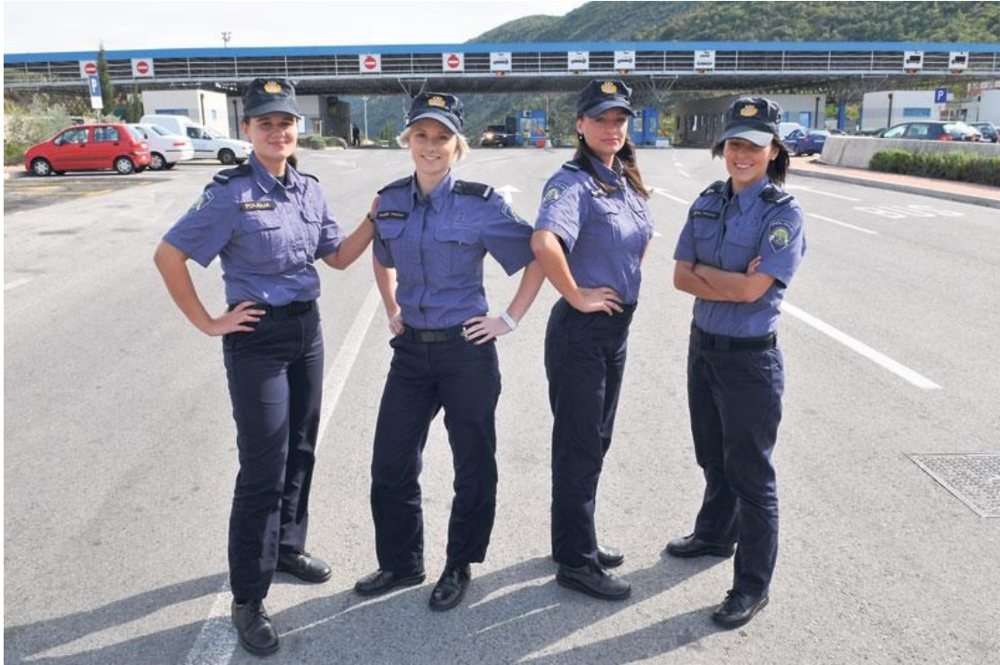
Slika 8. Primjer policijske službenice