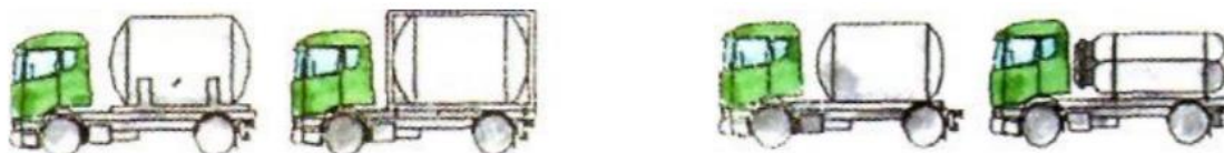
Slika 6. "AT" vozila

„AT“ – vozila koja nisu „FL“ i „OX“, a koja su namijenjena prijevozu opasnih tvari u kontejnerskim i prenosivim spremnicima ili MEGC-ijima zapremnine preko 3m 3 , u fiksnim ili izgradnim spremnicima zapremnine preko 1m 3 ili baterijskim vozilima zapremnine preko 1m 3 (Prijevoz opasnih tvari u cestovnom prometu (ADR), 2015)