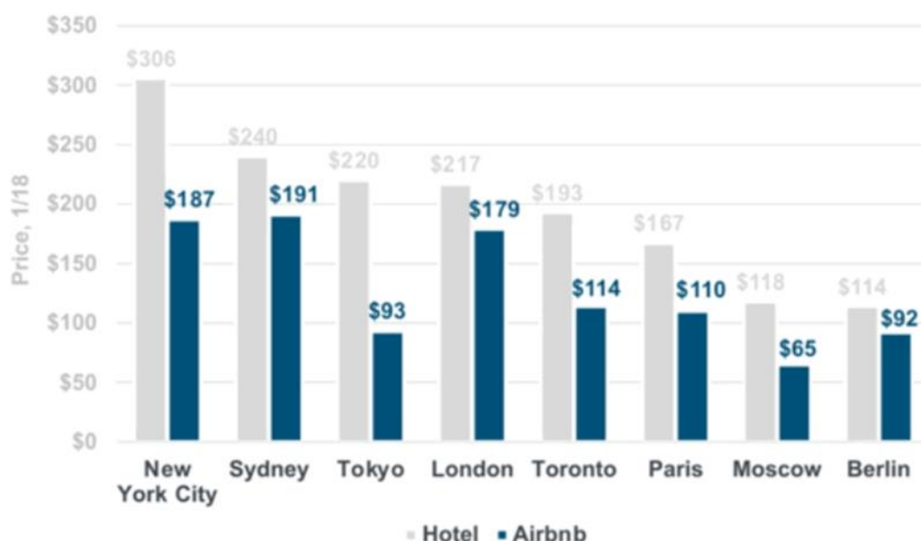
Slika 2. Airbnb vs. hoteli - usporedba cijena (Ping, 2018)

Prema ovom prikazu možemo procijeniti kako su zapravo noćenja u AirBnB-u jeftinija od prosječnih noćenja u hotelu. Naravno, ove brojke nisu uvijek ovakve. Kada se nudi neki luksuzan smještaj logično je i da će cijena noćenja biti puno viša od prosjeka. Cijene se određuju prema karakteristikama smještaja, broju noćenja i slično.