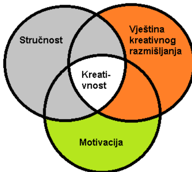
Slika 1. Tri sastavnice kreativnosti (Prema: Certo & Certo, 2009)

Motivacija prikazuje kako pojedinac mora biti snažan ili potreba pojedinca da bude kreativan. Ako pojedinac ima cilj u nekom poslu da primjeni svoju kreativnost, on će nastojati da na određen način uistinu postigne taj cilj. U motivaciji vrlo važnu ulogu imaju određeni procesi koji se mogu dogoditi i oni potiču u velikoj mjeri kreativnost, a neki od tih procesa su nagrade i kazne u organizacijama, zadovoljenjem osobnih interesa i snažnih doživljaja u određenim situacijama. Osobni interesi najviše potiču motiviranost, a u toj situaciji pojedinci najviše i primjenjuju kreativnost i to na najvišoj razini (Certo & Certo, 2009, str. 455). Autolimar koji završi srednju školu je stručna osoba, ali nakon škole ne završe svi autolimari u tom zanimanju na poslu, nego se zapošljavaju u raznim poduzećima i na raznim radnim mjestima. Nakon završene škole, ako netko nije motiviran za taj posao i nije kreativan teško da će raditi u toj struci. Autolimar će biti kreativan ako svoje probleme rješava na osobnoj razini, ako ga ti problemi zanimaju i svjestan je njih te ako traži cilj kako ukloniti postojeće probleme. Takav autolimar će uspjeti u svojoj struci i rješavat će probleme koji se pojavljuju prilikom popravka te će na njih gledati kao rješavanje izazova.