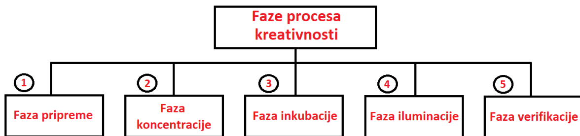
Slika 4. Faze procesa kreativnosti (Prema: Srića, 2003)

Posljednja faza kreativnog odlučivanja je faza verifikacije. Ona govori da se dobra ideja temelji na primjeni. Primijeniti neku novu ideju navodi svakog pojedinca da savlada sumnjičavost, strah, otpor, sumnju, ismijavanje i slično. Budući da je ideja razvijena, testirana, ocijenjena i prihvaćena teži se detaljnom planu za njezinu konkretnu primjenu (Srića, 2003, str. 50).