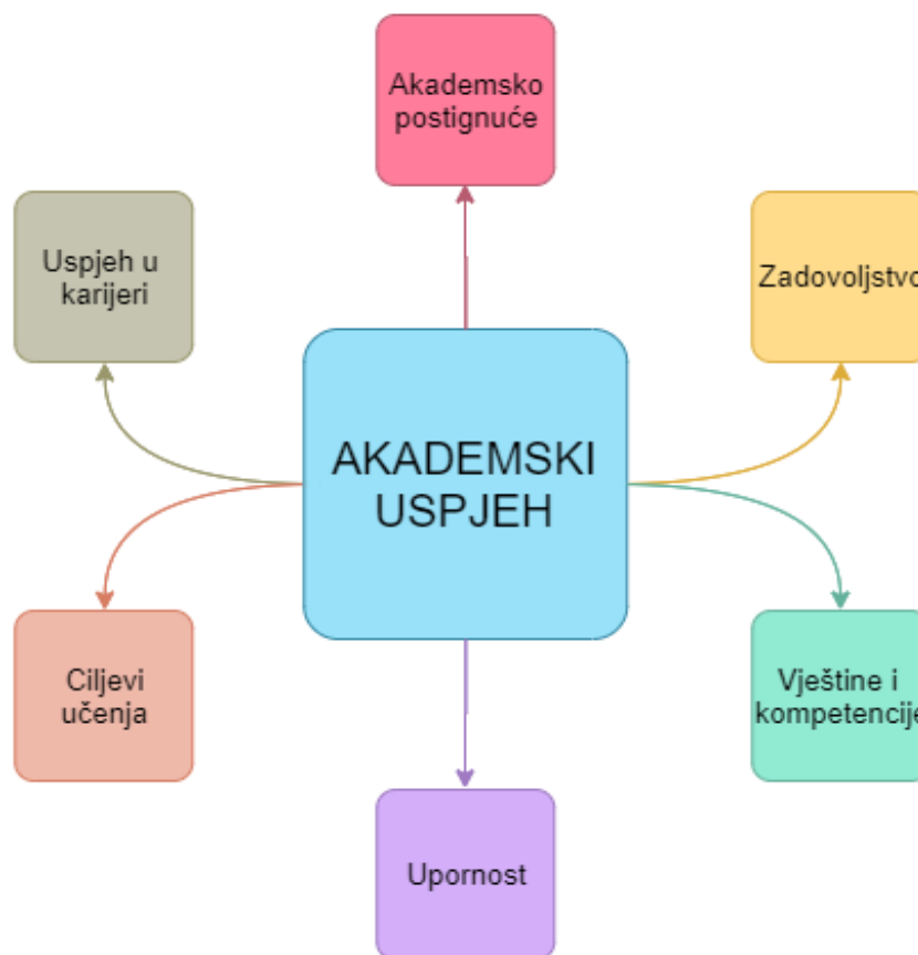
Slika 1: Model akademskog uspjeha [2, str. 5]

York, Gibson i Rankin [2] u provedenom istraživanju dolaze do teorijski utemeljene definicije akademskog uspjeha koja se sastoji od šest komponenta: akademskog postignuća, stjecanju vještina i kompetencija, postizanja ishoda učenja, zadovoljstva, upornosti i uspjeha u karijeri.