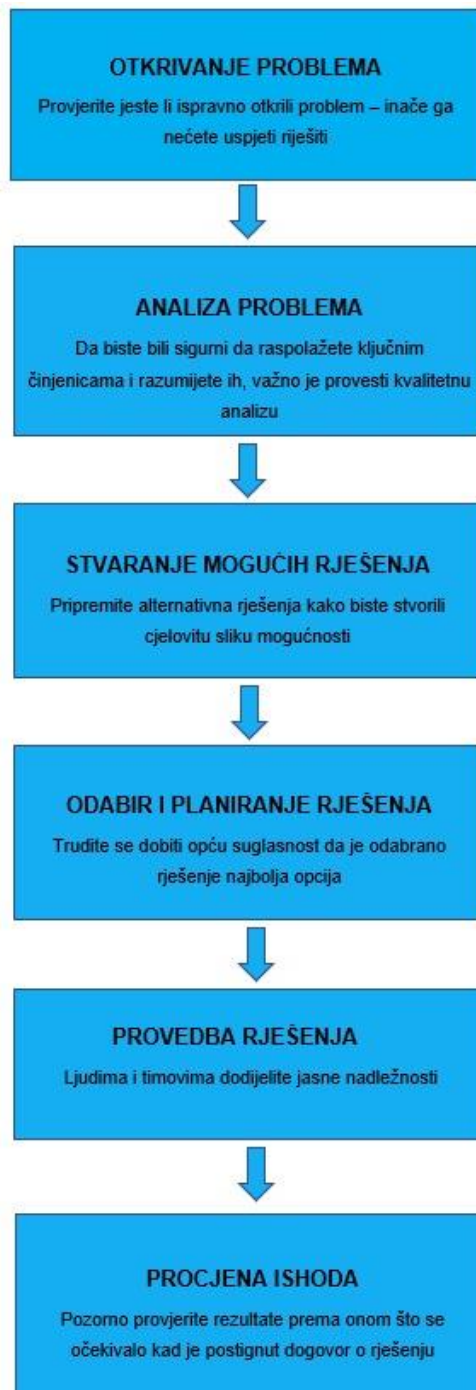
Slika 1. Korištenje procesa Potpunog upravljanja kvalitetom [2, str. 87].

procjenjuje je li odabrano rješenje dalo onakav ishod kakav se očekivao prilikom rasprave o odabiru rješenja [2].