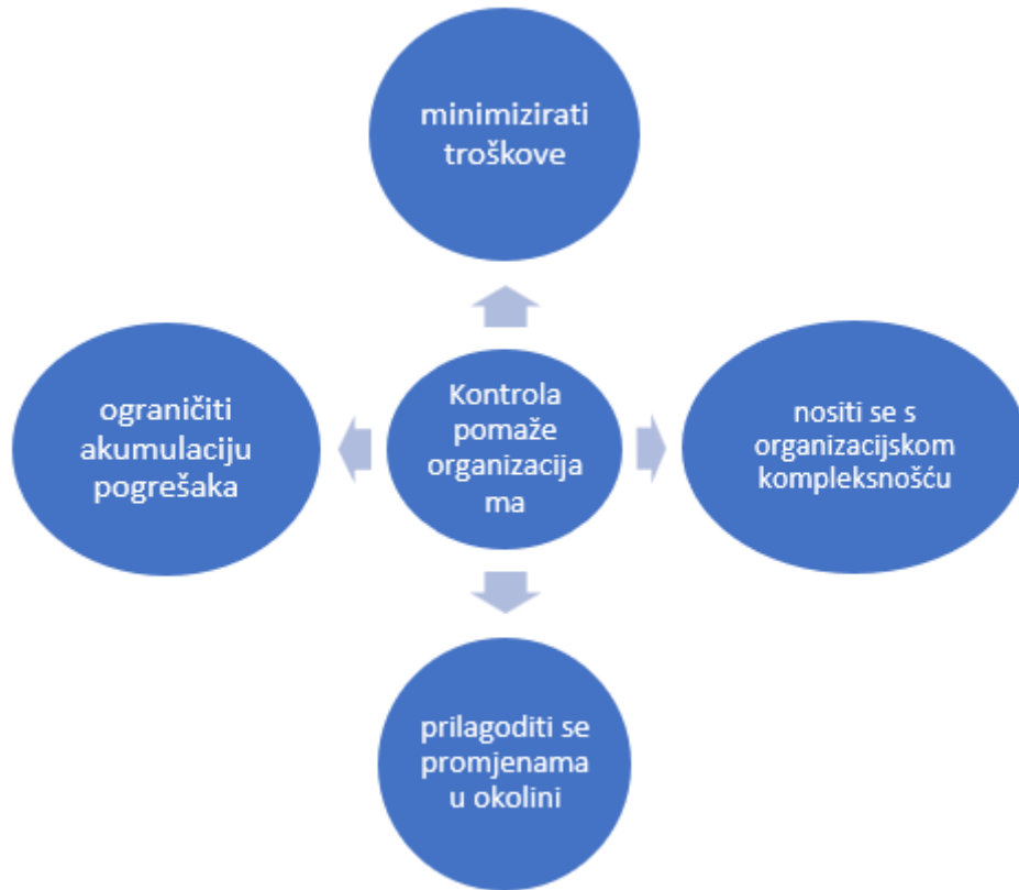
Slika 3. Svrha kontrole (izrada autora prema Sikavica i sur., 2008.)

Da bi se svrhe kontrole postizale kontrolu je potrebno provoditi sustavno kako bi se na vrijeme uočile nepravilnosti i problemi te kako bi se čim prije moglo krenuti s rješavanjem problema. Sustavno provođenje kontrole omogućava rješavanje manjih problema prije nego što oni izrastu u značajne probleme koje bi organizaciji bilo mnogo teže i zahtjevnije riješiti. Sustavna kontrola isto tako omogućava minimalizaciju troškova poslovanja tako što utvrđuje koji proizvod ili usluga najviše doprinose organizaciji, a koji proizvodi ili usluge nisu toliko isplativi.