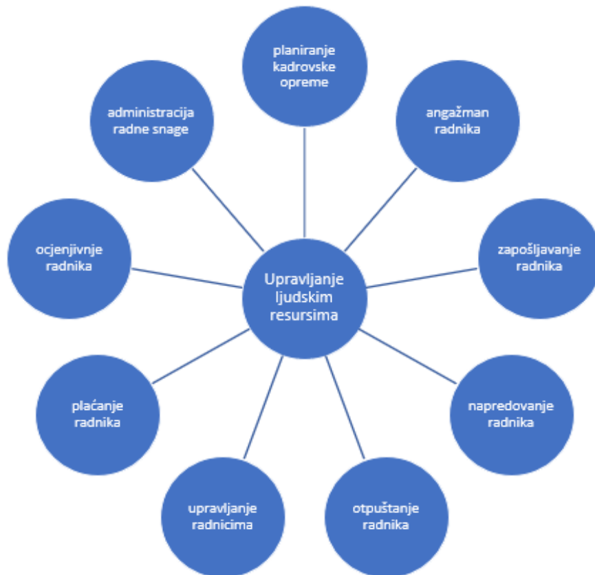
Slika 2. Prikaz zadataka funkcije upravljanja ljudskim resursima (izrada autora prema Kuka, 2011.)

Za kvalitetno obavljanje funkcije upravljanja ljudskim resursima potrebno je izvršavati sve zadatke na najbolji mogući način. Zaposlenici s velikim potencijalom i znanjem neće biti od velike pomoći ako se s njima ne upravlja kvalitetno te ako im se ne dodjele uloge i zadaci u kojima oni mogu pružiti najviše koristi. Od iznimne je važnosti prepoznati na kojem položaju će se zaposlenici najbolje snalaziti te im pružiti priliku za dodatno obrazovanje i napredovanje u organizaciji. Ova funkcija bavi se usmjeravanjem suradnika u organizaciji kako bi kvalitetno obavljali poslove u sadašnjosti, a isto tako i u budućnosti.