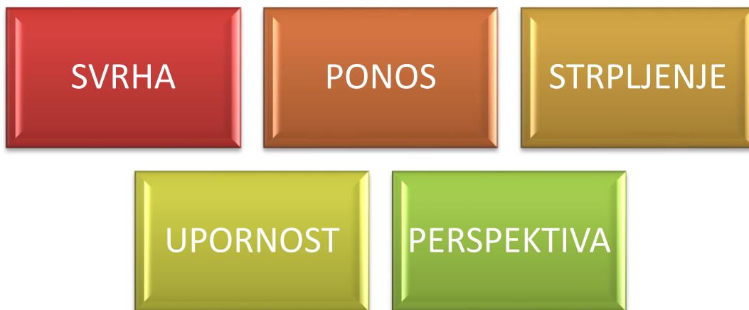
Slika 2. Pet moći etike za pojedinca (Izvor: obrada autora prema [5])

Etičko ponašanje počiva na tzv. „pet moći etike za pojedinca“ , a isto je prikazano Slikom 2.