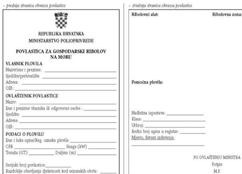
Slika 4. Povlastica – obrazac

Izdavanje povlastice zahtjeva podnošenje zahtjeva nadležnom ministarstvu ovisno o vrsti obrta, te se uz to prilažu podaci iz Obrtnog registra, a to su: djelatnost, ime i prezime, matični broj građana, adresa stanovanja, matični broj obrta, tvrtku i sjedište. Povlastica (slika 4) se izdaje u roku 15 dana. (Šoić, Cvitan, 2001, str. 26)