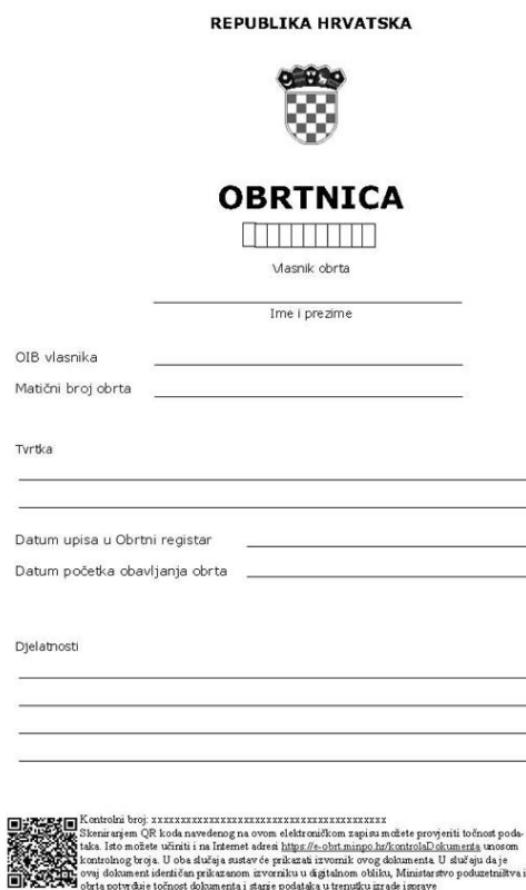
Slika 3. Obrtnica – obrazac

Ministarstvo gospodarstva i održivog razvoja (2021.) navodi da se danas obrt može jednostavno otvoriti putem servisa e-obrt. Usluga se nalazi na sustavu e-Građani. Usluga e-obrt omogućuje iniciranje postupka koji obuhvaća osnivanje novog obrta i upisa promjena u Obrtni registar koji je vezan za postojeće obrte, praćenje statusa iniciranog postupka. Elektronskim putem obrtnici mogu generirati i preuzimati obrtnice, rješenja i službeni izvadak iz Obrtnog registra i sve se to obavlja potpuno besplatno. Nakon što se podaci upišu, zahtjev se šalje nadležnom upravnom tijelu na daljnje postupanje.