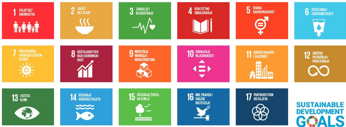
Slika 3. Ciljevi održivog razvoja

Prema Ujedinjenim narodima, izdvaja se ovih 17 ciljeva održivog razvoja: