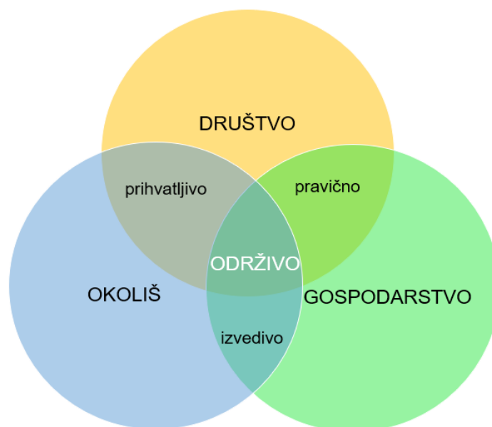
Slika 2. Tri sastavnice održivog razvoja (Samostalna izrada autorice prema Gudelju, 2019)

Gospodarska ili ekonomska održivost odnosi se na postizanje učinkovitog rasta i „pravedne“ podjele bogatstva, dok je društvena održivost usmjerena prema unaprjeđenju kohezije u zajednici, uspostave mobilnosti, stvaranju društvenog identiteta i dr. (Kordej De Villa i sur., 2009). Prema Kordej De Villa i sur. (2009) ekološka održivost uključuje zaštitu prirodnih izvora, njihovo optimalno korištenje i poštivanje svih drugih ekosustava. Sve tri sastavnice međusobno se nadovezuju te ostvarivanje jedne omogućuje ostvarivanje druge sastavnice. Zajedno stvaraju održivost.