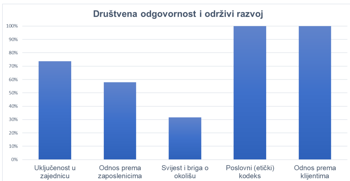
Slika 5. Društvena odgovornost i održivi razvoj poslovnih banaka na području Hrvatske