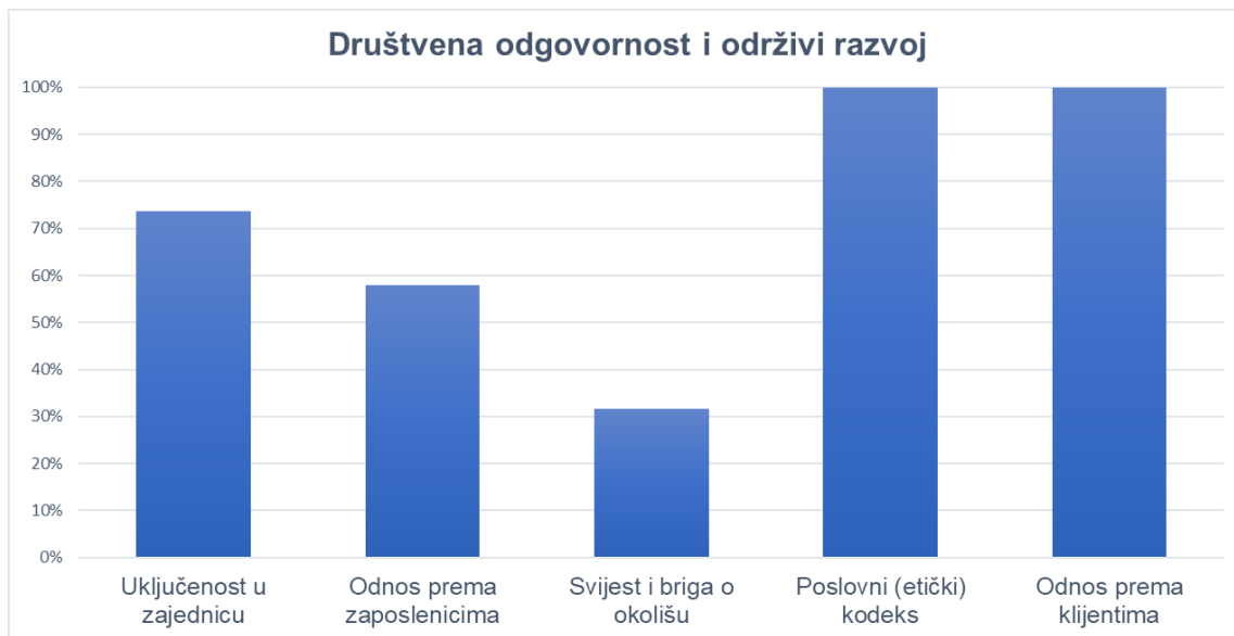
Slika 5. Društvena odgovornost i održivi razvoj poslovnih banaka na području Hrvatske