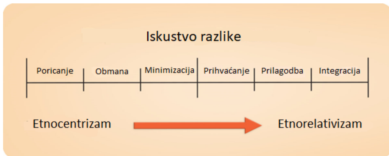
Slika 1: Razvoj model interkulturalne osjetljivosti Milтона Bennetta ili „Bennettova ljestvica“

Osnovni mehanizam za internaliziranje svjetonazora je percepcija. Djeca postaju prilagodljiva svojim posebnim okolnostima razrađujući perceptivne kategorije relevantnih stvari dok ostavljaju nebitne stvari ili samo nejasne kategorizirane. Na primjer, tjestenina je relevantna kategorija za talijansku djecu, a mnogi od njih već znaju oblike (npr. penne ili rigatoni ) koji idu uz različite umake. Tjestenina nije baš relevantna za američku djecu, a većina njih može se koristiti samo nediferenciranom kategorijom „makarona“. Kultura pruža skup ovakvih razlika između figura i temelja koje omogućuju da pojedinci sa svojim sunarodnjacima konstruiraju jednostavne adaptivne procese svoje skupine. Kao rezultat toga, različitost postoji u širokoj i nejasno definiranoj perceptivnoj kategoriji, poput makarona za tjesteninu. Takvo perceptivno stanje nije prikladno za učinkovitu komunikaciju s kulturnim autsajderima, jer neprikladno stavlja zajedno ljude različitih kultura i onemogućuje zauzimanje njihovih jedinstvenih perspektiva na bilo koji smislen način. (Bennett, 2004). Slika jedan opisuje standardne načine na koje ljudi doživljavaju, tumače i komuniciraju s kulturnim razlikama. Predstavlja kako razvojni kontinuum koji napreduje od etnocentričnog (poricanje, obrambeni stav i minimiziranje) do etnorelativnih svjetonazora (prihvatanje, prilagodba i interakcija). Model se koristi kao obrazovni alat koji pomaže ljudima da napreduju prema dubljem razumijevanju međukulturnim razlikama.