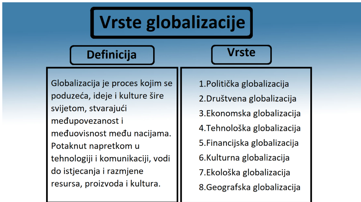
Slika 2: Vrste globalizacija

Slika dva definira globalizaciju te objašnjava i ispituje njezine vrste. Predstavlja osam vrsta globalizacije, a to su: politička, društvena, ekonomska, tehnološka, financijska, kulturna, ekološka i geografska. Kroz ovih osam aspekata vidjet ćemo kako naš svijet postaje integriraniji na mnogo različitih načina.