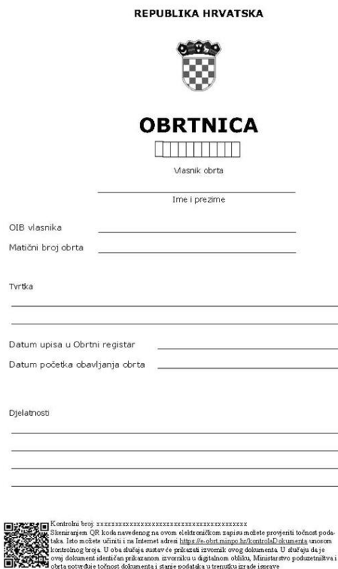
Slika 3. Obrtnica – obrazac (Izvor podataka: Narodne novine, bez dat.)

Ministarstvo gospodarstva i održivog razvoja (2021.) navodi da se danas obrt može jednostavno otvoriti putem servisa e-obrt. Usluga se nalazi na sustavu e-Građani. Usluga e-obrt omogućuje iniciranje postupka koji obuhvaća osnivanje novog obrta i upisa promjena u Obrtni registar koji je vezan za postojeće obrte, praćenje statusa iniciranog postupka. Elektronskim putem obrtnici mogu generirati i preuzimati obrtnice, rješenja i službeni izvadak iz Obrtnog registra i sve se to obavlja potpuno besplatno. Nakon što se podaci upišu, zahtjev se šalje nadležnom upravnom tijelu na daljnje postupanje.