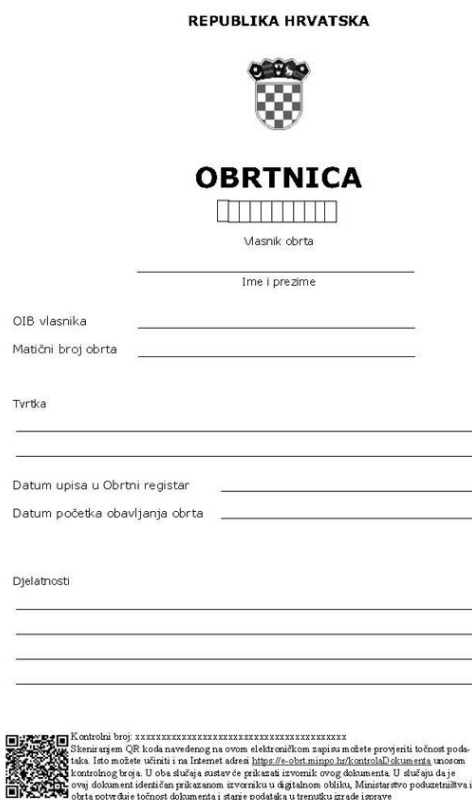
Slika 3. Obrtnica – obrazac

Ministarstvo gospodarstva i održivog razvoja (2021.) navodi da se danas obrt može jednostavno otvoriti putem servisa e-obrt. Usluga se nalazi na sustavu e-Građani. Usluga e-obrt omogućuje iniciranje postupka koji obuhvaća osnivanje novog obrta i upisa promjena u Obrtni registar koji je vezan za postojeće obrte, praćenje statusa iniciranog postupka. Elektronskim putem obrtnici mogu generirati i preuzimati obrtnice, rješenja i službeni izvadak iz Obrtnog registra i sve se to obavlja potpuno besplatno. Nakon što se podaci upišu, zahtjev se šalje nadležnom upravnom tijelu na daljnje postupanje.