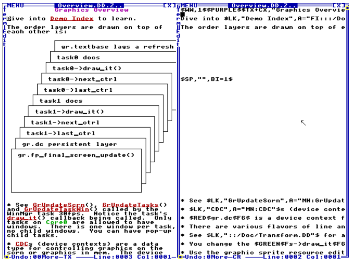
Slika 2. Primjer dokumenta DolDoc, na lijevoj slici je prikazan normalni prikaz, na desnoj slici je prikazan tekstualni prikaz

Naredaba ima previše, pa da se ne navode sve u radu, ako čitatelja zanima može ih pregledati u samom TempleOS-u pod /Doc/DolDocOverview.DD.Z (preporučljivo zbog organiziranosti), ili na referenciji [3].