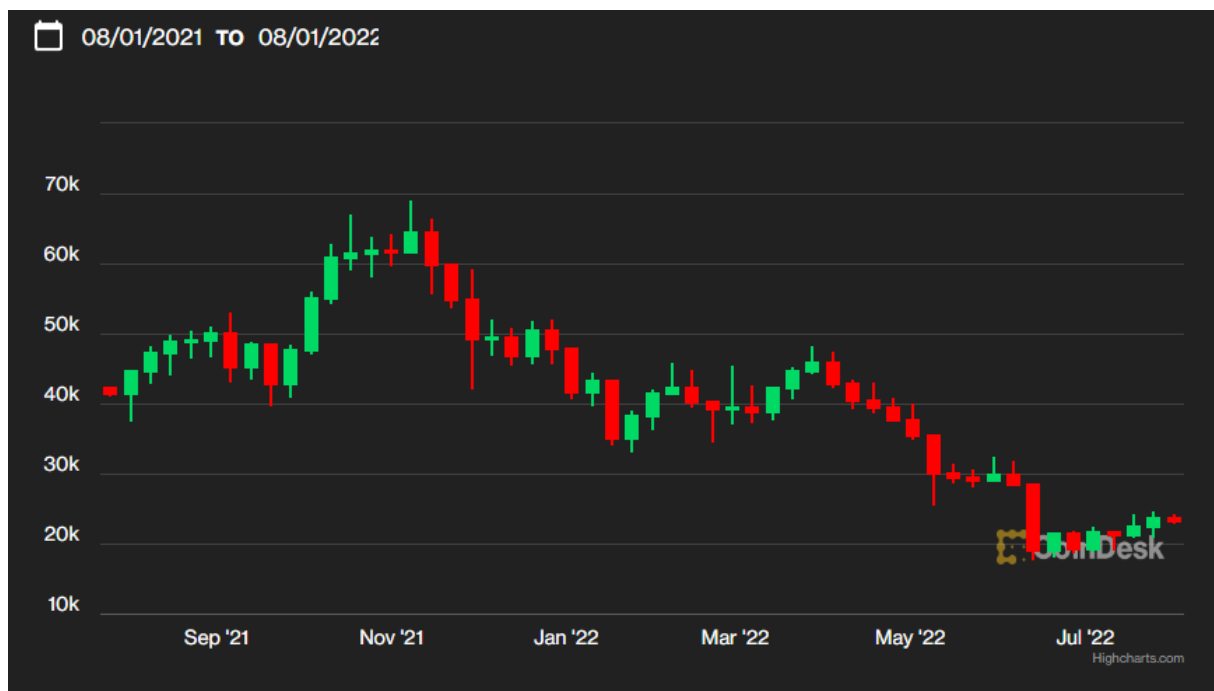
Grafikon 2: Kretanje cijene Bitcoina

Grafikon 2 prikazuje kretanje cijene Bitcoina u razdoblju od 1.kolovoza 2021. do 1.kolovoza 2022. godine.