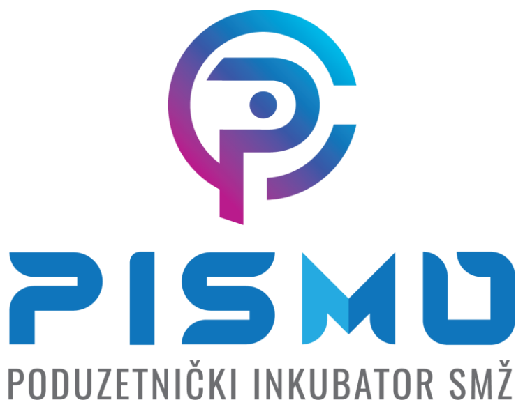
Slika 16. Logotip poduzetničkog inkubatora „PISMO“ [33]

Kao što je ranije rečeno, Novska se jako trudi kako bi unaprijedila razvoj i obrazovanje za industriju videoigara. Osim navedenog projekta, te smjera u srednjoj školi, u Novskoj postoji i poduzetnički inkubator „PISMO“ koji je specijaliziran i iznimno fokusiran na razvoj start-up poduzeća koja se žele baviti videoigrama, te i na edukaciju mladih ljudi vezanih uz ovu industriju. Početkom godine je u ovom inkubatoru bilo preko 67 tvrtki koje su specifično specijalizirane za razvoj i izradu videoigara. Osim toga, u inkubatoru se educiralo oko 300 mladih ljudi koje zanima ovo područje. U ovom inkubatoru je vrlo bitno umrežavanje ljudi i poduzeća koja su u inkubatoru, te se tako vrlo lako povezuju poduzetnici s osobama koje se educiraju u ovom inkubatoru, a to je način na koji nastaje jedna zajednica koja se međusobno nadopunjava. [32]