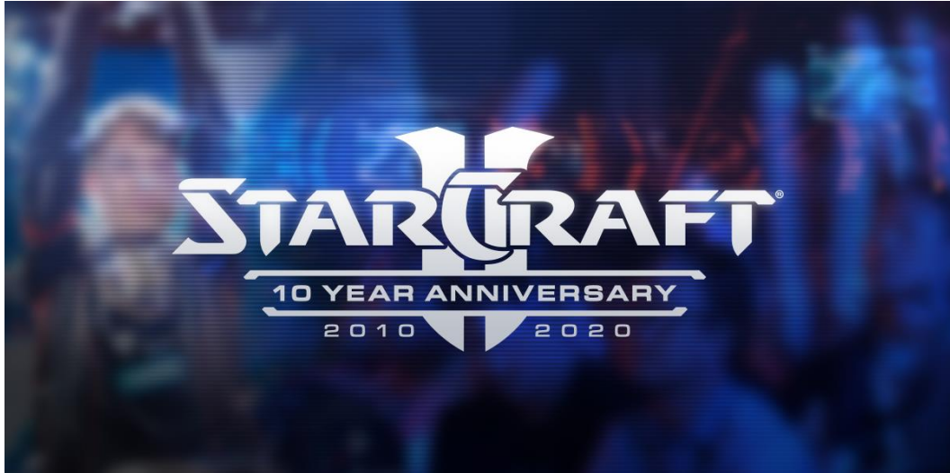
Slika 6. Objava za 10. godišnjicu videoigre StarCraft [15]

Strateške igre u stvarnom vremenu su videoigre za čije igranje je potrebna strategija, odnosno igrač tijekom njihova igranja treba upotrijebiti najbolju moguću strategiju kako bi pobijedio. Najpoznatija strateška videoigra je Civilization , no ona nije i esport igra. Esport strateške igre su StarCraft , Warcraft i Age of Empires . [13]