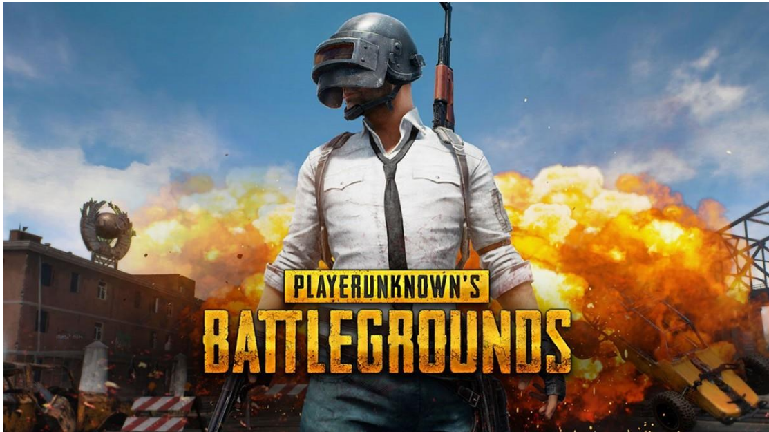
Slika 8. PubG najava [17]

Battle Royal je žanr videoigre koja je akcijska i koja se brzo se odvija, te se i ovdje igrači moraju boriti do smrti. Cilj ovih videoigara je da igrač ostane što dulje u igri i ubije što više drugih sudionika, odnosno ako želi pobijediti treba ostati jedini preživjeli. Ovakvu vrstu može igrati između jednog i najviše četiri natjecatelja u timu. Najpoznatije ovakve videoigre današnjice su Fortnite , PubG i Warzone . [13]