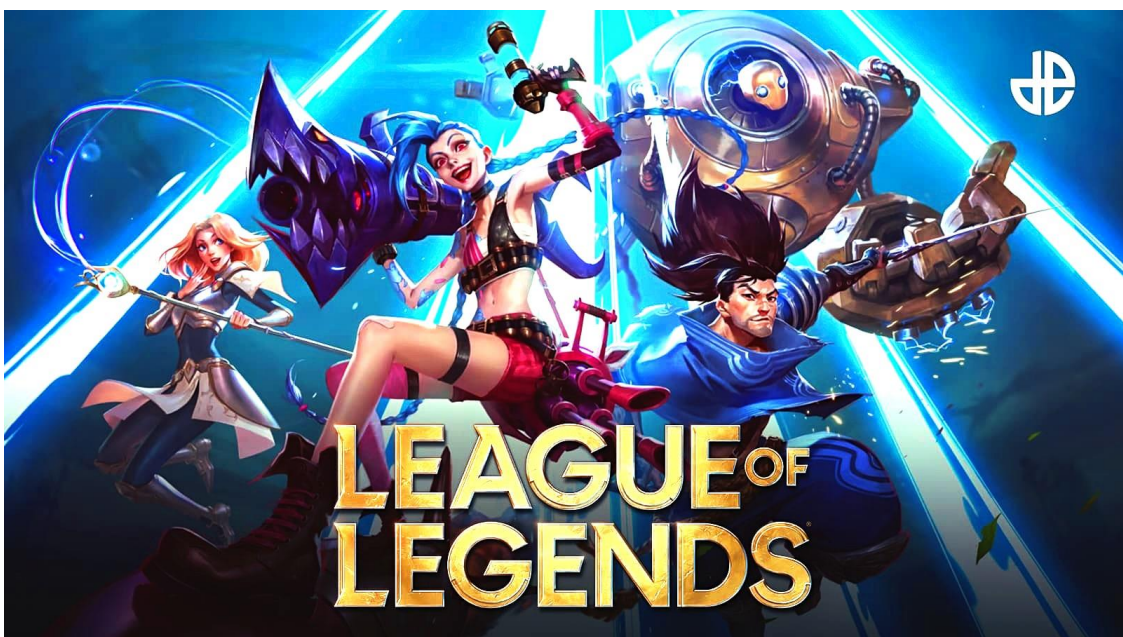
Slika 9. Najava za 12. sezonu videoigre League of Legends [18]

Online borbeno arena za više igrača ili engleski skraćeno MOBA , jest podvrsta strateške videoigre. Tijekom igranja ovakve videoigre, igrač preuzima ulogu jednog lika gdje sa svojim timom strateški pokušava pobijediti suprotni tim, odnosno svoje protivnike. Najpoznatije i najpopularnije igre ovog žanra su League of Legends i Dota 2 . [13]