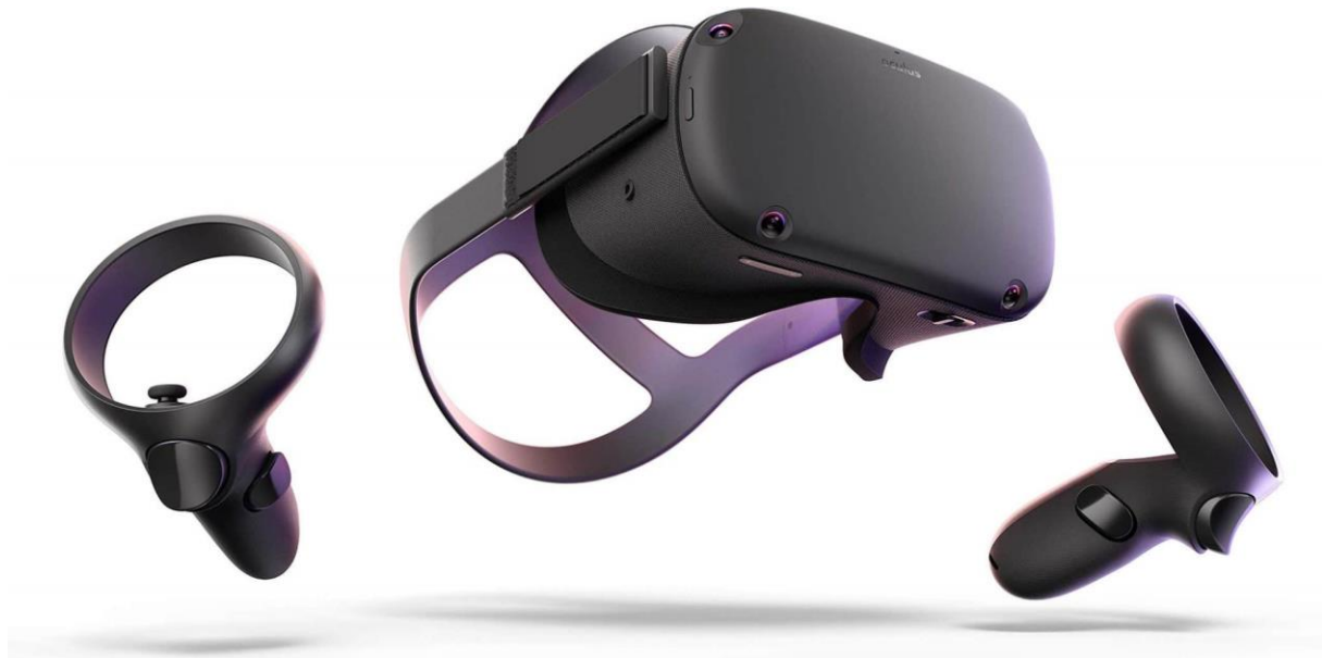
Slika 3. Set za virtualnu realnost [9]

još nije u potpunosti razvijen, nego je u fazi razvitka i istraživanja. Bit ovog oblika videoigri je da igrač ( engl. Gamer ) koristi set za virtualnu realnost koji se najčešće sastoji od posebnih naočala specijaliziranih za ovu vrstu igri, te rukavica ili različitih upravljača koji omogućuju kretnju kroz igru.