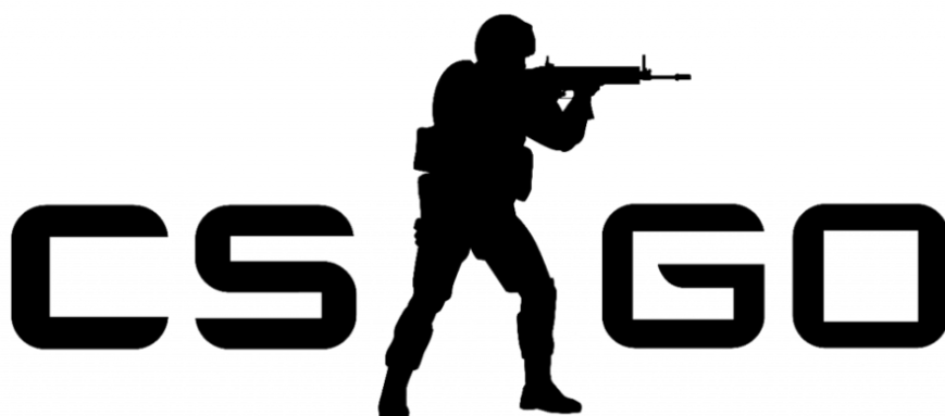
Slika 5. Logotip Counter-Strike: Global Offensive (CS:GO) [14]

FPS, to jest pucačina iz prvog lica, oblik je videoigre gdje igrač igra iz perspektive prvog lica, odnosno ono što vidi je oružje koje drži u rukama i sve ono što se nalazi oko samog lika. Najpoznatije videoigre ovog oblika su Counter-Strike: Global Offensive (CS:GO) , Call of Duty: Warzone , Valorant , Battlefield i druge. [13]