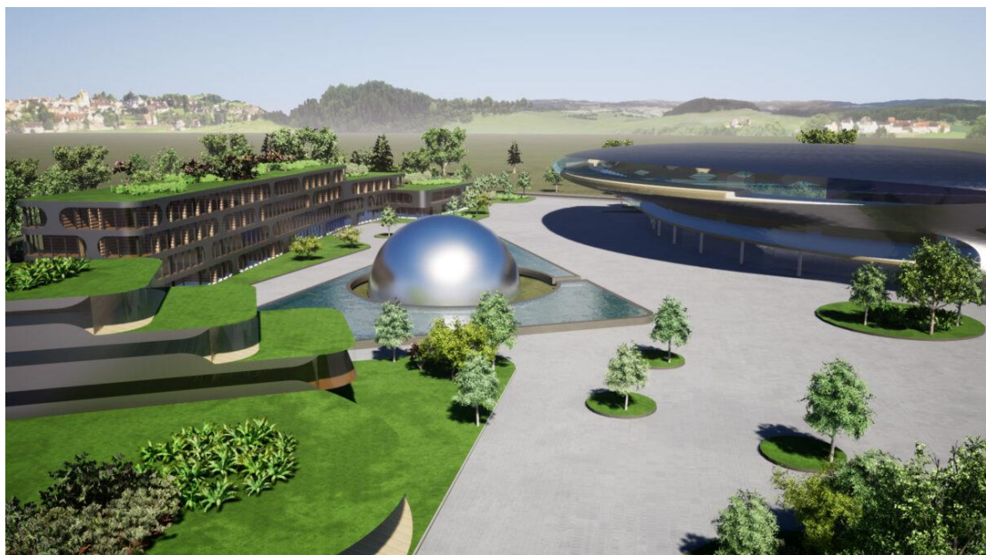
Slika 15. 3D model izgleda kampusa u Novskoj [31]