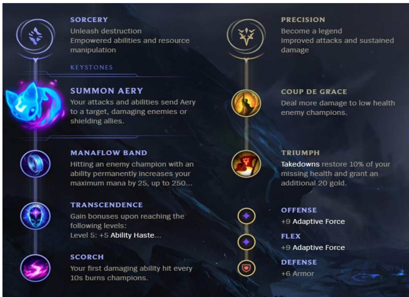
Slika 14: Rune/Pojačanja

Naposljetku, tu su i stvari (engl. items) koje su u modernom LoL-u prerasli u jednu od najvažnijih vještina u računalnoj igri. Slika ispod prikazuje stvari koje SIA kupuje te oni se dijele na komponente, kompleksnije komponente te kompletne stvari. Svaka kompletna stvar je sačinjena od komponenata koje imaju znatno manju cijenu od same stvari. Stvari koje sam odabrao za Seraphine su orijentirani na stvaranje štete protivniku te brzinu kretanja. Bot (inteligentni agent) će uvijek prvo kupiti komponente jer nema razloga čekati na novac za kompletne stvari. Ispod vidimo sliku.