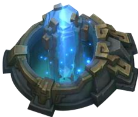
Slika 10: Inhibitor

Na ovoj slici se vidi turret (hrv. toranj) koji je obrambena struktura. Svaka traka ima 3 turreta, uključujući i 2 turreta ispred Nexusa (u samoj bazi oba tima). Uništenjem turreta protivnički tim dobija novac te može nastaviti napadati dublje u protivnički teritorij.