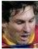
Slika 1: Lice nogometaša: Lionel Messi

Postoje različite metode traženja podudarnosti gdje svaka ima različitu matematičku formulu kojom se računa, ali na ovom primjeru pogledat ćemo metodu TM_CCOEFF .