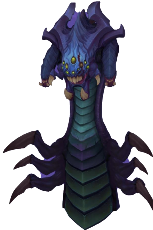
Slika 8: Baron

Na ovoj slici se vidi džungla te razna čudovišta koja u njoj mogu biti. Različita čudovišta daju različita poboljšanja (brže regeneriranje životnih bodova ili bodova koji su potrebni za korištenje čarolija, jači napadi i sl.). Sva čudovišta daju iskustvo i novac koji su potrebni za podizanje heroja na viši nivo koji mu omogućuje poboljšanja u napadu, obrani i čarolija.