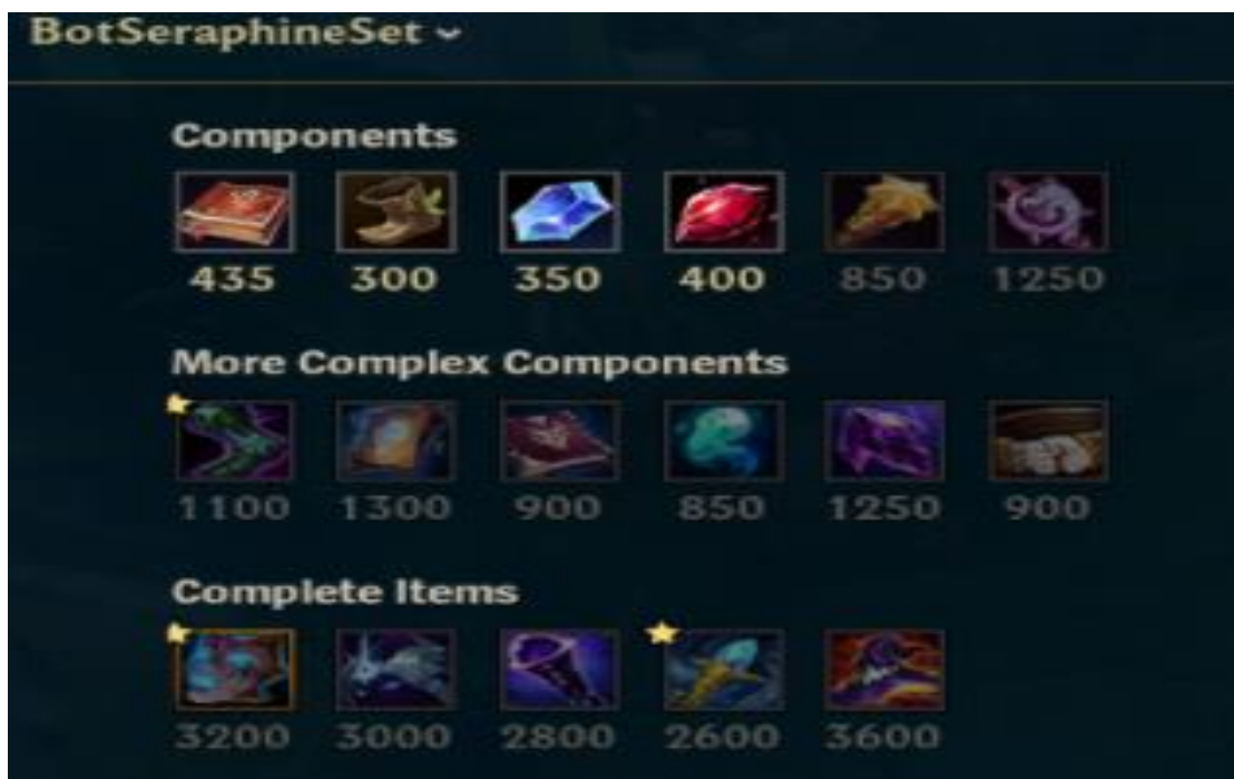
Slika 15: Itemi

Ideja na kojoj je napravljen S.I.A. je sljedeća: detekcija objekata u stvarnom vremenu te automatizacija akcija/stvari koje bi čovjek radio ako bi on igrao računalnu igru. Prije izrade samog agenta, potrebno je nabrojati listu stvari koje bi se trebale automatizirati: