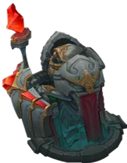
Slika 9: Turret

Na ovoj slici se vidi turret (hrv. toranj) koji je obrambena struktura. Svaka traka ima 3 turreta, uključujući i 2 turreta ispred Nexusa (u samoj bazi oba tima). Uništenjem turreta protivnički tim dobija novac te može nastaviti napadati dublje u protivnički teritorij.