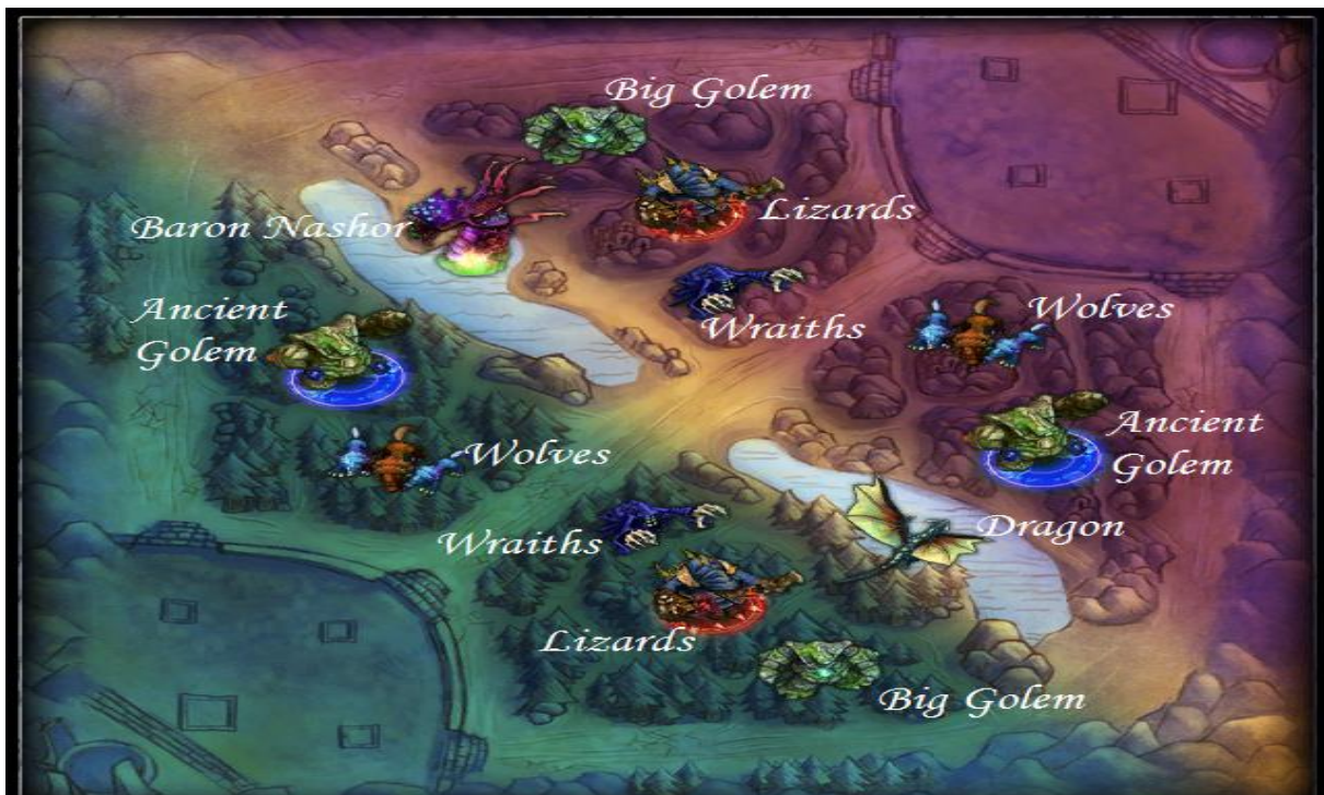
Slika 7: džungla i čudovišta u njoj

Na slici iznad su minioni, tj. podanici koje svaki tim ima. Postoje 3 vrste miniona: casteri (minioni koji napadaju sa distance, tj. imaju dug domet napada), melees (minioni sa sjekirama, bliska borba) te cannon (najjači minion, vidimo ga u sredini s dugim topom).