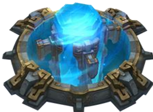
Slika 11: Nexus

Srce svakog tima je Nexus, struktura čijim uništenjem protivnici završavaju igru pobjedom. Nema osobni napad te iako uništenjem Nexusa igra odmah završava, heroj koji uništi Nexus dobije 50 gold-a (novac u zlatu). Cilj igre je doći do Nexusa i uništiti ga.