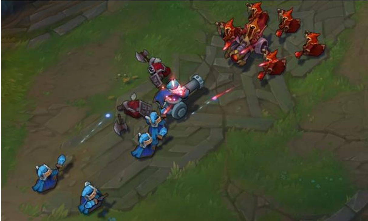
Slika 6: minioni

Na slici iznad su minioni, tj. podanici koje svaki tim ima. Postoje 3 vrste miniona: casteri (minioni koji napadaju sa distance, tj. imaju dug domet napada), melees (minioni sa sjekirama, bliska borba) te cannon (najjači minion, vidimo ga u sredini s dugim topom).