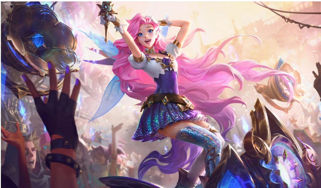
Slika 12: Seraphine

Dok će se kasnije u radu vidjeti kako točno SIA radi, prvo će biti objašnjen heroj koji je izabran za ulogu inteligentnog agenta. Seraphine je mage midlaner (čarobnjak namijenjen za srednju traku), što znači da ide u srednju traku mape te su njene glavne sposobnosti korištenje čarolija i pritom radeći dosta štete protivničkom timu te ona je pop pjevačica u samoj povijesti računalne igre. „Jednog dana, muzika će stati pa bolje pleši dok možeš!“ Ispod je slika kako Seraphine izgleda.