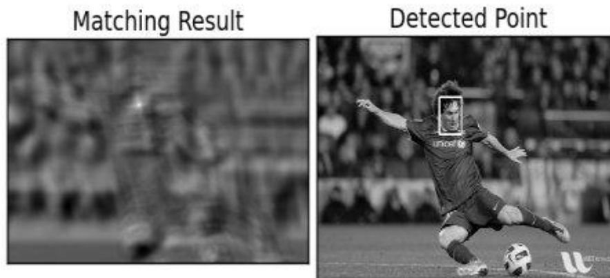
Slika 2: Rezultati pronalaska predložka u slici