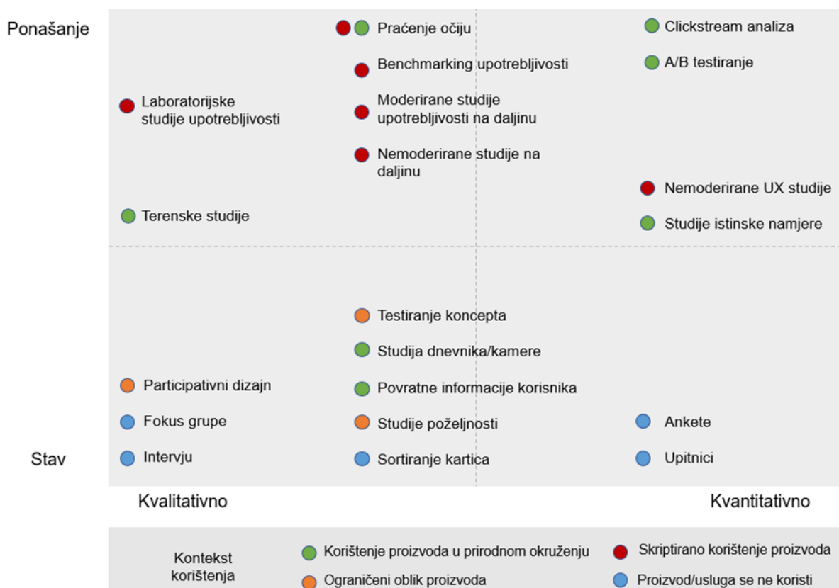
Dijagram 1 Metode istraživanja potreba korisnika