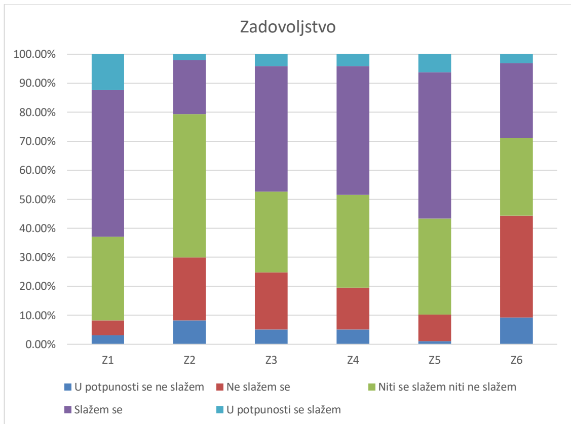
Slika 2. Grafikon rezultata odgovora za konstrukt zadovoljstva

zadovoljni s bodovima/rezultatima na kolegiju, dok Z2 i Z6 ukazuju kako nisu zadovoljni s količinom truda koji moraju uložiti za ovaj kolegij, a samim time i ne uživaju u radu.