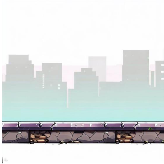
Slika 3. „Platforme za pod“ [9]

Bing Image creator prompt za platforme za pod (2 komada): „2D video game sidescroller platform sprite, concrete texture, city, urban, TMNT style, sidescroller game style, blank white background“