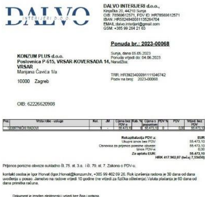
Slika 4. Ponuda