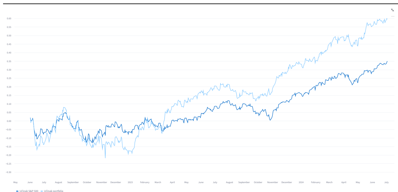
Slika 2: Graf prikazuje projekciju rasta investicije s obzirom na S&P 500

st.line_chart(data=pd.concat([odstupanje_referente, pf_kumulativni_povrati], ↪ axis=1))