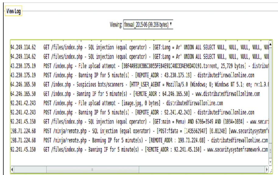
Slika 3: Primjer firewall logova[36]

Sigurnosni uređaji, kao što su firewalli, IDS/IPS sustavi i antivirusi, generiraju ove logove koji bilježe sve relevantne sigurnosne događaje. To uključuje pokušaje prijave, blokiran promet, zlonamjerne aktivnosti, detektirane viruse i druge potencijalne prijetnje. Analiza logova sigurnosnih uređaja pomaže u otkrivanju napada, prati trendove sigurnosti i poboljšava opću sigurnosnu pozu.