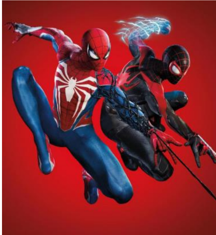
Slika 3:Dva superheroja