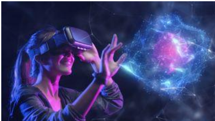
Slika 9: VR tehnologija

Podrška razvoju malih, ali inovativnih timova kroz inkubatore i start-up programe, kako bi se potaknula kreativnost i poduzetništvo unutar industrije. Stvaranje laboratorija i centara za istraživanje i razvoj u području novih tehnologija i umjetne inteligencije, s ciljem poticanja inovacija u razvoju videoigara.