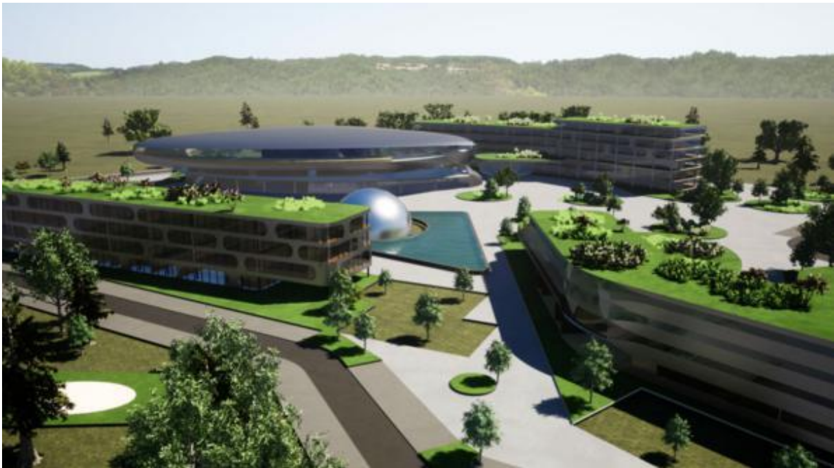
Slika 2:Gaming kampus u Novskoj

financiranje Hrvatskog zavoda za zapošljavanje nudi prostor za rade i poslovanje te provodi besplatne edukacije za izradu videoigara. Otvaranjem kampusa sve bi trebalo dobiti veći značaj jer u projektu je naznačeno da će se gaming kampus sastojati studentskog i učeničkog doma kao i objekata u kojima će se provoditi studiji, eSports arene s četiri tisuće mjesta kao i akceleratora za gaming industriju. U ideji je da se provodi petogodišnji visoko učilišni program sastavljen od pedeset studenata godišnje i srednjoškolski s dvadeset četiri učenika, te bi svi imali osigurani smještaj kao i menzu, konferencijsku dvoranu i sportsku dvoranu (Ban, 2024).