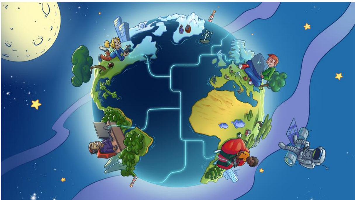
Slika 4: Svijet videoigara

Hrvatska industrija videoigara je u fazi rasta i razvoja, no još uvijek se suočava s izazovima u usporedbi s većim tržištima poput SAD-a, Dalekog istoka i Europe. Dok SAD i Daleki istok, posebno zemlje poput Japana i Južne Koreje s Kinom i Singapurom za petama, prednjače u tehnološkoj inovaciji, opsegu tržišta i broju velikih studija, Europa nudi snažnu podršku kroz regulative i financijske potpore za razvojne projekte. Hrvatska, s druge strane, ima manji, ali agilniji ekosustav, gdje se kreativnost i inovativnost potiču kroz specijalizirane tečajeve i male, ali talentirane timove. Međutim, nedostatak kvalificirane radne snage i manjak ulaganja su i dalje značajni izazovi u odnosu na globalnu konkurenciju (CGDA, 2022).