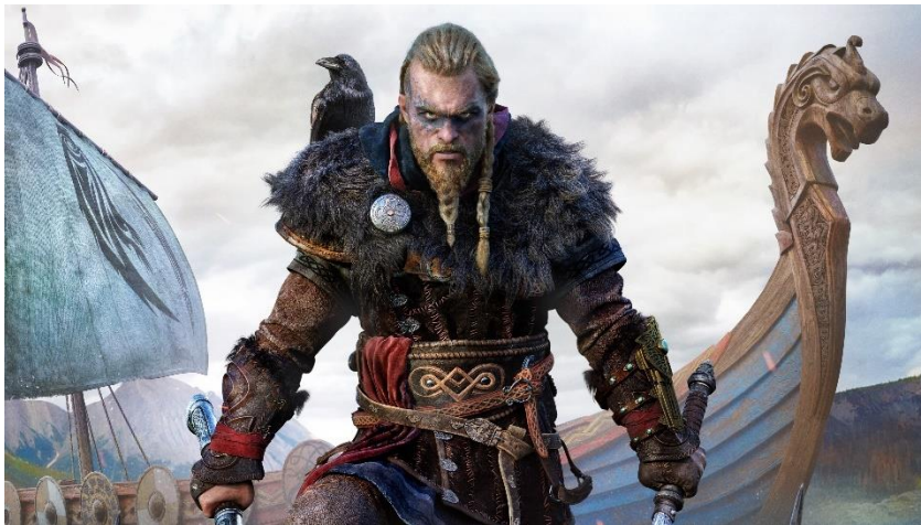
Slika 7: Assassin's Creed Valhalla

Singapur se posljednjih godina istaknuo kao globalno središte za tehnološke inovacije i kreativni talent u industriji videoigara. S jakim obrazovnim programima i podrškom vlade, Singapur privlači globalne studije kao što su Ubisoft, Riot Games i Bandai Namco, dok istovremeno njeguje domaće talente. Singapurska vlada aktivno podržava razvoj industrije videoigara putem inicijativa i finansijskih programa. Na primjer, Ubisoft Singapore, osnovan 2008. godine u partnerstvu s vladom, postao je ključan studio za razvoj velikih igara poput "Assassin's Creed Valhalla" prikazan na slici 7. Vlada također prepoznaje važnost obrazovanja, identificirajući ključne uloge u industriji poput dizajnera igara, programera i producenata kao prioritetne u razvoju radne snage. (Sharma n.d.).