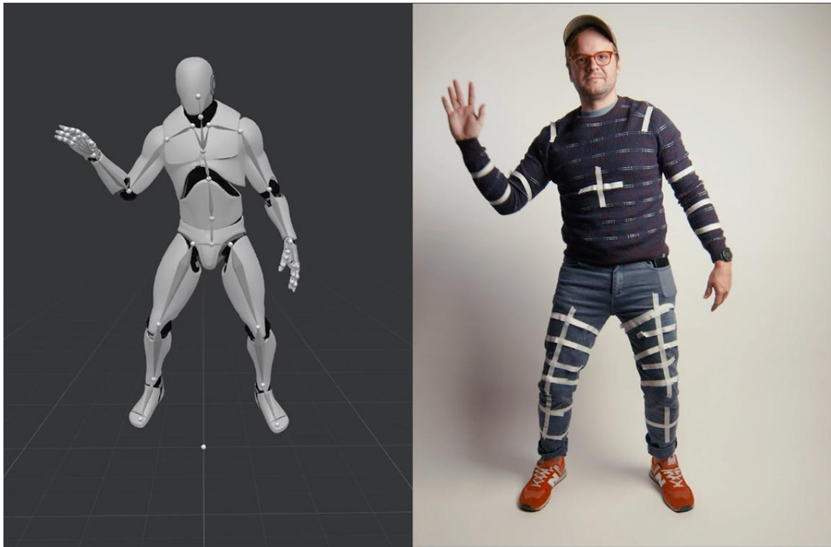
Slika 6: Motion capture

Kinesko obrazovanje za dizajnere videoigara nudi širok spektar programa koji obuhvaćaju sve ključne aspekte industrije igara. Studenti mogu steći znanja i vještine u područjima kao što su dizajn igara, programiranje, umjetnost i animacija, osiguranje kvalitete, e-sport te poslovni menadžment u industriji igara. Prioritet se stavlja na praktične projekte i suradnju s industrijom, omogućavajući studentima stjecanje stvarnog iskustva kroz rad na komercijalnim igrama i sudjelovanje na domaćim i međunarodnim sajmovima igara. Ovi programi omogućavaju studentima da razviju konkurentne portfelje i pripreme se za karijere u brzo rastućoj industriji. Ovaj tečaj ima za cilj pružiti temeljna znanja o interakciji između čovjeka i računala, softverskom inženjeringu i programiranju (CUHK. n.d.).