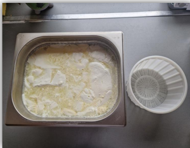
Slika 3 Prikaz gruša, sirutke i kalupa za odvajanje istih

Svoje proizvode prodaju lokalnome stanovništu na OPG-u. Njihov je cilj pružiti zdravi i kvalitetni sir koji je proizvod ljubavi i truda.