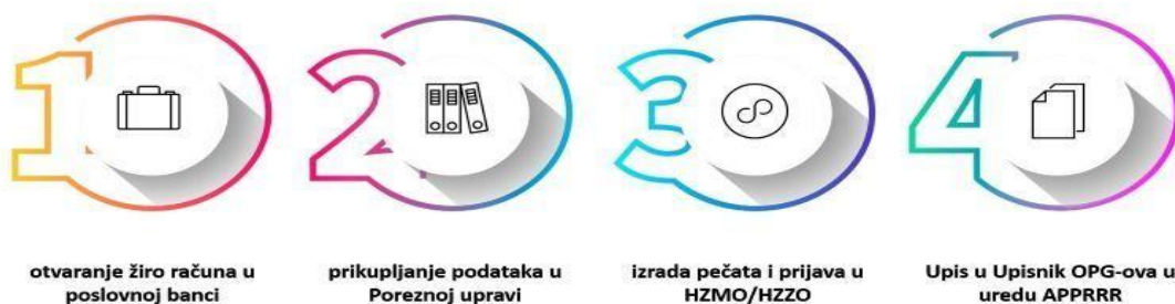
Slika 1 Koraci za pokretanje OPG-a