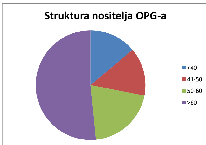
Grafikon 1 Struktura nositelja OPG-a

Na grafikonu niže možemo vidjeti kako dob veća od 60 godina prevladava kod nositelja OPG-a u Hrvatskoj u 2023.godini. Najmanje je nositelja OPG-a onih u dobi manjoj od 40 godina, točnije ukupno ih je svega 17.050. Zatim ih slijedi dob od 41.-50. Godina, ukupno ih je 17.438. U dobi od 50-60 ukupno je 25.091, a u dobi većoj od 60 ukupno ih je 63.301