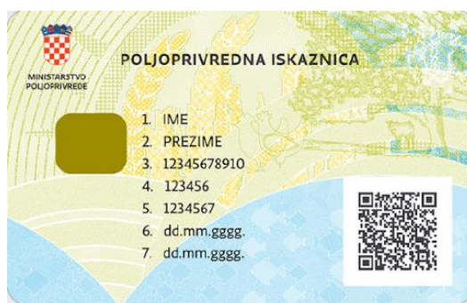
Slika 2 Poljoprivredna iskaznica

Nakon provedenog upisa i predane potpune dokumentacije, dobiva se iskaznica OPG-a koje je prikazana u nastavku. (Ministarstvo poljoprivrede, šumarstva i ribarstva, bez dat.)