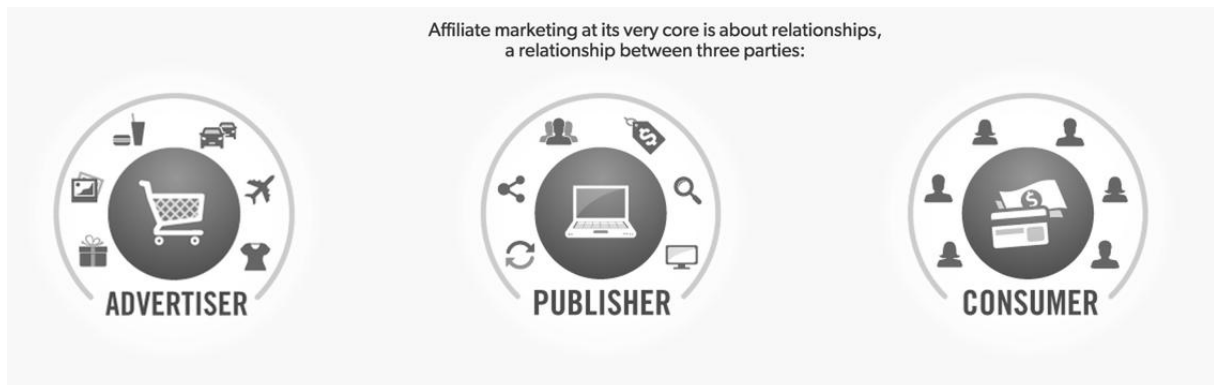
Slika 1. Uloge affiliate marketinga

affiliate program nema nikakav utjecaj na potrošača. Što se tiče mreže, ona predstavlja posrednika između trgovca i affiliatea. Njena uloga je obavljanje plaćanja i dostava proizvoda, a u nekim slučajevima je affiliatei koriste kako bi uopće bili u mogućnosti promovirati proizvod. (Oxidian, 2017., dostupno 17.3.2018. na https://oxidian.hr/affiliate-marketing-sto-poceti/ ).