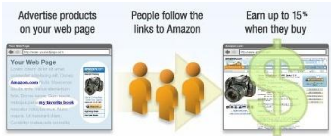
Slika 2. Affiliate program Amazona

Jedan od najuspješnijih, a vjerojatno i najpoznatijih primjera ovakvog programa je Amazon associates affiliate program koji omogućava vlasnicima web stranice i blogova oglašavanje Amazon proizvoda putem vlastite web stranice. Nakon što kupci obave kupnju putem linka na njihovim web stranicama odnosno blogovima, isplaćuje im se provizija u određenom postotku. Sam proces vidljiv je na slici 2. (Amazon.com, nema dat., dostupno 07.04.2018. na https://affiliate-program.amazon.com/welcome/getstarted )