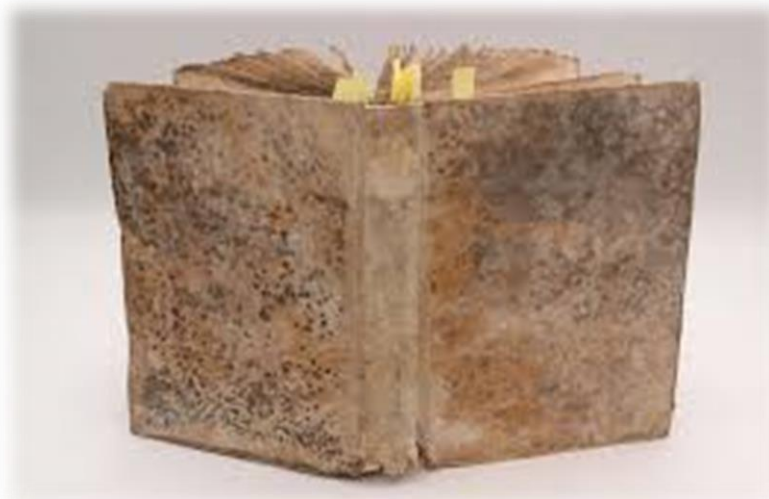
Slika 2: Oštećenja uzrokovano bakterijama

Preuzeto: 3.7.18.