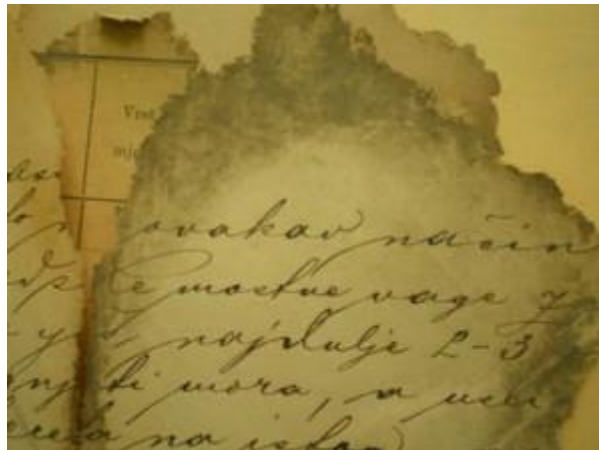
Slika 1: Uzroci oštećenja vlagom

Pod fizikalno-kemijskim uzrocima oštećenja smatraju se štetni utjecaji vlage, topline, svjetlosti i onečišćeni zrak. Vлага ima značajan utjecaj na većinu materijala na kojima je napisano arhivsko i registraturnog gradiva. Pod utjecajem vlage na materijalu dolazi do različitih promjena: promjena veličine i oblika, bio razgradnja i kemijske reakcije. Papir djelovanjem vlage bubri, povećava svoje dimenzije, što rezultira deformacijom listova. Kod knjiga više stradaju uvezi zato što korice (kožne ili kartonske) jače upijaju vlagu.