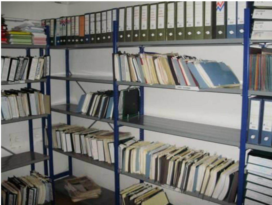
Slika 6: Primjer uredne prostorije pismohrane

Gradivo u elektroničkom obliku pohranjuje se tako da se podaci izdvoje iz izvornog sustava,odnosno sustava koji omogućuje brisanje, mijenjanje i dodavanje podataka, i pohrane u sustavu koji to onemogućuje. Elektronički podaci pohranjuju se u najmanje dvije kopije, od kojih jedna treba biti u sustavu koji omogućuje pristup, pretraživanje i prikazivanje podataka, a jedna izvan tog sustava. Prije pohrane elektroničkog gradiva, u pisanom se obliku opisuje format i struktura zapisa, način čuvanja i zaštita od neovlaštenog pristupa, način na koji će se voditi izlučivanje te oblik i način predaje nadležnom arhivu. Prije pohrane obvezno se provjerava čitljivost i cjelovitost svih kopija elektroničkih zapisa.