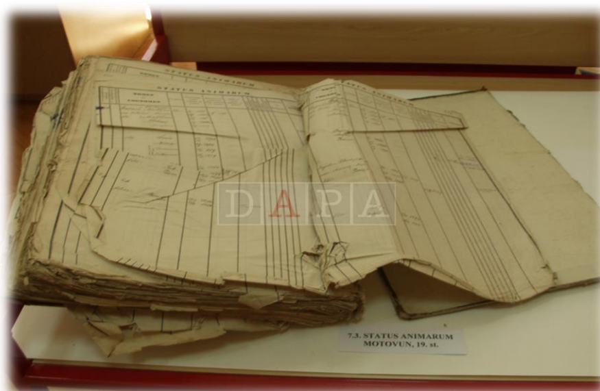
Slika 3: Mehanička oštećenja

Mehanička oštećenja najčešće nastaju zbog nestručnog i nepažljivog rukovanja gradivom (pad s visine, udarci, gužvanje, kidanje). Mehanička oštećenja nastaju i ako gradivo pohranjujemo u kutije neodgovarajuće veličine (u premalenima se gradivo gužva, a prevelikima iskrivljuje). Dakle mehaničkim je oštećenjima uzrok čovjek. (M.Marolja i V.Ramljak,2015, str.92).