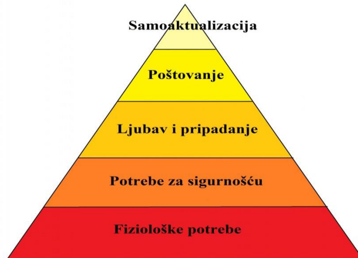
Slika 1: Maslowljeva hijerarhija potreba

„Maslowljeva teorija hijerarhije motiva (koja redom uključuje fiziološke motive sigurnosti, ljubavi, poštovanja te samoostvarenja) jedna je od najpopularnijih teorija motivacije.“ (Mihić, 2006, str.145) Maslow govori o potrebama svakog čovjeka koje je prikazao hijerarhijski, pomoću piramide gdje se od motiva najmanje važnosti kreće prema motivima najveće važnosti. (Mihić, 2006)