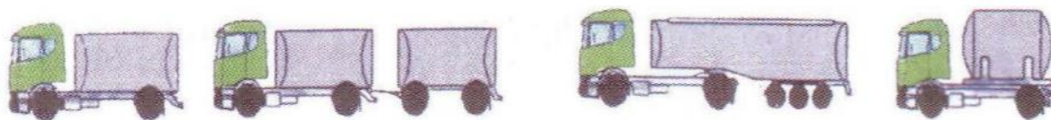
Slika 4. "FL" vozila

„FL“ – vozila namijenjena prijevozu tekućina čije plamište ne prelazi 61°C s izuzećem diesel goriva, lakog loživog ulja i zapaljivih plinova (Prijevoz opasnih tvari u cestovnom prometu (ADR), 2015)