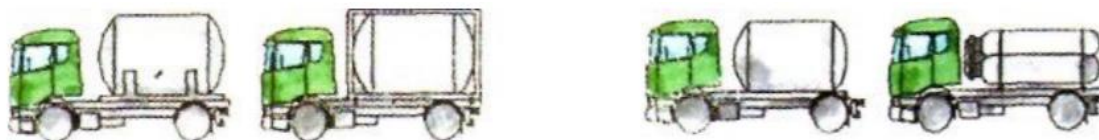
Slika 6. "AT" vozila

„AT“ – vozila koja nisu „FL“ i „OX“, a koja su namijenjena prijevozu opasnih tvari u kontejnerskim i prenosivim spremnicima ili MEGC-ijima zapremnine preko 3m 3 , u fiksnim ili izgradnim spremnicima zapremnine preko 1m 3 ili baterijskim vozilima zapremnine preko 1m 3 (Prijevoz opasnih tvari u cestovnom prometu (ADR), 2015)