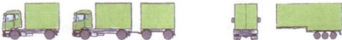
Slika 3. "EX/IM" vozila

„EX/IM“ – vozila namijenjena prijevozu klase 1 (eksplozivne tvari i predmeti), a na koja se postavljaju stroži zahtjevi u odnosu na „EX-II“ vozila (Prijevoz opasnih tvari u cestovnom prometu (ADR), 2015)