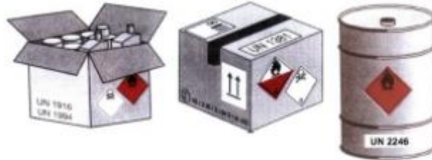
Slika 1. Označavanje pakiranja

ostane jasno vidljiva. Listica opasnosti lijepi se na vanjsku stranu pakiranja tako da ne pokriva ili remeti bilo koji dio dodatnih oznaka na pakiranju. (Prijevoz opasnih tvari u cestovnom prometu (ADR), 2015)