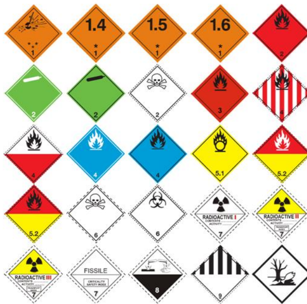
Slika 9. Listice opasnosti (Izvor: Centar za sigurnost (bez dat.), preuzeto 20.02.2019. od http://www.czs.hr/hr/listice-opasnosti-100x100 )