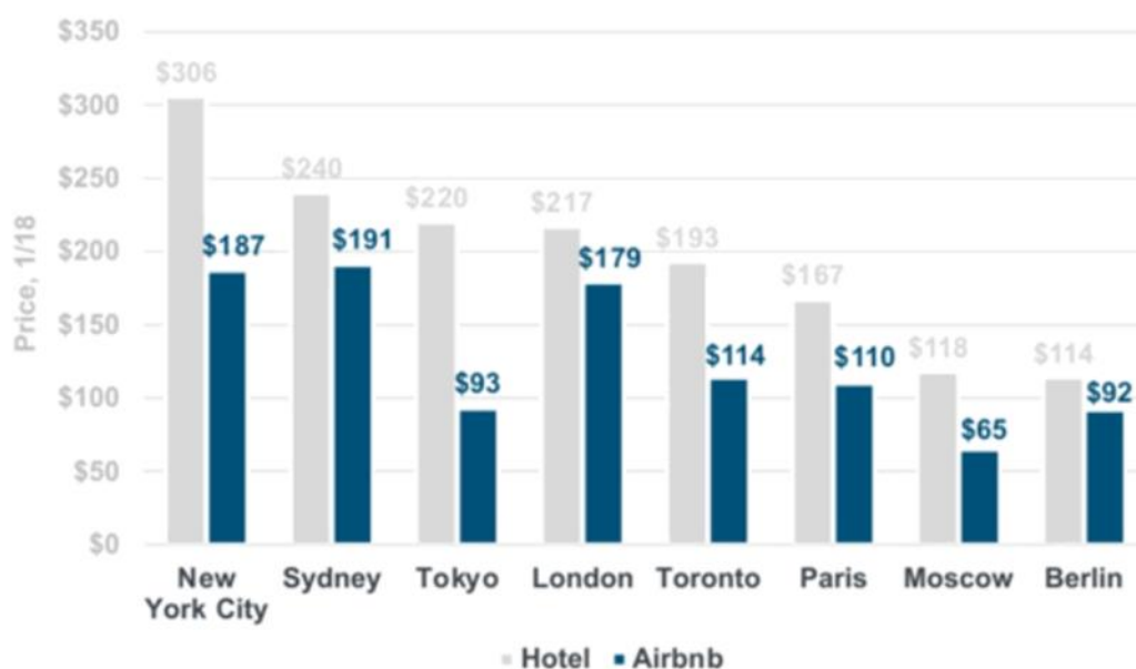
Slika 2. Airbnb vs. hoteli - usporedba cijena (Ping, 2018)

Prema ovom prikazu možemo procijeniti kako su zapravo noćenja u AirBnB-u jeftinija od prosječnih noćenja u hotelu. Naravno, ove brojke nisu uvijek ovakve. Kada se nudi neki luksuzan smještaj logično je i da će cijena noćenja biti puno viša od prosjeka. Cijene se određuju prema karakteristikama smještaja, broju noćenja i slično.