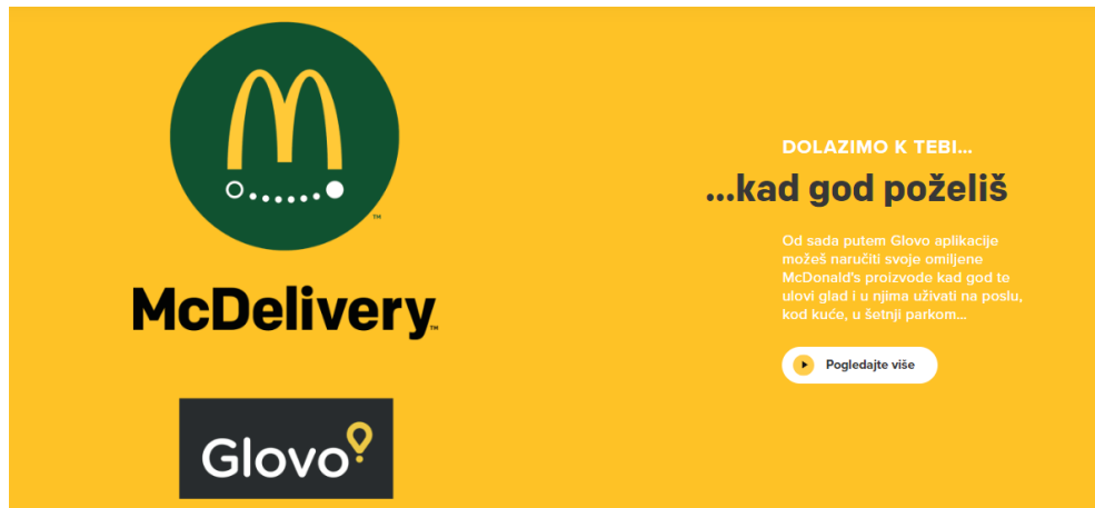
Slika 4: Dostava