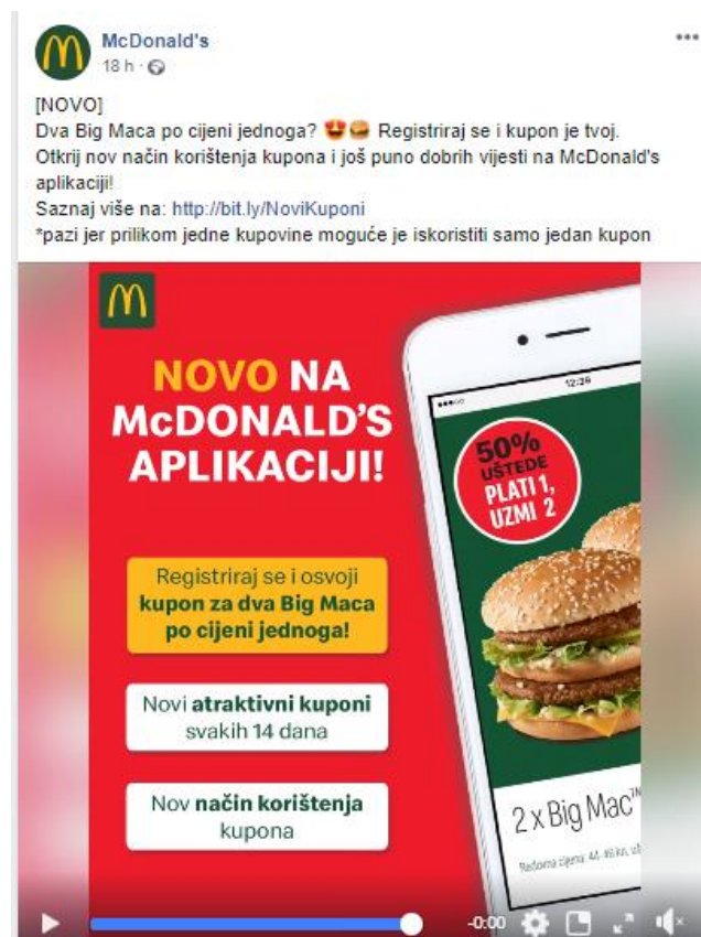
Slika 9: Novosti

Putem Facebooka McDonald's također svakodnevno objavljuje sve novosti vezane uz proizvode ili usluge restorana, također redovno objavljuje i primamljive fotografije hrane kako bi se korisnicima otvorio apetit te ih potakle na dolazak u najbliži McDonald's restoran.