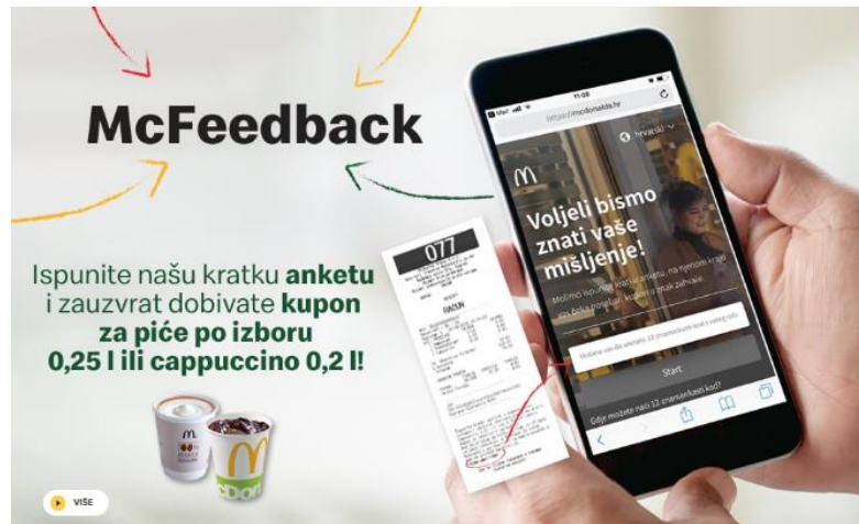
Slika 6: McFeedback

Na web stranici također se može pronaći mogućnost McFeedback-a. Posjetitelj restorana na dnu računa dobije 12-znamenkasti kod. Nakon utipkavanja tog koda, kupcu se otvara anketa s nekoliko pitanja o zadovoljstvu cjelokupnog asortimana, od čistoće ambijenta, ljubaznosti zaposlenika, zadovoljstvo hranom, vremenom čekanja itd.