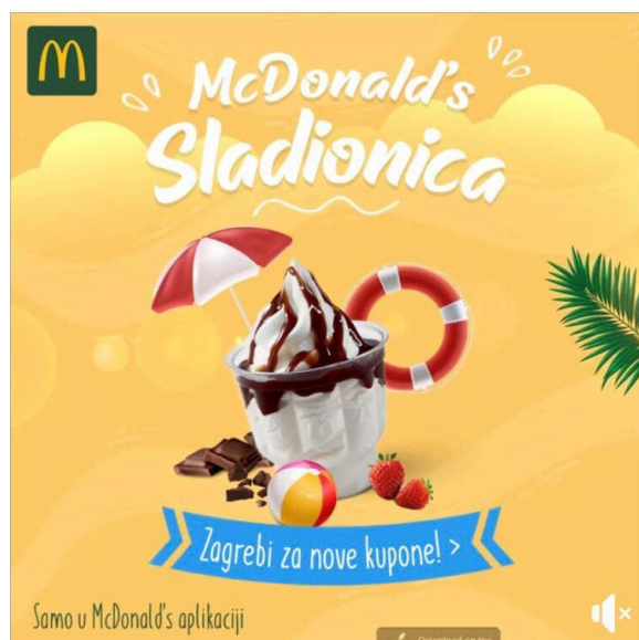
Slika 20: Igre