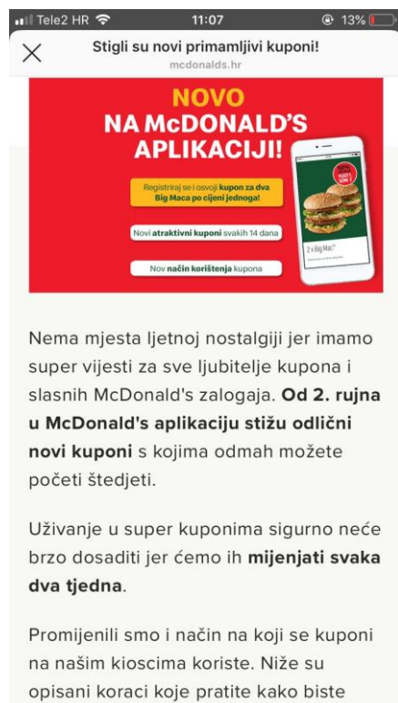
Slika 14: Novosti o kuponima