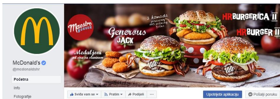
Slika 8: Upotrijebi aplikaciju

Njihova facebook stranica omogućuje potrošačima trenutno prebacivanje u McDonald's aplikaciju pomoću jednog klika na „ upotrijebi aplikaciju “. Prebacivanjem u aplikaciju korisnik je u mogućnosti iskoristiti kupone i razne druge mogućnosti koje sama aplikacija nudi.