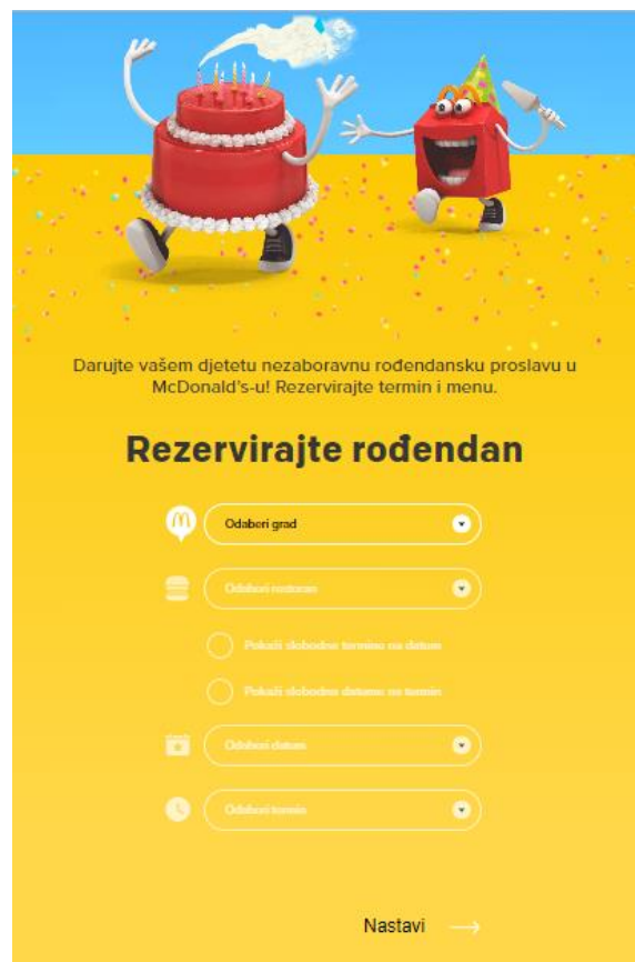
Slika 5: Rođendani

Putem web stranice McDonald's omogućuje roditeljima online rezerviranje rođendana, kako bi cijelu proceduru pojednostavili i privukli djecu i roditelje da baš u njihovim restoranima proslave rođendan.