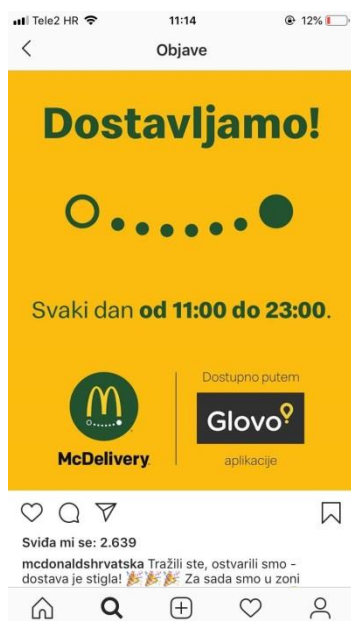
Slika 15: Novosti o dostavi

I kroz postavljanje slika na svoj profil McDonald's objavljuje novosti potrošačima. Sa sljedeće fotografije može se doznati kako je McDonald's uveo mogućnost dostave hrane na području Zagreba.