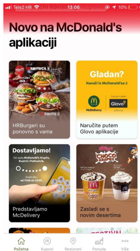
Slika 18: Novosti na aplikaciji

Mobilna aplikacija također obavještava korisnike o novostima, tj. o novim proizvodima, o novim lokacijama restorana, također nudi i mogućnost prijave za slobodno radno mjesto (Opažanje autorice na temelju McDonald's aplikacije).