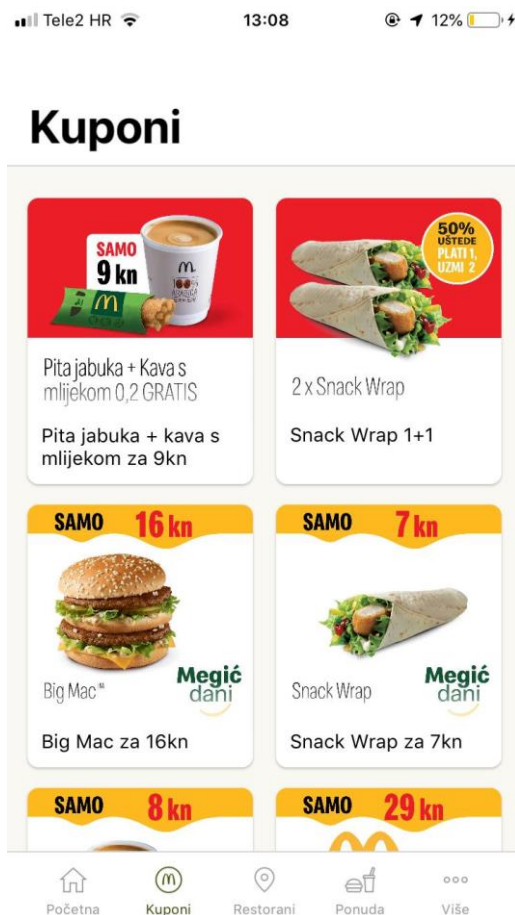
Slika 19: Kuponi

Umjesto papirnatih kupona, sada su dostupni kuponi samo preko aplikacije gdje se korisnik treba ulogirati da bi određeni kupon iskoristio. Pregled kupona je lakši preko aplikacije jer su korisniku uvijek dostupni samo oni aktivni (Opažanje autorice na temelju McDonald's aplikacije).