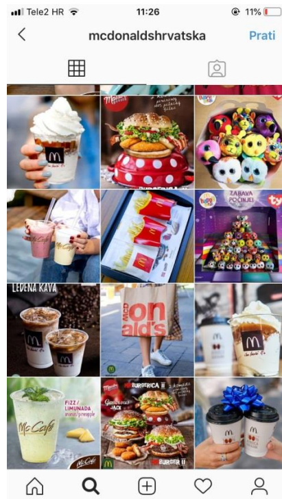
Slika 16: Slike proizvoda

U nastavku profila McDonald'sa mogu se pronaći razne fotografije hrane, od burgera, priloga, deserata do raznih kava koje imaju u ponudi.