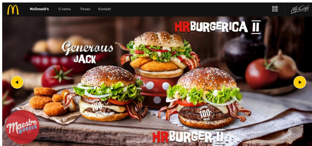
Slika 1: Noviteti restorana

McDonald's web stranica kvalitetno je napravljena, pruža potrošaču sve korisne informacije. Samim otvaranjem službene web stranice rotiraju se novosti vezane uz McDonald's restorane i proizvode.