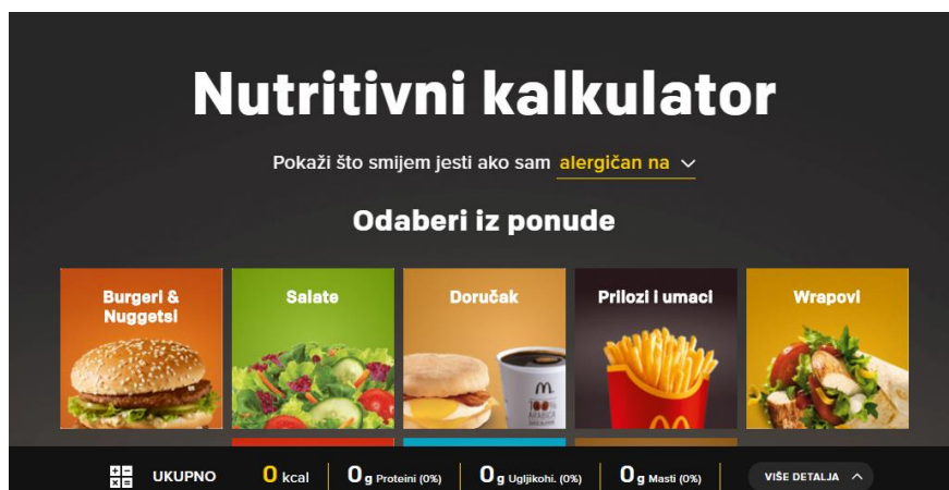
Slika 2: Nutritivni kalkulator

Može se pronaći popis svih proizvoda dostupnih u restoranima te je uz svaki proizvod navedena nutritivna vrijednost te alergeni kako bi korisnici znali u detalje što su naručili.