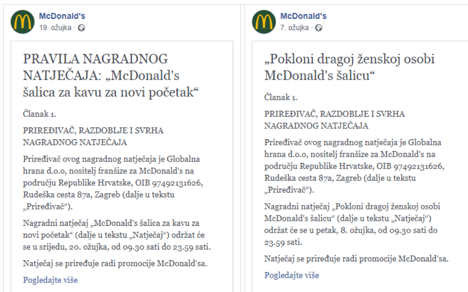
Slika 12: Bilješke

McDonald's često priređuje razne nagradne natječaje kako bi svoje korisnike ponekad i nagradio. Pod „Bilješke“ na Facebook stranici mogu se pronaći pravila za sudjelovanje na raznim nagradnim natjecajima. Najčešće je zadatak korisnika odgovoriti sto zanimljivije na određeno pitanje, a po isteku roka za postavljanje komentara ispod objave određuje se pobjednik i dobitnik nagrade.