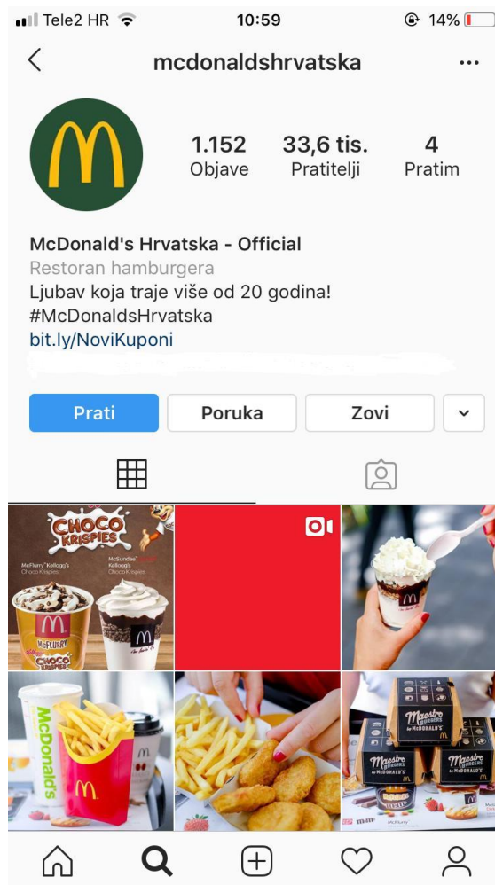
Slika 13: Instagram profil

McDonald's je prepoznao rast Instagrama kao društvene mreže. Sve veći broj korisnika društvenih mreža okrenuo se Instagramu te je, time vođen, otvorio profil i na toj društvenoj mreži. Na samom početku profila nalazi se link koji vodi korisnika do web stranice gdje su objavljene novosti, tj. novi kuponi te koraci kako iskoristiti iste.