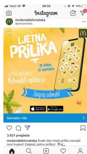
Slika 17: Sponzorirana objava

I na Instagramu McDonald's ima svoje sponzorirane objave koje iskaču korisnicima na naslovnicu koji ih ne prate, time bi htjeli da što veći broj ljudi opazi njihovo ime ili same novitete. Klikom na „Saznaj više“ korisnik se spaja na web stranicu gdje je taj post opisan u detalje.