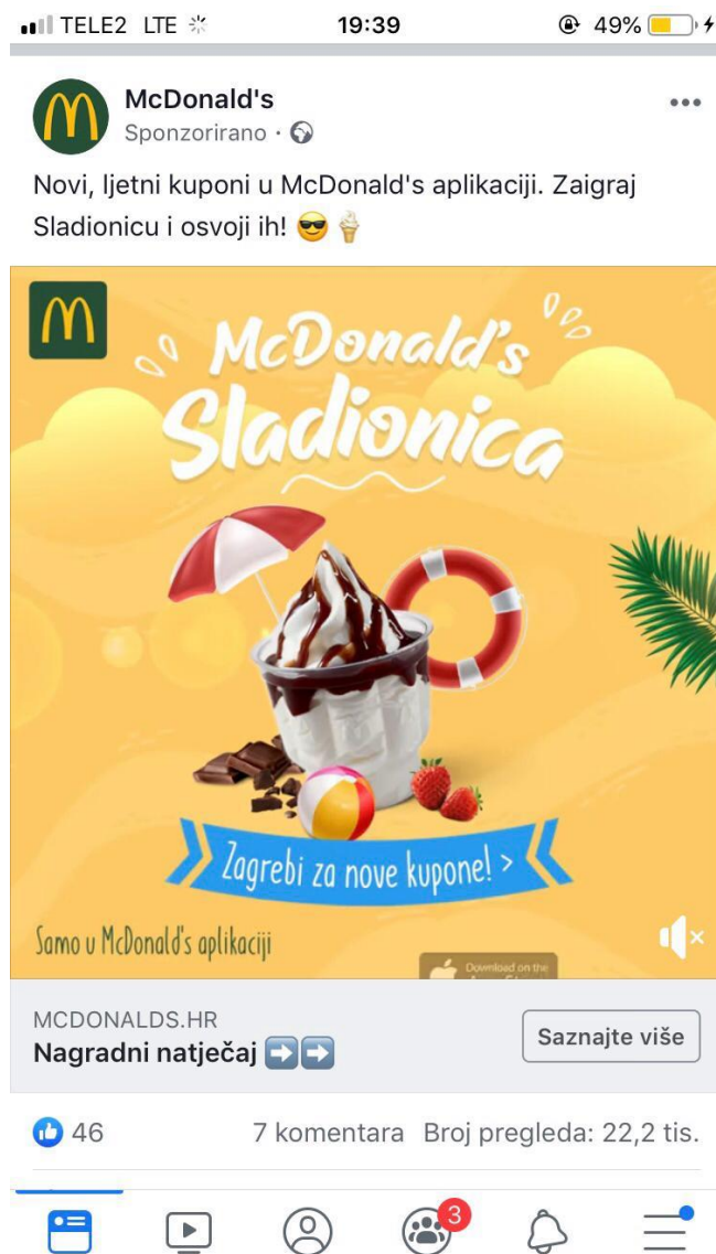
Slika 10: Sponzorirana objava

Objave mogu biti sponzorirane što znači da se pojavljuju na naslovnici društvene mreže iako korisnik ne prati McDonald's stranicu. Na sljedećoj fotografiji također se može uočiti kako se onim korisnicima koji ne prate McDonald's na Facebook-u nudi mogućnost „Saznaj više“ o aktualnom nagradnom natječaju, o kojem će biti riječi u jednom od sljedećih odlomaka, kako bi privukli što veći broj natjecatelja.