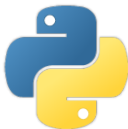
Slika 1: Python logo

Podržava različite programske paradigme, kao što su objektno orijentirana, funkcionalna itd. Prema tome na različite načine se može pristupiti istom problemu. Nastao je 1990-ih godina u Nizozemskoj, a razvio ga je programer Guido van Rossum. Ime je dobio prema kulturnoj britanskoj TV komediji "Monty Python's Flying Circus". Od svojih početaka Python je Open source što znači da je instalacija i preuzimanje besplatno i jednostavno, a izvorni kod je lako dostupan. [18]