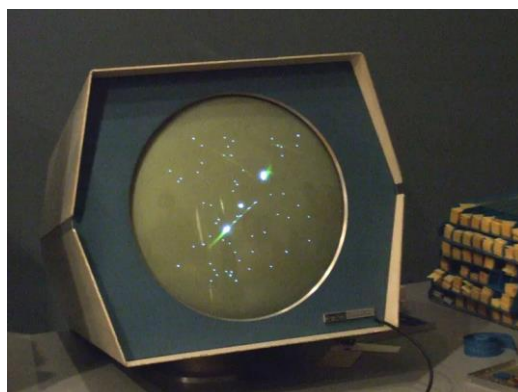
Slika 1. Spacewar u muzeju računalne povijesti.

Za prvu računalnu igru smatra se Spacewar! koju je osmislio Steve Russell sa svojim timom 1962. godine. Tom timu na čelu sa Russell-om je trebalo oko 200 sati da napišu prvu verziju Spacewar-a. Napisana je na PDP-1, ranom interaktivnom mini računalu DEC, a on je koristio ekran s katodnom cijevi i unos tipkovnice. Ovu su igru mogli igrati dva igrača, tako što je svaki od igrača imao pod kontrolom svoj svemirski brod koji su ispaljivali rakete. Bodovi su se skupljali na način da se rakete ispaljuju na protivnika, te se moralo odupirati gravitaciji sunca. (Bellis, 2019)