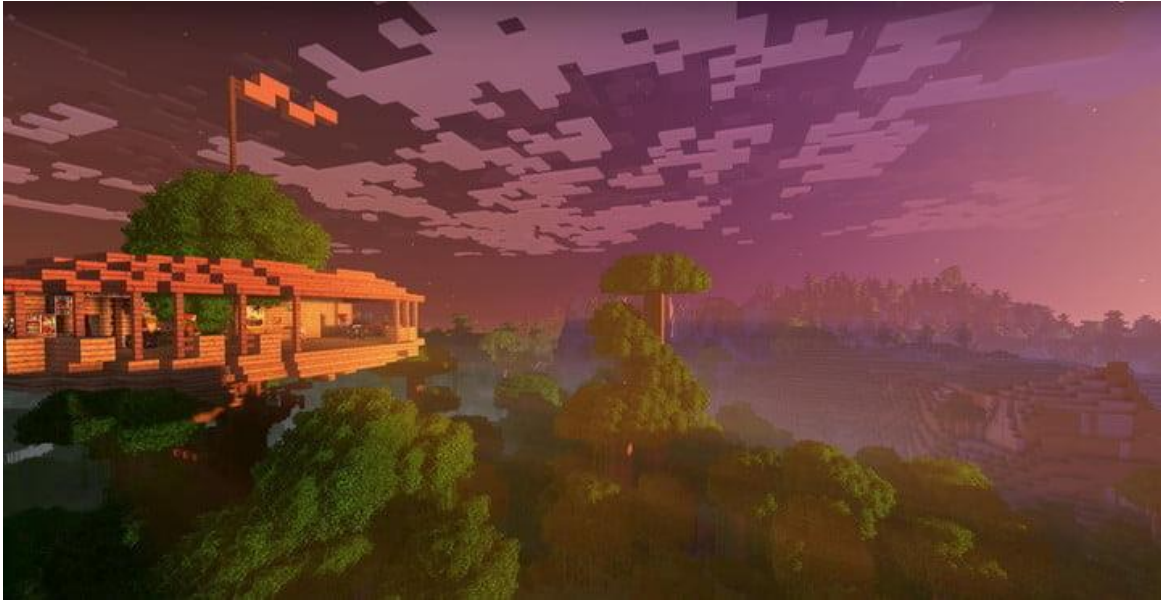
Slika 13. "Open world" prikaz Minecrafta