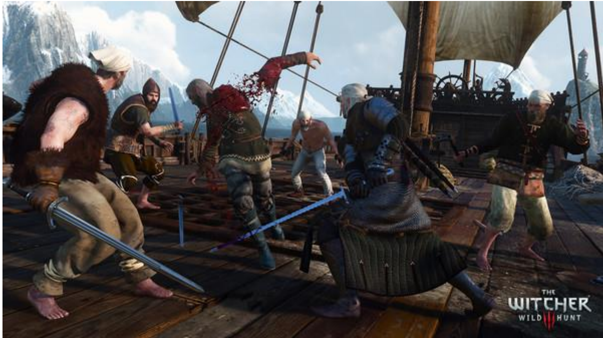
Slika 5. Prikaz slike iz igre The Witcher 3: Wild Hunt

To je RPG otvorenog svijeta temeljen na pričama, priča je postavljena u vizualno zapanjujući fantastični svemir pun značajnih izbora i utjecajnih posljedica. U igri igrate kao profesionalni lovac na čudovišta Geralt iz Rivia, koji ima zadatak pronaći dijete proročanstva u tom golemom otvorenom svijetu bogatom trgovačkim gradovima, gusarskim otocima, opasnim planinskim prijevojima i zaboravljenim pećinama. Lik u igrici je od ranog djetinjstva mutiran kako bi stekao nadljudske vještine, snagu i reflekse, a vještice su protuteža svijetu čudovišnog svijeta. (Steam, n.d.)