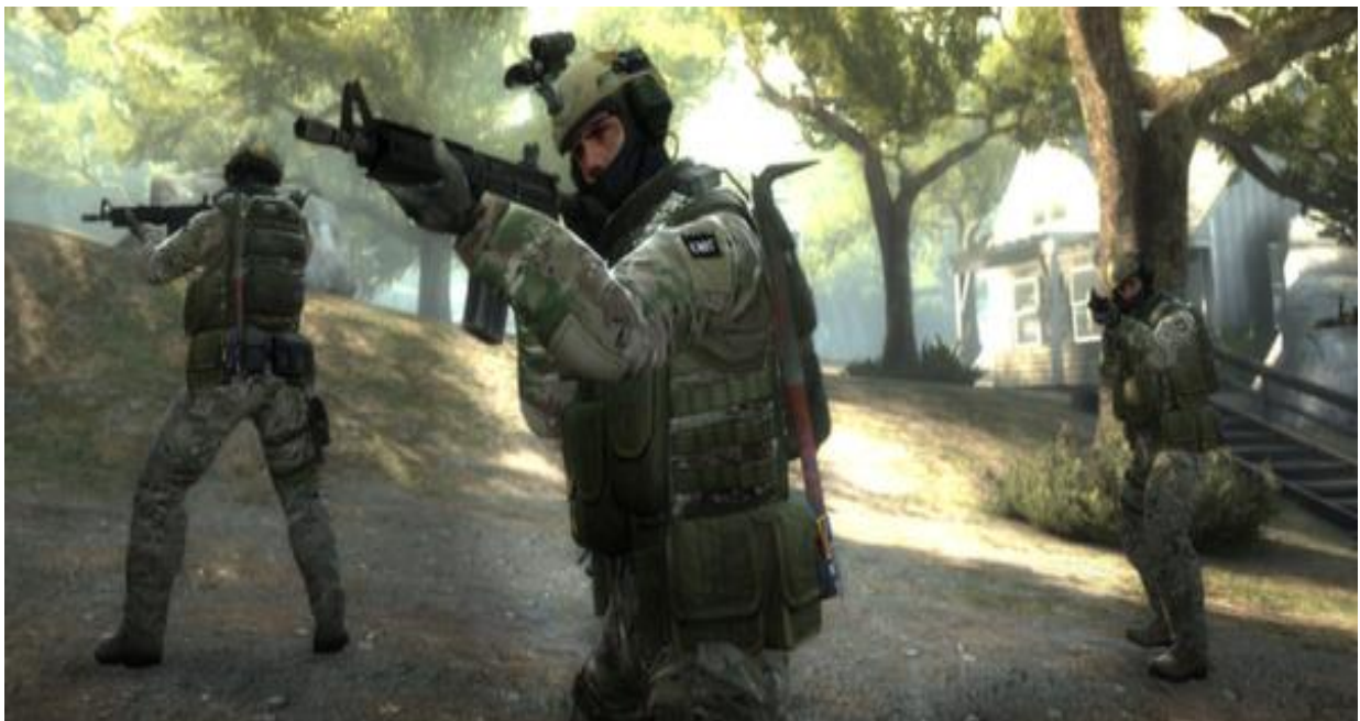
Slika 3. Isječak iz igre Counter-Strike: Global Offensive

A dobar primjer jedne akcijske igre je igra Counter – Strike: Global Offensive. Ova igrice spada u žanr FPS, ali kako smo gore naveli to je jedna podvrsta akcijske igre. U igri se natječu dva tima po pet igrača i cilj ove igre je ako si u timu koji treba postaviti bombu ili postaviti bombu i pričekati da eksplodira ili ubiti sve igrače protivničkog tima, u suprotnom treba bombu deaktivirati ili isto ubiti sve igrače protivničkog tima. (Steam, n.d.)