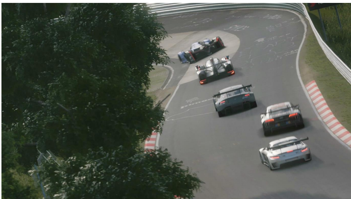
Slika 9. Primjer igre Gran Turismo

Kao primjer igre utrka navest ćemo jedan od popularnih serijala igre Gran Turismo. Zadnja verzija ili zadnji serijal ove igre je Gran Turismo Sport koji je orijentiran na online igranje. U ovome serijalu igrači se natječu u prvenstvima, te mogu predstavljati svoju zemlju u Kupu nacija i voziti za najdražeg proizvođača automobila. U igri su vozila napravljena i rekonstruirana do najsitnijeg detalja, te to igraču daje poseban doživljaj igrajući ovu igru. (Sony, n.d.)