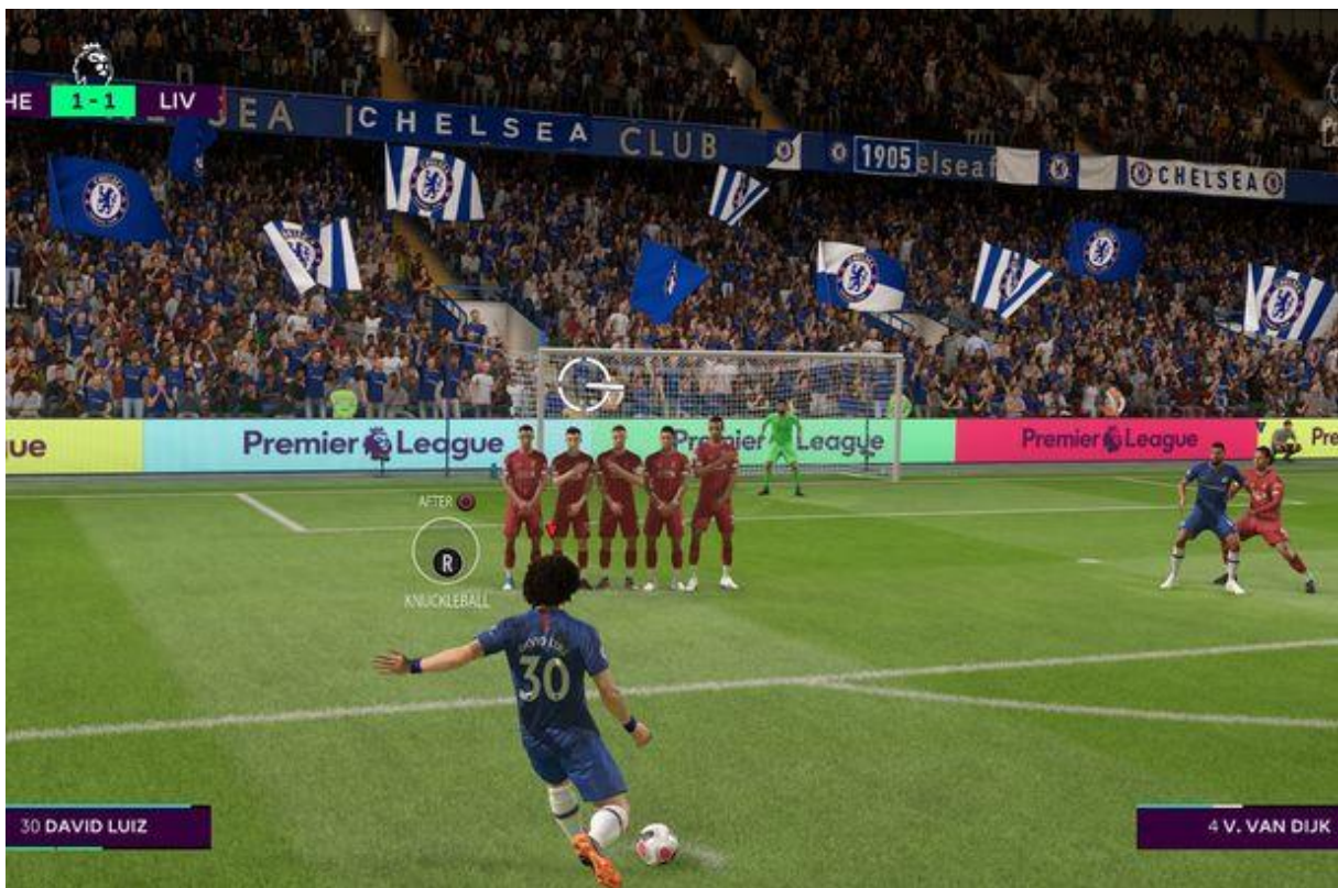
Slika 8. Primjer igre FIFA

U ovome žanru su jedne od najpopularnijih igara na svijetu, a to su serijali FIFA-e, PES-a, NBA 2K, UFC itd. FIFA najpopularnija nogometna igra drži rekord u najbrže prodavane sportske igre ikada. FIFA je igra gdje igrač može upravljati nogometnim klubom ili reprezentacijom kojom želi, te je filozofija vrlo jednostavna, sa svojim timom moraš pobijediti drugi tim protiv kojeg igraš. Naravno u samoj igri još postoje i razne opcije poput managera gdje igrač može voditi svoj klub kroz nogometno prvenstvo, kupovati ili prodavati igrače itd. (Entropiq, 2020)