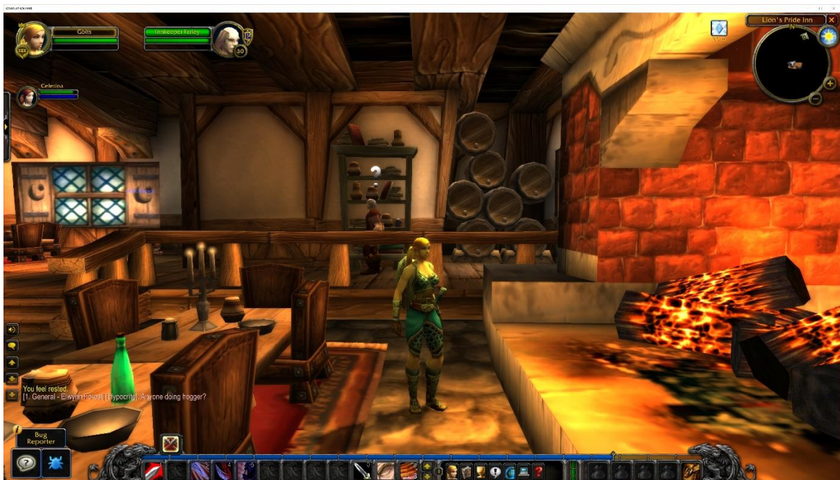
Slika 11. Prikaz igre Worl of Worcraft

Igra je smještena u izmišljenom svijetu Azeroth-a, WoW omogućuje igračima da stvaraju likove u stilu avatara i istražuju prostrani svemir, dok komuniciraju s nerealnim igračima - zvanim ne-igrački likovi (NPC) - i ostalim stvarnim igračima (PC-ima). Razne misije, bitke i misije dovršavaju se sami ili u cehovima, a nagrade za uspjeh uključuju zlato, oružje i vrijedne predmete koji se koriste za poboljšanje nečijeg karaktera. Likovi napreduju ubijanjem drugih stvorenja kako bi stekli iskustvo. Jednom kada se stekne dovoljno iskustva, lik dobiva razinu koja povećava moći lika. Igrači mogu igrati kao druidi, svećenici, lupeži, paladini i druge satove povezane s fantazijom. (Britannica, n.d.)