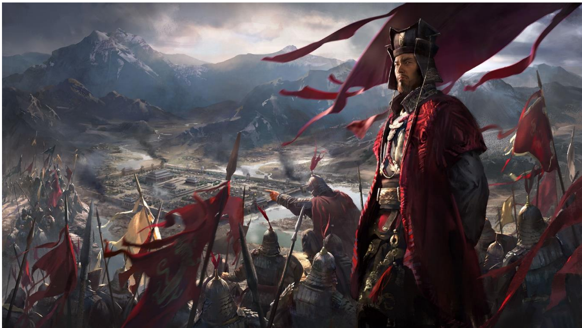
Slika 7. Prikaz igre Total War: Three Kingdoms

Igra započinje 190. godine, u kojoj je nekad slavna dinastija Han bila na rubu propasti. Ustoličenim djetetom Cao Xian, manipulirao je vojskovođa Dong Zhuo, u dobi od osam godina. Ugnjetavajuća vladavina Dong Zhuo-a dovodi do kaosa. Ustaju novi gospodari rata i formiraju koaliciju kako bi započeli kampanju protiv Dong Zhuoa. Međutim, budući da svaki vojskovođa ima osobne ambicije i neprestano mijenja veze, igrač mora koristiti strategiju i taktiku za ujedinjenje Kine i pisanje vlastite povijesti. (Fandom, n.d.)