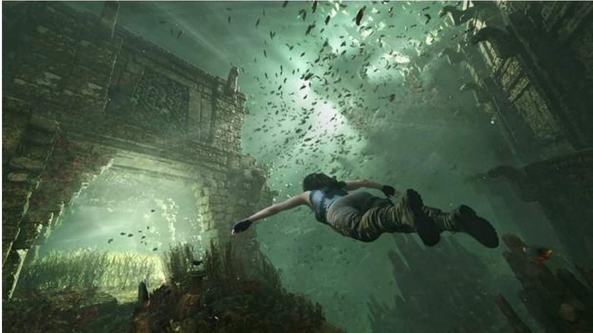
Slika 4. Prikaz iz igre Shadow of the Tomb Raider

Shadow of the Tomb Raider je akcijsko – avanturistička igrica napravljena od strane Eidos Montreal. Priča prati Laru Croft koja prolazi kroz tropske regije Amerike, bori se protiv militantske organizacije Trinity koja je odgovorna za smrt njenog oca. Kroz igru se susreće i sa divljim zvijerima, no kako je lik Lare Croft zaljubljen u arheologiju tako se i kroz igru mogu vidjeti razne predivne lokacije. (HCL, n.d.)