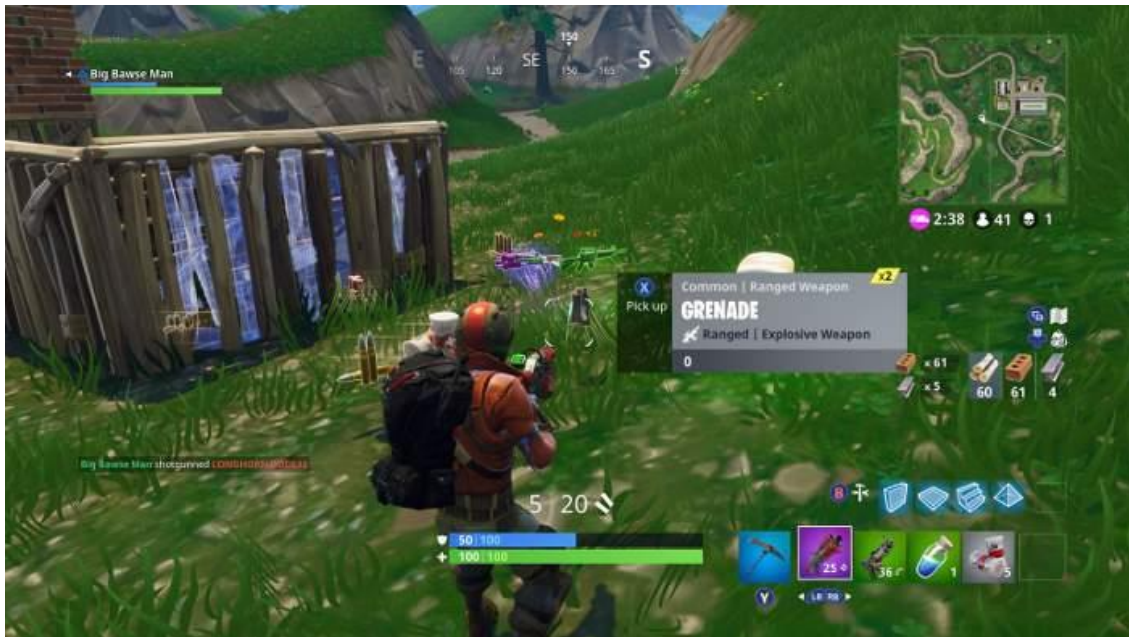
Slika 12. Prikaz igre Fortnite

možete skupljati materijale poput drva, metala ili cigle, a to ćete dobiti tako da srušite drvo, auto ili npr. kuću. Ti materijali služe za samostalnu gradnju, a možete napraviti pod, zidove ili krov koji će vas zaštititi ako neko puca na vas. Što više takvog materijala jedan igrač ima ima veće šanse da ostane zadnji i pobijedi, a naravno za takav pothvat i trijumf igrač mora biti dobro uvježban jer uskladit pucati i graditi je jako teško, te treba dosta igranja i vježbe da sr to uskladi. (PCChip, 2018)