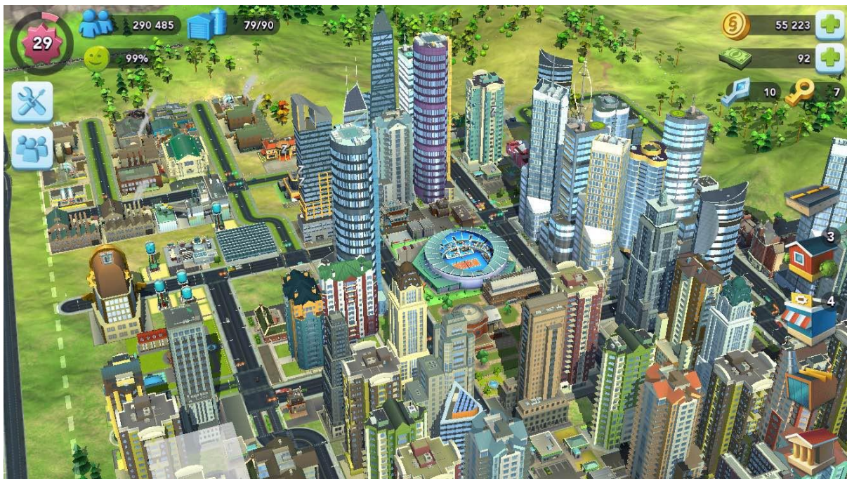
Slika 6. Prikaz slike iz igre SimCity

Dobar primjer može biti popularna igra SimCity. Igru je izvorno dizajnirao Will Wright, a radi se o videoigri u kojoj se gradi grad. Dakle, igrač u igri razvija grad iz puste površine. Sam kontrolira gdje smjestiti svoje razvojne zone, infrastrukturu poput bolnice, škola, cesta, elektrana itd. Igrač također određuje poreznu stopu, proračun, te socijalnu politiku. A taj grad naseljavaju simulirane osobe koje je stvorio sam igrač. Igra nema posebnih uvjeta da bi se pobijedilo u igri nego ravnoteža spomenutih čimbenika pruža ograničenja koja omogućavaju igranje. (Walker, 2006)