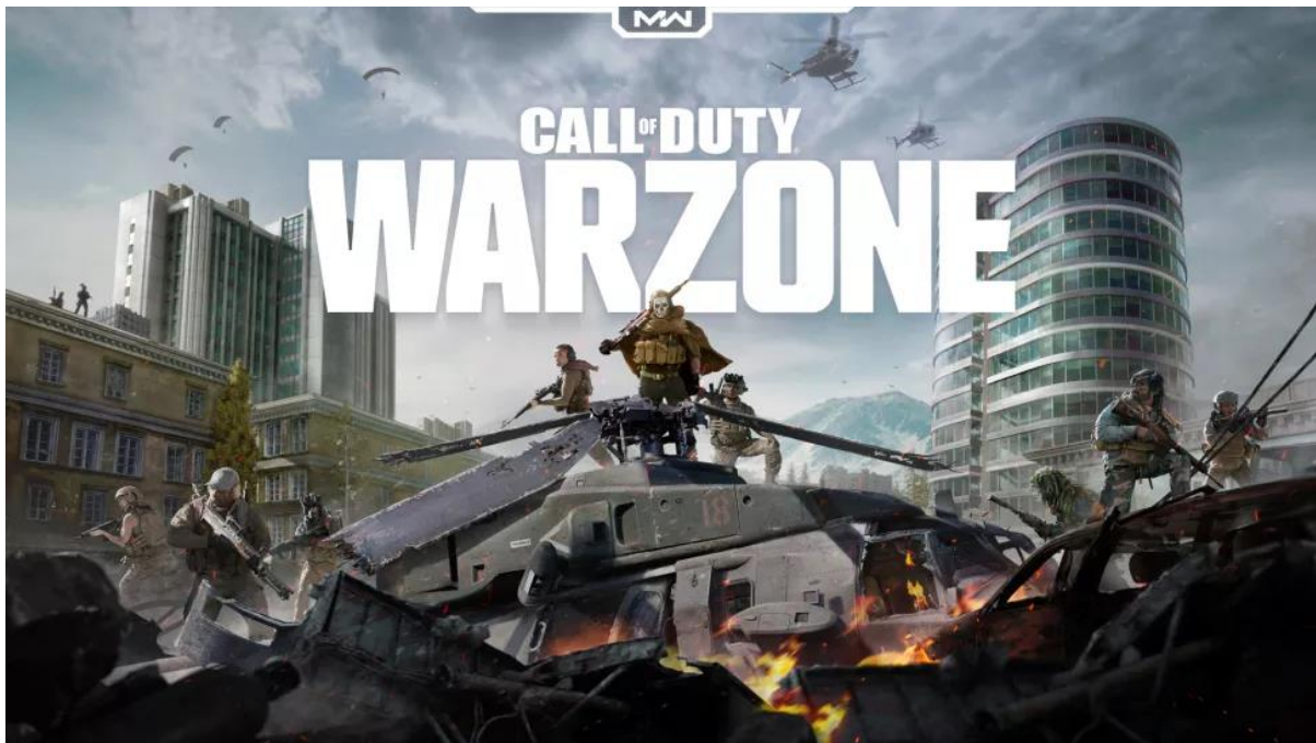
Slika 10. Prikaz slike Call of Duty: Warzone igre