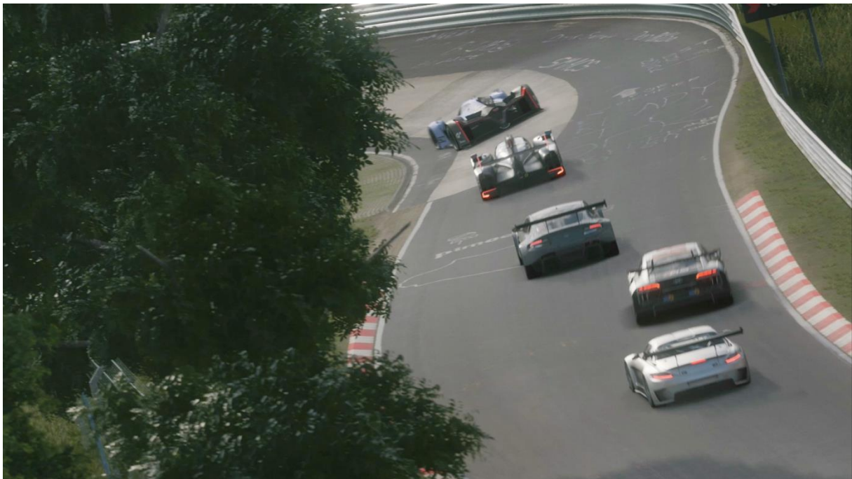
Slika 9. Primjer igre Gran Turismo

Kao primjer igre utrka navest ćemo jedan od popularnih serijala igre Gran Turismo. Zadnja verzija ili zadnji serijal ove igre je Gran Turismo Sport koji je orijentiran na online igranje. U ovome serijalu igrači se natječu u prvenstvima, te mogu predstavljati svoju zemlju u Kupcu nacija i voziti za najdražeg proizvođača automobila. U igri su vozila napravljena i rekonstruirana do najsitnijeg detalja, te to igraču daje poseban doživljaj igrajući ovu igru. (Sony, n.d.)