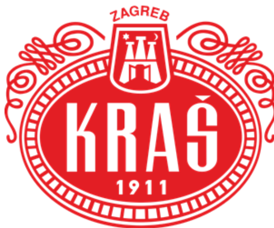
Slika 1: Logo poduzeća Kraš d.d.

Svoju povijest poduzeće započinje u Zagrebu 1911. godine na temeljima tvornice Union koja je proizvodila čokoladu, a danas predstavlja tržišnog lidera svoje industrije. Od samog početka pa sve do danas Kraš d.d. vrlo uspješno razvija svoju tradiciju proizvodnje slatkih proizvoda, i to u sve tri grupe – kakao proizvoda, keksa i vafla te bombonskih proizvoda. ( www.kras.hr )