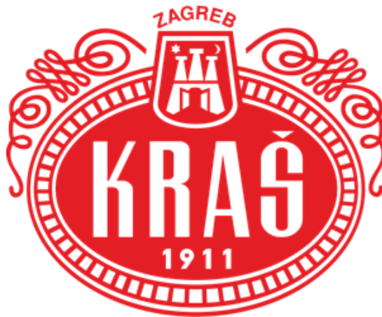
Slika 1: Logo poduzeća Kraš d.d.

Svoju povijest poduzeće započinje u Zagrebu 1911. godine na temeljima tvornice Union koja je proizvodila čokoladu, a danas predstavlja tržišnog lidera svoje industrije. Od samog početka pa sve do danas Kraš d.d. vrlo uspješno razvija svoju tradiciju proizvodnje slatkih proizvoda, i to u sve tri grupe – kakao proizvoda, keksa i vafla te bombonskih proizvoda. ( www.kras.hr )