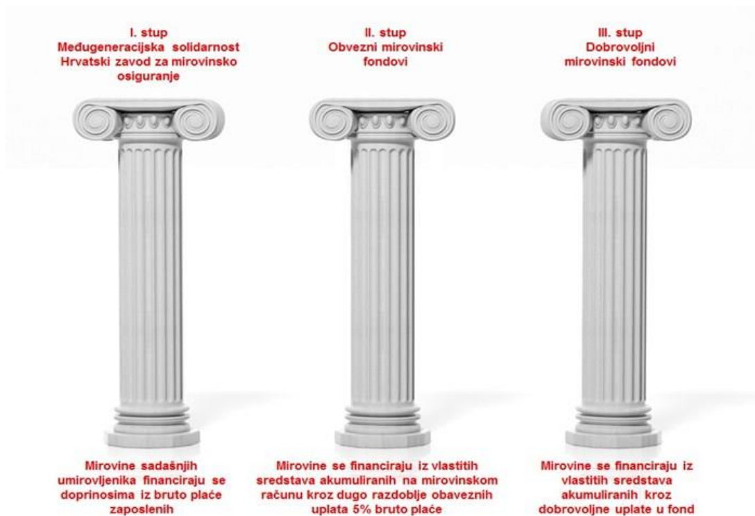
Slika 1 Stupovi mirovinskog osiguranja