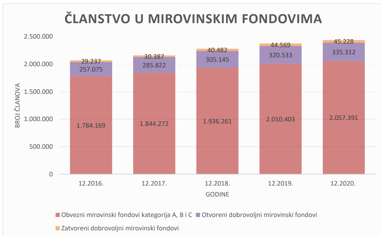
Grafikon 2 Članstvo u mirovinskim fondovima