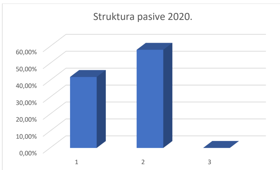
Slika 14. Struktura pasive Crno Jaje

Grafikon 3 prikazuje aktivu poduzeća u 2020. godini u kojoj je najveći udio imala kratkotrajna imovina u iznosu od 98,78%, dok je dugotrajna imovina činila 1,21% aktive i plaćeni troškovi budućeg razdoblja i obračunatih prihoda sa svega 0,01%.