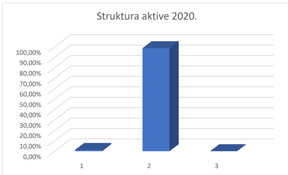
Slika 13. Struktura aktive Crno Jaje

Grafikon 3 prikazuje aktivu poduzeća u 2020. godini u kojoj je najveći udio imala kratkotrajna imovina u iznosu od 98,78%, dok je dugotrajna imovina činila 1,21% aktive i plaćeni troškovi budućeg razdoblja i obračunatih prihoda sa svega 0,01%.