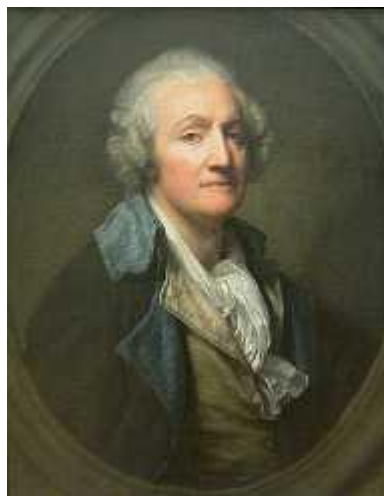
Slika 1: Marquis de Condorcet

Marie Jean Antoine Nicolas Caritat, Marquis de Condorcet, francuski je matematičar koji je živio u 18. stoljeću. Postavio je jedan od najpoznatijih kriterija za određivanje pobjednika u izborima sa preferencijalnim glasanjem koju zovemo „Condorcetov uvjet pobjednika“. Sve metode koje implementiraju taj uvjet kao glavni uvjet pobjede na izborima zovemo „Condorcetovom metodom“. U nastavku će biti opisano kako te metode funkcioniraju te kako se slaže ljestvica kandidata.