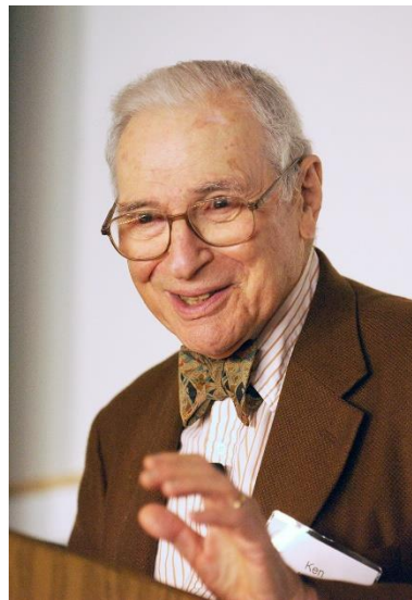
Slika 4: Kenneth Arrow

Teorem je ostavio velike posljedice iza sebe te veliko pitanje o ispravnostima sustava za glasanje te samog društvenog izbora. Ipak, sam Arrow rekao je da se nada kako će ljudi „shvatiti ovaj paradoks kao izazov, a ne kao obeshrabrujuću barijeru“. („Social Choice and Individual Values“, bez dat.)