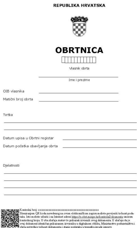
Slika 3. Obrtnica – obrazac

Ministarstvo gospodarstva i održivog razvoja (2021.) navodi da se danas obrt može jednostavno otvoriti putem servisa e-obrt. Usluga se nalazi na sustavu e-Građani. Usluga e-obrt omogućuje iniciranje postupka koji obuhvaća osnivanje novog obrta i upisa promjena u Obrtni registar koji je vezan za postojeće obrte, praćenje statusa iniciranog postupka. Elektronskim putem obrtnici mogu generirati i preuzimati obrtnice, rješenja i službeni izvadak iz Obrtnog registra i sve se to obavlja potpuno besplatno. Nakon što se podaci upišu, zahtjev se šalje nadležnom upravnom tijelu na daljnje postupanje.