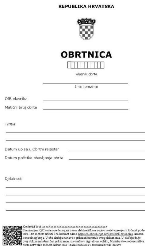
Slika 3. Obrtnica – obrazac (Izvor podataka: Narodne novine, bez dat.)

Ministarstvo gospodarstva i održivog razvoja (2021.) navodi da se danas obrt može jednostavno otvoriti putem servisa e-obrt. Usluga se nalazi na sustavu e-Građani. Usluga e-obrt omogućuje iniciranje postupka koji obuhvaća osnivanje novog obrta i upisa promjena u Obrtni registar koji je vezan za postojeće obrte, praćenje statusa iniciranog postupka. Elektronskim putem obrtnici mogu generirati i preuzimati obrtnice, rješenja i službeni izvadak iz Obrtnog registra i sve se to obavlja potpuno besplatno. Nakon što se podaci upišu, zahtjev se šalje nadležnom upravnom tijelu na daljnje postupanje.