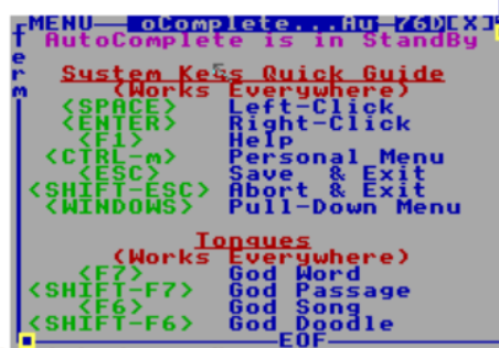
Slika 1. Primjer programa u jeziku HolyC