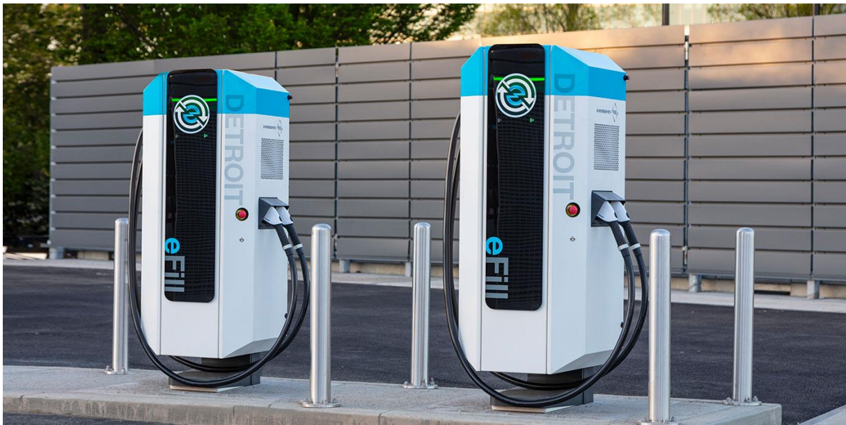
Slika 6. Freightliner Detroit eFill punjač [10]