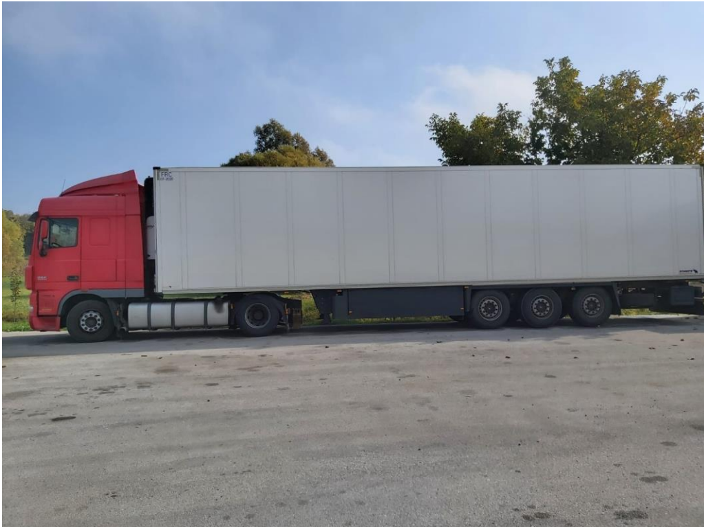
Slika 1. Fotografija tegljača i priključene hladnjače sa rashladnim uređajem

Vozni park poduzeća TRANS-KOS d.o.o. sastoji se od 12 prethodno opisanih prikolica, koje se prema potrebi koriste i za stacionarno skladištenje smrznute ili hladene robe. Rashladni uređaji u toku prijevoza koriste dizelsko gorivo za pogon, a u slučaju stajanja prikolice na centralnom parkingu poduzeća moguće je spojiti rashladni uređaj na električni pogon te na taj način uštedjeti na potrošnji goriva kod hlađenja veće količine robe.