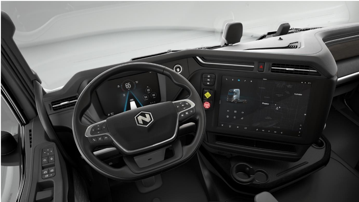
Slika 7. Nikola Tre BEV radno okruženje [13]

pruža prostrano i dobro raspoređenu radnu kabinu vozača, koja nudi okruženje bogato značajkama udobnosti i naprednom tehnologijom. Vozaču Tre BEV tegljača omogućena je visoka vidljivost tijekom vožnje, tako da se vidljivost mrtvih kutova vozača svela na približno maksimum, a šansa nevidljivosti drugog sudionika u prometu svela na minimum. Velika je nepoznanica u svijetu prometa da vozači teretnih vozila imaju ograničenu vidljivost u prometu i veliki postotak nesreća u prometu je izazvan upravo nemogućnošću vozača da primijeti kretanje ostalih sudionika u prometu. Nikola je taj problem riješio ne samo otvorenošću vidnog polja vozača unutar vožnje nego postavljanjem velikog broj senzora i kamera na Tre BEV tegljač. Unutar vožnje vozilo upozorava vozača na tijek prometa i kretanje ostalih vozila na cesti i na taj način omogućuje vozaču vremenski okvir za pravo bitnu reakciju u vožnji. Program i radno okruženje unutar Nikola Tre BEV tegljača može se proučiti i na slici 6.