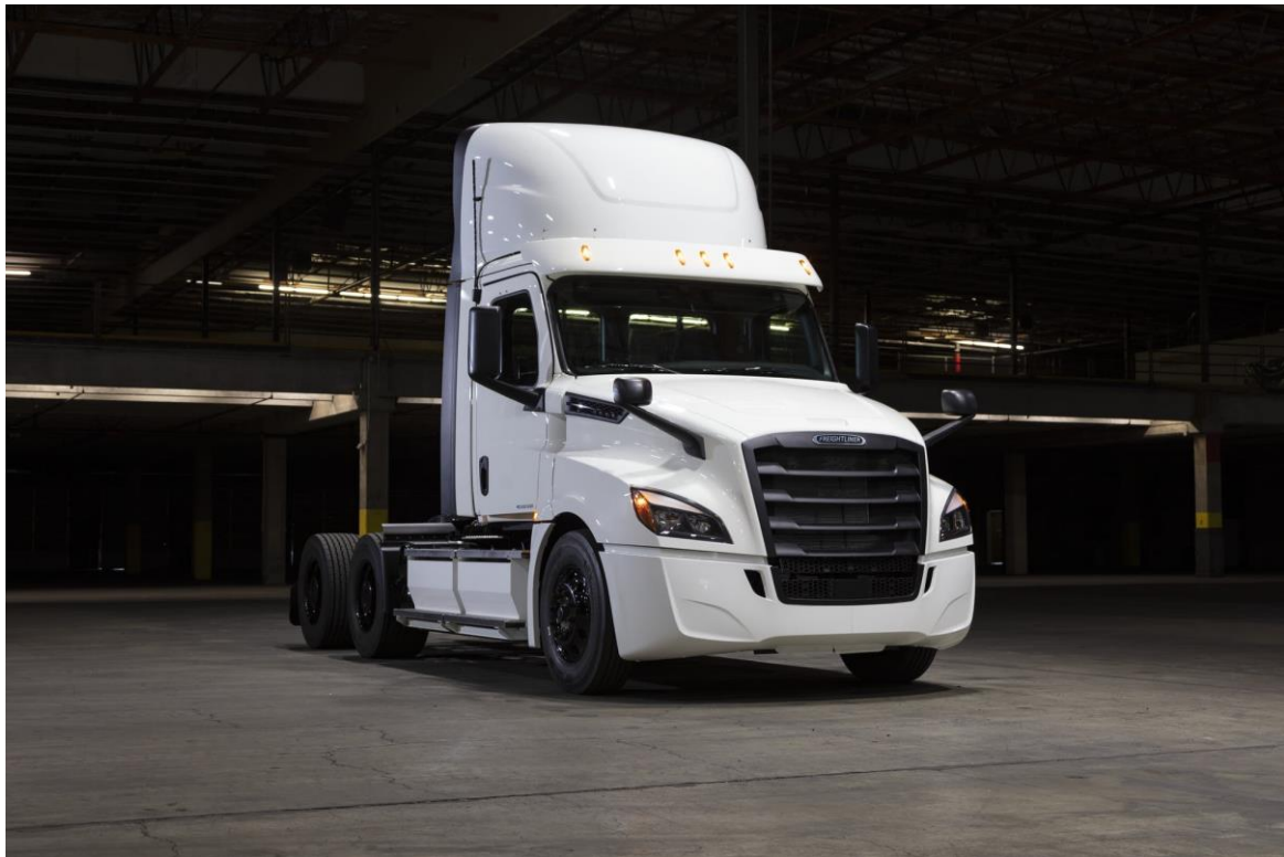
Slika 5. Freightliner eCascadia, Day Photo [9]

Vozilo tipa eCascadia u svojoj namjeni koristi 100% električnu energiju za svoj pogon i za cjelokupni rad izbacuje 0% emisije CO 2 . Freightliner eCascadia ima 37 tona ukupne dopuštene mase vozila i uz tu masu nudi snagu motora od 360 do 500 konjskih snaga. Vozilo koristi bateriju koja može zaprimiti kapacitet od 475 kWh, te prema izračunu ukupne cijene pune baterije, jedno puno punjenje baterije u Republici Hrvatskoj koštalo bi 370,5 kn. Što se tiče samog vremena punjenja takve baterije Freightliner navodi kako se baterija do 80% svojeg kapaciteta sa adekvatnim punjačem puni samo 90 minuta. Takvo malo vrijeme punjenja je od izuzetne važnosti za logističko poslovanje, jer ovakvo vozilo nakon 90 minuta svojeg punjenja može nastaviti sa svojom vožnjom i obavljanjem novog prijevoza. Kako ukupni kapacitet baterije iznosi 475 kWh tako je sa punom baterijom moguće prijeći ukupno 400 kilometara udaljenosti. Freightliner je sa srodnim proizvodnim poduzećem električne opreme Detroit, na tržište plasirao i svoj jedinstveni punjač za liniju vozila eCascadia pod imenom Detroit eFill punjač. Prije navedeni podaci o brzini i jačini punjenja vozila vjerodostojni su sa korištenjem navedenog punjača koji je prikazan na slici 5.