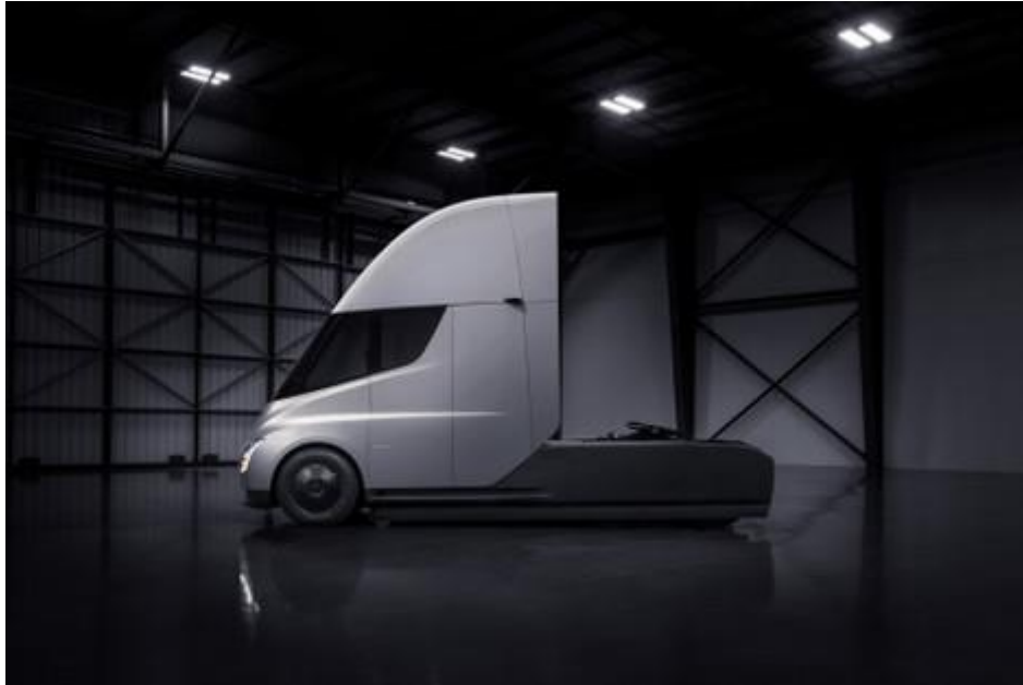
Slika 10. Tesla Semi [18]