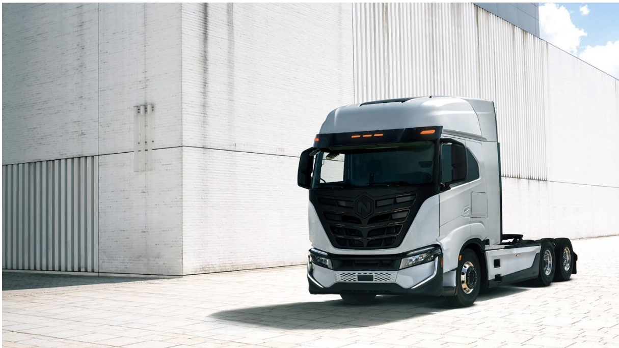
Slika 9. Nikola Tre BEV [15]

Nikola Tre BEV izgrađen je s naprednim značajkama povezivanja kako bi se osigurao sami kontakt vozača i kontrola tegljača unutar voznog parka. Nikola je svojim korisnicima osigurao stalnu korisničku podršku, garanciju i besplatno održavanje vozila unutar pilot programa. U svakom trenutku voditelj voznog parka ima mogućnost saznanja o lokaciji i stanju vozila koji trenutno obavlja prijevoz. Nikola tvrdi kako je najveća prednost ovakvog programskog rješenja unutar voznog parka stalna mogućnost otkrivanja problema. „Ako postoji problem, znat ćete za njega“[12]. Točna i brza procjena problema od velike je pomoći samim vođiteljima prijevoza jer sa samim saznanjima o tijeku prijevoza podiže se stupanj vodstva i organizacije voznog parka i pretvara logistički sustav u inteligentni transportni sustav. Takva pretvorba sustava itekakva je prednost za bilo koje poduzeće unutar logističke djelatnosti. Do sad su se unutar voznog parka trebala unositi raznovrsna informacijska rješenja koja su omogućavala praćenje lokacije i stanja tegljača, Nikola Motor Company je predstavio svoj inovativni sustav koji omogućuje lagan i provjeren sustav praćenja i monitoringa cijelog voznog parka. 2022 godine Nikola Motor Company planira masovnu proizvodnju takvih sustava koji će se širiti na više digitalnih platformi, te sa time planira i proizvodnju 200 – 500 tegljača sa ugrađenim sustavom monitoringa. Fotografija 8. prikazuje Nikola Tre BEV model tegljača.