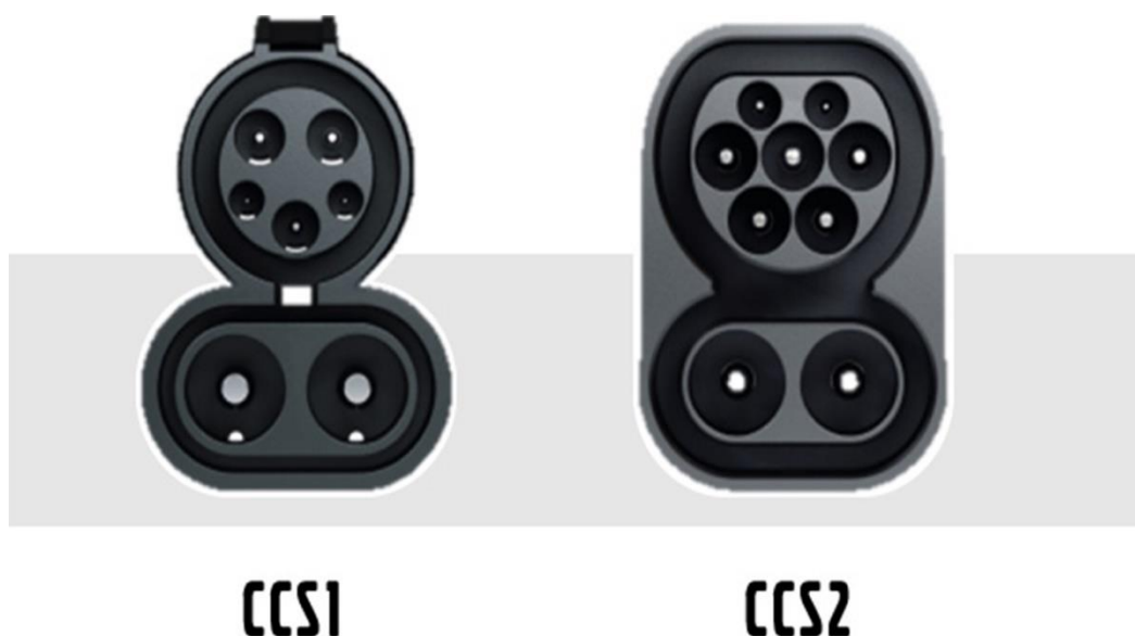
Slika 8. CCS1 i CCS2 utičnica [14]

Samo punjenje baterije modela Tre BEV dolazi sa nekoliko poboljšanja. Za opisani tegljač nije potrebna instalacija posebnog punjača nego je korisniku ovog tegljača potrebna samo CCS1 ili CCS2 utičnica koja prima napon od 240 kW električne energije. Pod takvim naponom omogućeno je punjenje baterije od 10% do 80% u samo 120 minuta. Može se primijetiti kako ovo punjenje i dalje ne uzima previše vremena, ali ipak puno je duže od tradicionalnog punjenja dizelskog motora za koje je potrebno puno manje vremena. Na slici 7. može se proučiti u sama potrebna utičnica koja je jedini preduvjet infrastrukture za uvođenje ovakvog vozila unutar voznog parka iz primjera. Takve utičnice su uvelike popularizirane diljem Europe jer i većina industrijskih pogona koristi ovakve utičnice i već se smatraju standardom za velike industrijske pogone diljem svijeta.