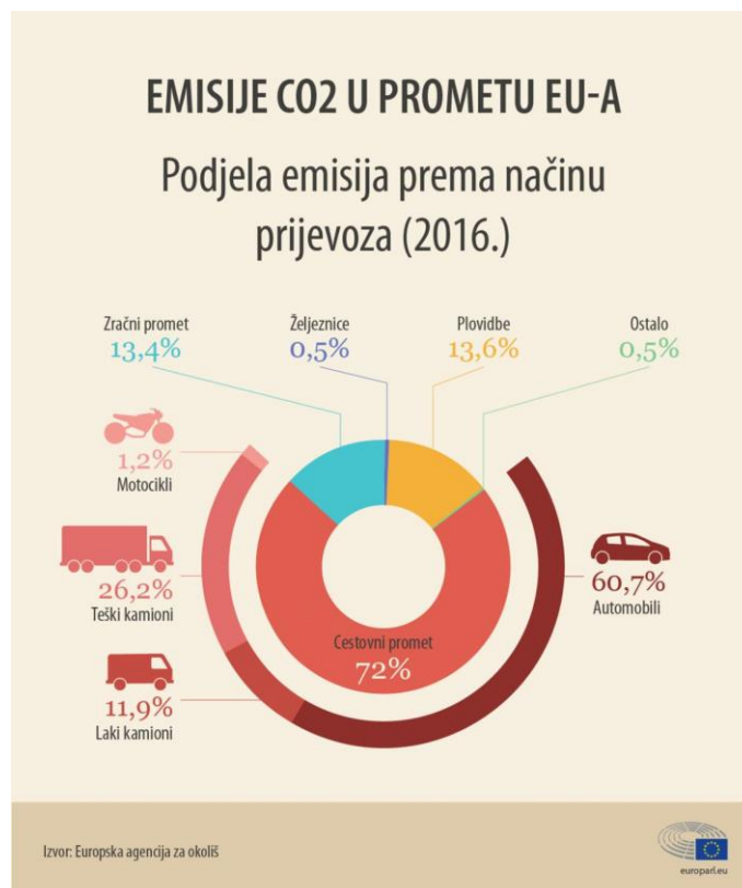
Slika 4. Emisije CO2 u prometu Europske unije [5]