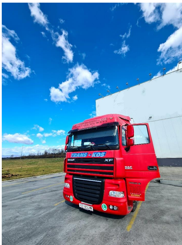
Slika 2. Fotografija tegljača Daf XF 105.460 [autorski rad]

prevozi. Kod iznimno velikih i teških tereta potrošnja postiže čak i do 40 litara na 100 kilometara. Prikupljanjem informacija iz poduzeća utvrđena je prosječna potrošnja transportne jedinice koja obavlja prijevoz od 35 litara na 100 kilometara. Dobivenom potrošnjom i kapacitetom rezervoara izračunata je maksimalna moguća udaljenost koju tegljač sa utovarenim teretom može prijeći, ona iznosi 3 400 kilometara. Prema stranicama Hrvatskog Autokluba danom 5.5.2022. cijena Euro dizela u Republici Hrvatskoj iznosi 13 kuna i 28 lipa[4], prema tomu cijena jednog punog rezervoara vozila iznosi 15 936 kuna. Na sljedećoj fotografiji prikazan je tegljač sa navedenim karakteristikama koje koristi i samo poduzeće iz primjera, a vozilo je kupljeno 2016. godine te se koristi i danas.