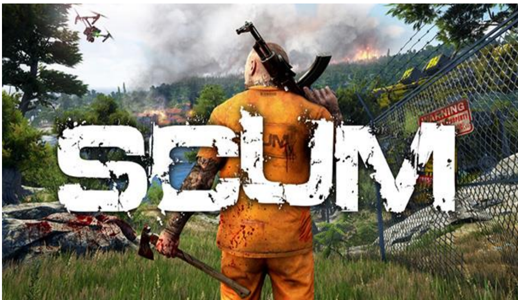
Slika 12. Početni zaslon hrvatske videoigre „SCUM “ [22]

Industrija videoigara u Hrvatskoj je također, kao i u svijetu, jedna od najbrže rastućih industrija. Sam razvoj industrije videoigara u Hrvatskoj započeo je nešto kasnije nego u svijetu, te do sada postoji otprilike 37 godina, što znači da se u Hrvatskoj počela razvijati oko 1985. godine. Prva komercijalna igra koja je nastala u Hrvatskoj bila je „Vruće ljetovanje“, a izdala ju je hrvatska softverska izdavačka kuća Suzy Soft 1985. godine. Pravi početak razvitka industrije se zapravo počeo događati 1993. godine kada je tvrtka Croteam postala pravi studio za razvoj računalnih igara. Croteam je svojim napornim trudom i radom 2001. godine izdao videoigru „ Serious Sam: The First Encounter “ koja je postala popularna, te su od nje odlučili napraviti franšizu, a zadnja serija ove videoigre izdana je 2020. godine. Također, tvrtka koju je bitno za spomenuti je tvrtka Gamepires koja je 2018. godine izdala videoigru „SCUM“, te je ta videoigra jedan od najvećih uspjeha ove industrije na području Hrvatske. [21] Naravno, ovo nisu jedine tvrtke koje su zaslužne za probijanje Hrvatske na tržište industrije videoigara. U Hrvatskoj postoji preko 50 poduzeća i start-up poduzeća koja se bave razvojem videoigara, a za uspjeh mnogih od ovih poduzeća, te trenutni i budući razvoj, zaslužan je inkubator PISMO koji se nalazi u Novskoj.