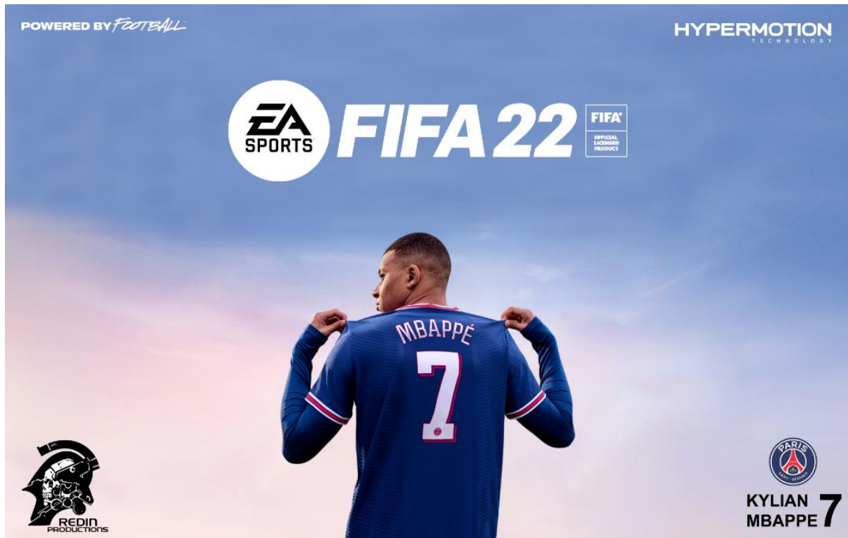
Slika 10. Najava za FIFA-u 22 [19]

Posljednji, ali ne manje važni, žanrovi esporta su trkaći i sportski simulatori. U ovakvim videoigrama cilj je da igrač bude što bolji u što više različitih aspekata videoigre, odnosno da bude što bolji u vožnji različitih vozila ili u igranju u različitim timovima. Najpoznatije igre ovog žanra su FIFA , NBA2K , Rocket League i slične.