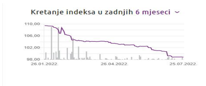
Slika 3: Kretanje Crobisa u zadnjih 6 mjeseci

Na Slici 3. prikazuje se kretanje CROBISA u posljednjih 6 mjeseci, gdje je vidljivo da indeks sada bilježi pad u odnosu na početak godine.