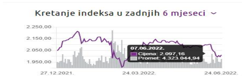
Slika 2: Kretanje Crobexa u zadnjih 6 mjeseci

Prvi obveznički indeks Zagrebačke burze jest CROBIS, a počeo se računati 1. listopada 2002. godine. U tom indeksu cijena svake obveznice određena je sukladno s njenom tržišnom kapitalizacijom. U njegov sastav ulaze državne obveznice, obveznice državnih agencija koje imaju nominalnu vrijednost izdanja veću od 75 milijuna eura, dospijeće veće od 18 mjeseci te fiksnu kamatnu stopu. ("ZSE", 2022)