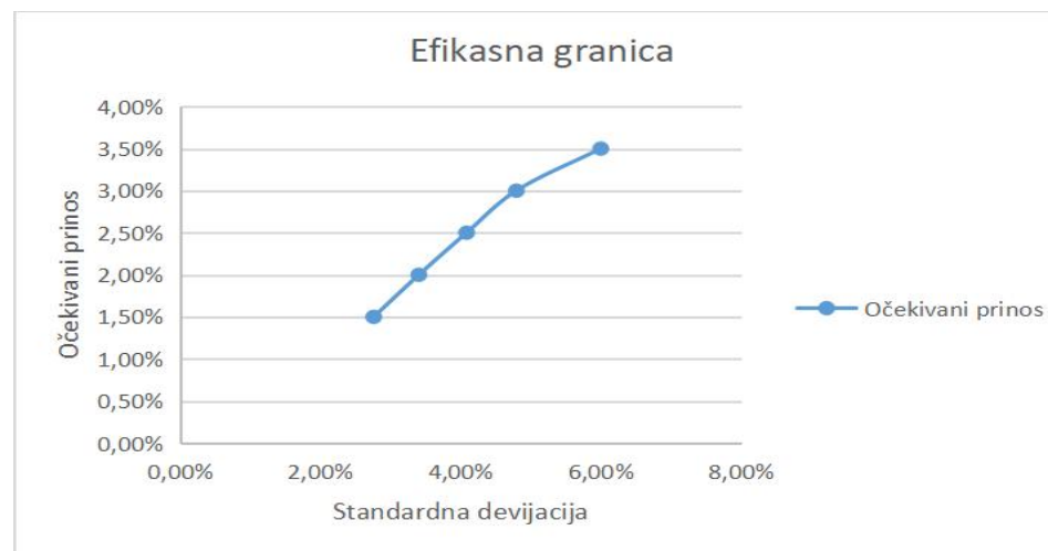
Grafikon 1: Efikasna granica temeljem minimalne varijance