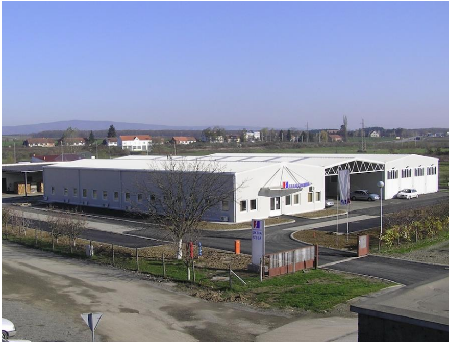
Slika 10: HEP Požega, konstrukcije za halu izradilo poduzeće Magma d.o.o.

konstrukcije iz skladišta. Isto tako, mora se izraditi i ostala dokumentacija u kojoj piše sav utrošeni materijal. Također, pravi se i teretni list za prijevoznika. S obzirom na to da ovo poduzeće radi i na projektima izvan Republike Hrvatske, za takve prijevoznike potrebno je izraditi CMR (Convention), odnosno to je međunarodni sporazum o međunarodnom prijevozu cestom.