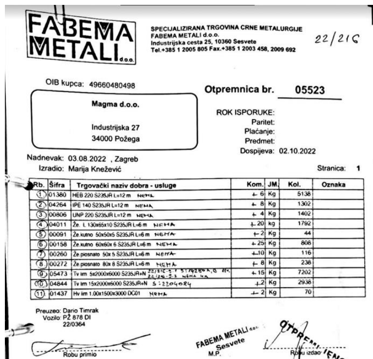
Slika 12: Primjer otpremnice 1

S obzirom na to da u ovom poduzeću ima dosta potrošnog materijala događaju se situacije da prilikom zaprimanja robe, dostavljač nije dostavio sav traženi materijal. Kada se to dogodi, voditelj skladišta pomoću tablet uređaja označava nedostatak tog materijala te će se taj podatak automatski proslijediti u sjedište kojim upravlja voditelj nabave.