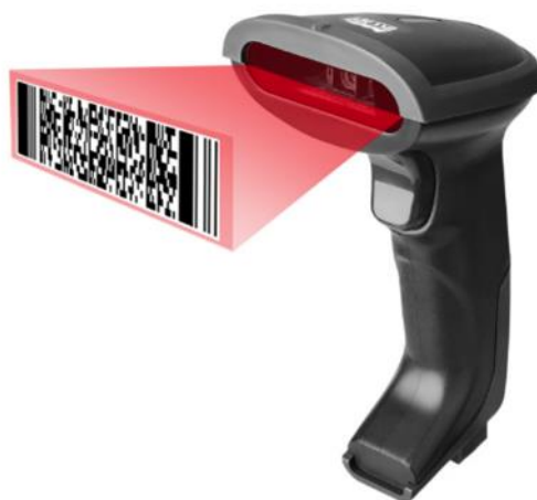
Slika 3: Barkod skener uređaj