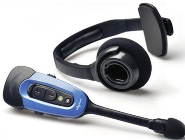
Slika 6: Primjer uređaja za tehnologiju Voice picking

U nastavku slijedi nekoliko prednosti za sustav glasovnog biranja (Picking). Jedna od njih je povećanje učinkovitosti, do koje dolazi zbog toga što se povećava točnost odabira i smanjen je broj pogrešaka te je povećan tempo rada. Također, kao u prošloj tehnologiji, vrijeme obuke je vrlo kratko i jeftino. Kako je spomenuto da su ruke slobodne te zaposlenik ne mora nositi uređaj u ruci, manje je ometanja tijekom izvođenja rada. Zbog ove prednosti, prema [23], zaposlenici će povećati svoju točnost biranja (Picking) za do 85%. Samim time, uz poboljšanje skladišnih procesa, povećat će se i zadovoljstvo krajnjih kupaca.