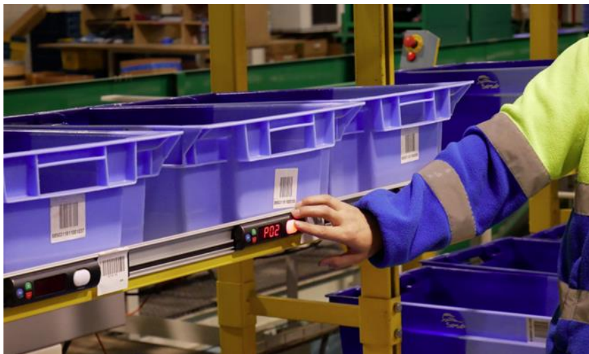
Slika 5: Primjer Pick to Light uređaja u skladištu

Možemo zaključiti da ova tehnologija ima dosta svojih prednosti. Izvrсна je za povećanje produktivnosti i učinkovitosti, kao i za smanjenje pogrešaka prilikom otpreme artikala. Također, za ovu tehnologiju nije potrebna duga obuka, stoga je jednostavna za korištenje [20]. Isto tako, može se instalirati samostalni Pick to Light sustav, ali ovisno o potrebama poduzeća. Moguće je integrirati P2Light sustav s postojećim sustavom upravljanja skladištem (WMS) za bolju kontrolu skladišta. Kao što je spomenuto jedna od prednosti je ta što zaposlenici neće gubiti vrijeme na listanje papira, jer u spomenutoj tehnologiji oni nisu potrebni.