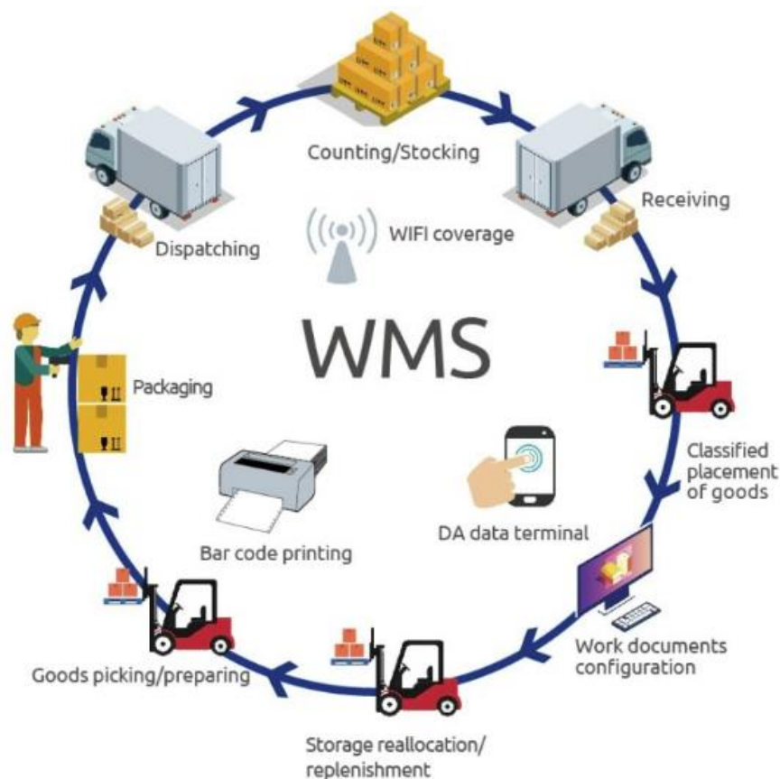
Slika 2: Kružni tok WMS-a

skladištenja uz pomoć predviđanja planova, bolje organizacije, bolje kontrole te koordiniranjem procesa [11]. WMS se sastoji od softvera i procesa koji poduzećima omogućuje kontrolu i upravljanje skladišnim operacijama od trenutka kada se roba ili materijali zaprimaju, do trenutka kada se otpreme iz skladišta. U središtu proizvodnje i operacija opskrbnog lanca su skladišta jer sadrže sav materijal koji se koristi ili proizvodi u tim procesima, od sirovina do gotovih proizvoda. Sama svrha WMS-a je osigurati da se roba i materijali kreću kroz skladište na najučinkovitiji i najisplativiji način (prikaz na slici 2). Također, omogućeno je praćenje inventara, primanje i odlaganje te uvid u inventar poduzeća u bilo koje vrijeme i na bilo kojoj lokaciji, bilo kojem objektu ili tranzitu. Ako sirovine nisu pravilno primljene ili su dijelovi izgubljeni u skladištu, lanac opskrbe može biti usporen ili prekinut. Stoga je WMS-ova uloga od velike važnosti kako bi se svi procesi odvijali bez problema te kako bi roba i materijal bili ispravno pohranjeni i razvrstani. Nazivi tih sustava za upravljanje skladištem su: manualna, automatizirana i automatska [9]. U nastavku rada, spomenuti sustavi će ukratko biti objašnjeni.