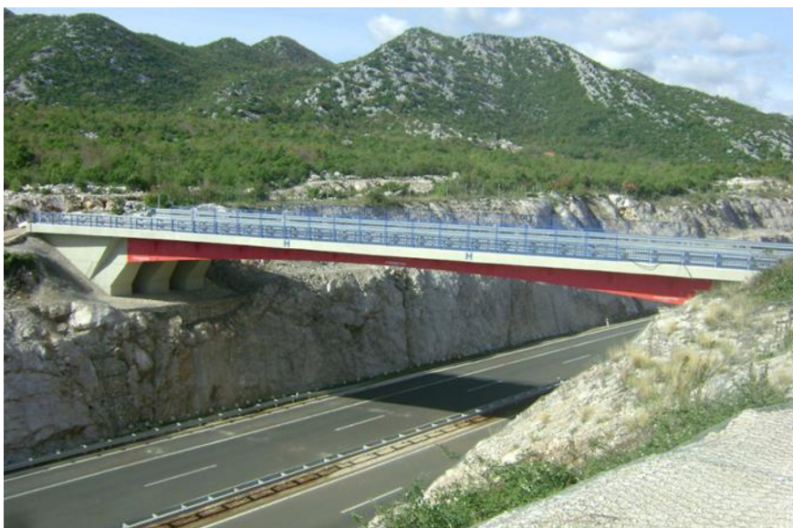
Slika 11: Izrada i montaža podvožnjaka/mosta Ravča