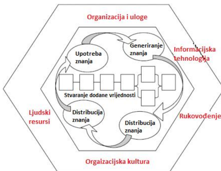
Slika 3. Fraunhoferov referentni model upravljanja znanjem, Izvor: Prilagođeno prema: Wang, M., Zheng, M., Tian, L., Qiu, Z. (2017).

Sve procese upravljanja znanjem opisuje Fraunhoferov referentni model upravljanja znanjem prikazanim na Slici 3.