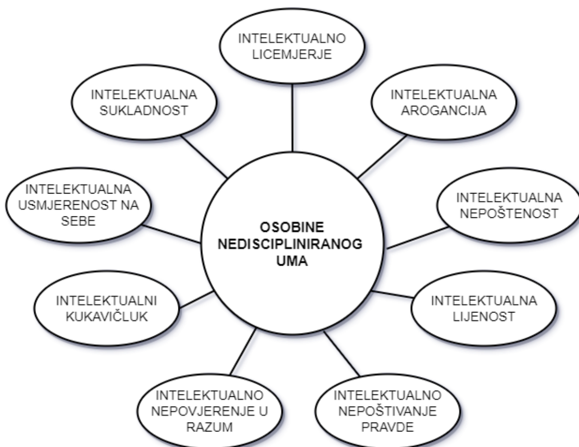
Slika 2: Osobine nediscipliniranog uma (Prema: Paul i Elder, 2019)

Ako želimo pravilno misliti, moramo pratiti pravila rasuđivanja. Znanje teorije uključuje znanje tih pravila. Trebali bi imati znanje klasičnih grešaka koje ljudi rade. Praktični dio, koji da bi ovaj teorijski zaživio moramo provesti u djela. Možemo to činiti vježbom kroz debate i diskusije te misliti ozbiljnije o principima koje smo stekli te stvarati veze između ideja. Što se tiče stavova, cilj je krenuti u debate, zaboraviti stare navike i nositi se s apstraktnim konceptima.