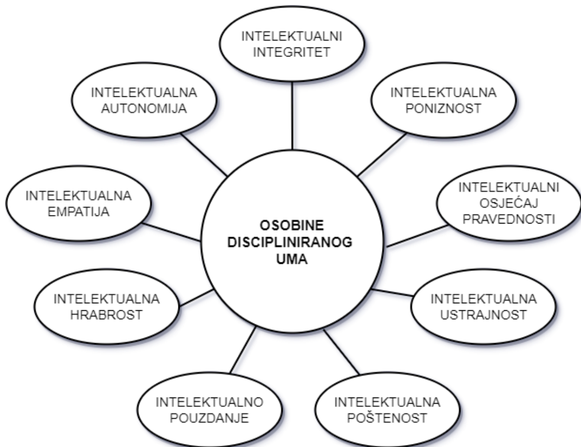
Slika 1: Osobine discipliniranog uma (Prema: Paul i Elder, 2019)

Objasnit ćemo intelektualne osobine discipliniranog uma prema Paul i Elder na temelju njihova dva rada, onog iz 2019. i onog iz 2013. Uz same osobine discipliniranog uma odmah će biti objašnjene i osobine nediscipliniranog uma. Slika 1 prikazuje sve osobine discipliniranog uma dok će Slika 2 prikazati osobine nediscipliniranog uma, a ona se nalazi na kraju potpoglavlja.