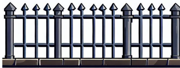
Slika 9. „Ograda“ [9]

Bing Image creator prompt za ogradu (2 komada):