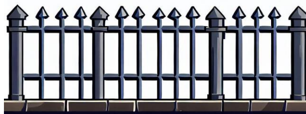
Slika 9. „Ograda“ [9]

Bing Image creator prompt za ogradu (2 komada):