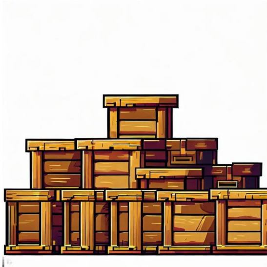
Slika 7. „Kutije“ [9]

Bing Image creator prompt za Kutije (2 komada):