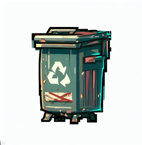
Slika 6. „kanta za smeće“ [9]

„2D video game sidescroller car sprite, cheap car, city, urban, TMNT style, sidescroller game style, blank white background“