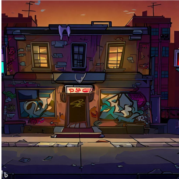
Slika 2. „Pozadinske slike“ [9]

Bing Image creator prompt za pozadinske slike (22 komada):