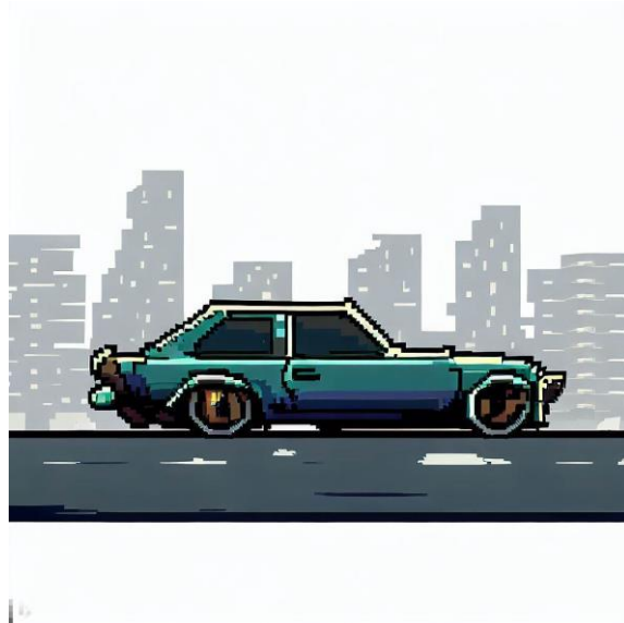
Slika 5. „Automobil“ [9]

Bing Image creator prompt za automobil (5 komada):