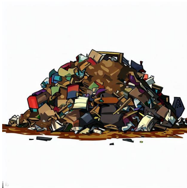
Slika 8. „Hrpa smeća“ [9]

„2D video game sidescroller wooden boxes sprite, urban, TMNT style, sidescroller game style, blank white background“