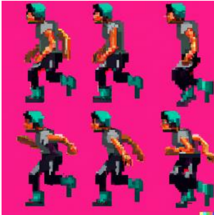
Slika 1. „Spriteovi lika igrača“ [8]

“game assets, 2D sprites, scifi style, pixel art, main character, running pose, male, helmet on, cyberpunk style”