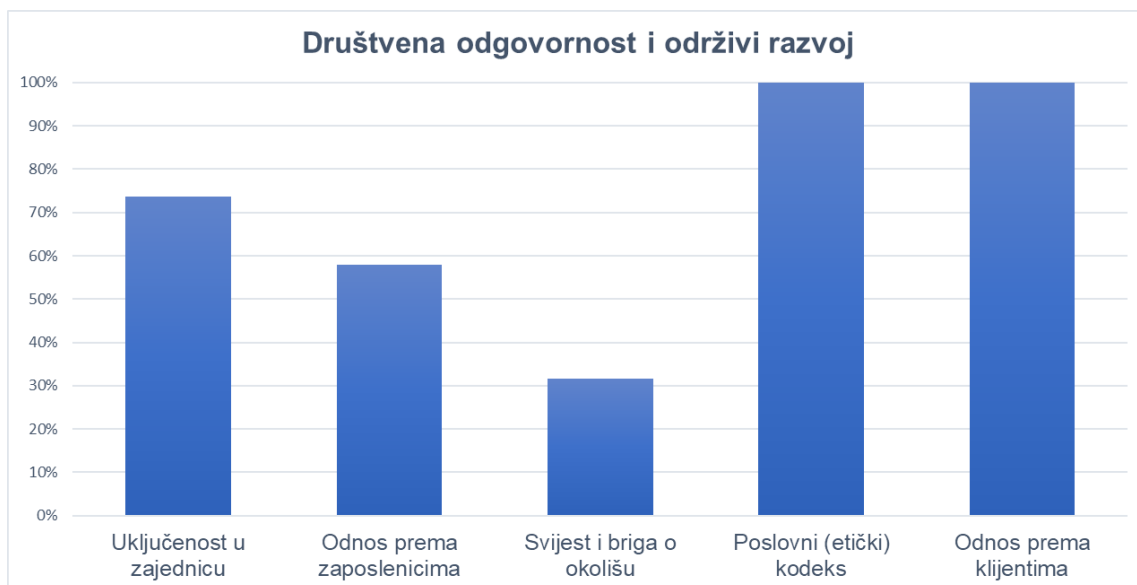
Slika 5. Društvena odgovornost i održivi razvoj poslovnih banaka na području Hrvatske