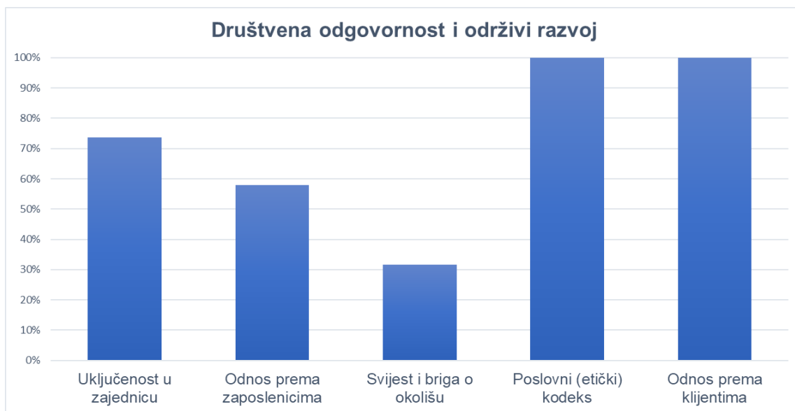
Slika 5. Društvena odgovornost i održivi razvoj poslovnih banaka na području Hrvatske

(Izvor: Samostalna izrada autorice na temelju istraživanja)